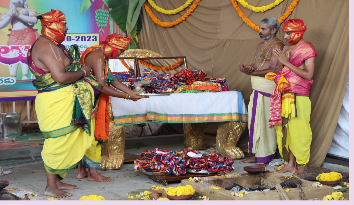
తిరుచానూరు అక్టోబర్ 11 (శ్రీచక్ర)

అప్పలాయగంట శ్రీ ప్రసన్న వేంకటేశ్వరస్వామివారి ఆలయంలో పవిత్రోత్సవాల్లో భాగంగా రెండో రోజు బుధవారం శాస్త్రోక్తంగా పవిత్ర సమర్పణ చేపట్టారు.