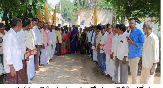
కార్యక్రమం రెడ్డింపు ఉత్సాహంతో సుధారెడ్డికి ప్రత్యేక ఆహ్వానం పలికారు.

ఒక్క అవకాశం ఇవ్వండి మీ గ్రామాలలో మౌలికసౌకర్యాలను పెంపొందించే అభివృద్ధి కార్యక్రమాలను ప్రజలకు తెలియజేస్తూ సమస్యలు తెలుసుకుంటూ భరోసా కల్పిస్తూ ముందుకు సాగుతున్నారు.