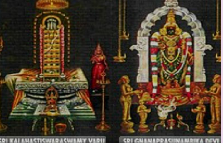
శ్రీకాళహస్తీ అక్టోబర్ 11 (శ్రీచక్ర):

శ్రీ స్వామి అమ్మ వార్ల పబుండి ద్వారా వచ్చిన నగదు 11-10-2023 శ్రీ స్వామి అమ్మ వార్ల పబుండి ద్వారా వచ్చిన నగదును ఈ రోజు లెక్కింపు జరిగింది.