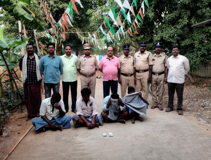
శ్రీ చక్ర వెంకటగిరి

తిరుపతి జిల్లా వెంకటగిరి మండలం అమ్మవారిం గ్రామ సమీపంలో పేకాట స్థావరం పై బుధవారం దాడి చేసినట్లు సబ్ డివిజన్ ఇన్స్పెక్టర్ ఆఫ్ పోలీసులు ఆరుగురు లో నలుగురు పోలీసులు చేతికి చిక్కారని, మరో ఇద్దరు పరారయ్యారు అన్నారు..