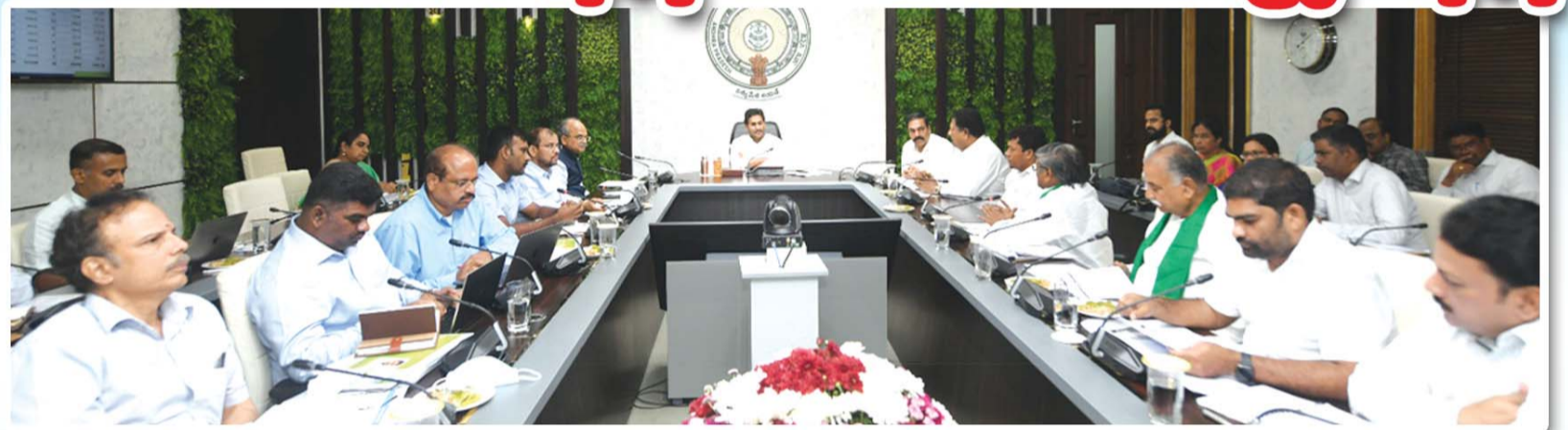
అమరావతి, అక్టోబర్ 11 (శ్రీచక్ర):

ఖరీఫ్ లో ధాన్యం కొనుగోలులో ఎలాంటి అవినీతికీ అస్సారం లేకుండా, మద్దతు ధర లభించేలా చర్యలు తీసుకోవాలని సీఎం జగన్ అధికారులను ఆదేశించారు. ఈ ప్రభుత్వం వచ్చిన తర్వాత మద్దతు ధర ఇవ్వడంతో పాటు, జీఎల్