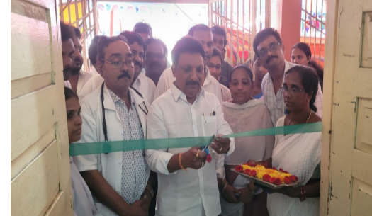
వైద్యాన్ని కూడా వైయస్సార్ పథకంలో ఉచితంగా అందించడం జరిగిందని గుర్తు చేశారు. ప్రజలు జగనన్న ఆరోగ్య సురక్ష శిబిరాన్ని పూర్తిస్థాయిలో వినియోగించుకుని అవసరమైన పరీక్షలు చేయించుకుని మందులను తీసుకోవాలని కోరారు.

ప్రజా ఆరోగ్యమే లక్ష్యంగా తమ ప్రభుత్వం పని చేస్తుందని, వైయస్సార్ ఆరోగ్యశ్రీ పథకం లో 3 వేల 500 కు పైగానే వ్యాసులకు ఉచితంగా వైద్య సేవలు అందుతున్నాయని అన్నారు. అదే మాదిరిగా ప్రభుత్వ వైద్య సేవలను ప్రజలు సద్వినియోగం చేసుకోవాలని కోరారు. ఆరోగ్యాన్ని మించినది మరొకటి లేదని, అందుకే రాష్ట్రంలో ప్రతి జిల్లాలో కూడా మెడికల్ కాలేజీ లను ముఖ్యమంత్రి జగన్ మోహన్ రెడ్డి ఏర్పాటు చేస్తున్నారని అన్నారు. మరీ కొన్ని చోట్ల 30 పడకల ఆసుపత్రులను 50 పడకల ఆసుపత్రులుగా, 50 పడకల ఆసుపత్రులను 50 పడకల ఆసుపత్రులుగా తీర్చిదిద్ది ఆస్థానానిక వైద్య పరికరాలతో ప్రజలకు వైద్యాన్ని అందించే విధంగా చర్యలు తీసుకోవడం జరిగింది అన్నారు. అంతేకాకుండా కరోనా సమయంలో కరోనా