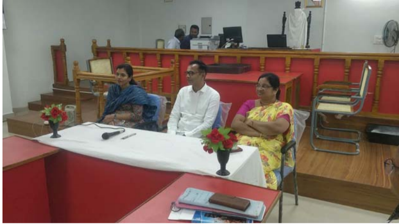
శ్రీకాళహస్తి, అక్టోబర్ 13 (శ్రీచక్ర):