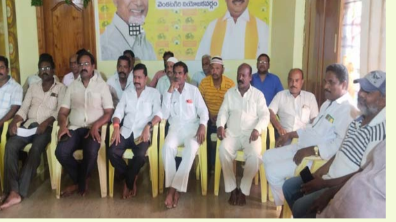
చంద్రబాబు నాయుడు ఆరోగ్య సమాచారం విడుదల చేయాలి