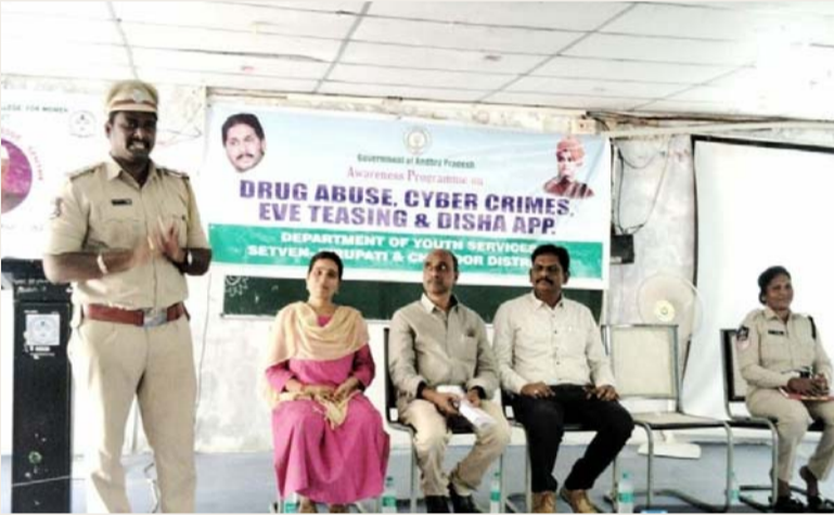
శ్రీకాళహస్తి, అక్టోబర్ 13 (శ్రీచక్ర):