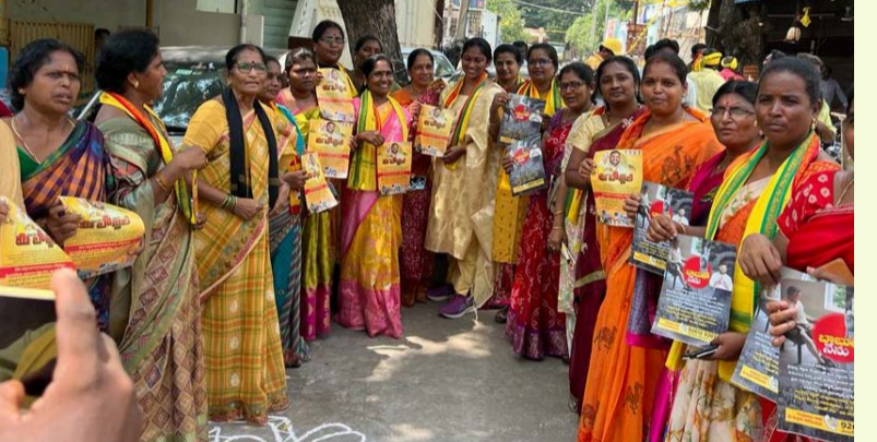
శ్రీకాళహస్తి, అక్టోబర్ 13 (శ్రీచక్ర):