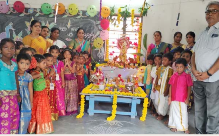
శ్రీకాళహస్తి, అక్టోబర్ 13 (శ్రీచక్ర):