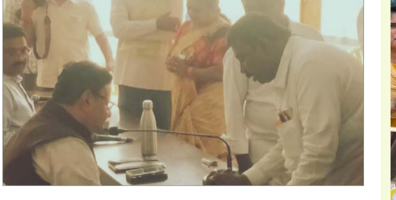
వరదయ్యపాలెం, అక్టోబర్ 13 (శ్రీచక్ర):