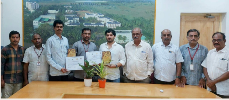
భీమవరం అక్టోబర్ 13: శ్రీ చక్ర