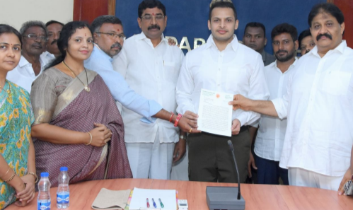
పోరుబాట పడతాం అని పోలీస్ శాఖను పరోక్షంగా హెచ్చరించారు, అసాంఘిక కార్యకలాపాల నిర్మూలన కోసం సామూహికంగా కదిలి వచ్చాం అని తెలిపారు. ఖడ్గ రెండం ఒకటిగా పని చేస్తామని అని తెలిపారు, ఎప్పుడూ కూడా అసాంఘిక శక్తులకు అండగా ఎటువంటి ఫోన్లు కూడా పోలీసు అధికారులకు రావాలని హామీ ఇచ్చారు. రాజకీయ ప్రయోజనాల కోసం వ్యక్తిత్వ హాసం చేస్తే ఇక సహించేది లేదు అని అన్నారు. అంటే డ్యూటీ తెలిపిన ప్రకారం నిజాన్ని ప్రచారం చేయకపోతే అబద్ధం రాజ్యం ఎటువంటి అందుకోసమే తాను నిజాన్ని తెలిపేందుకే బయటికి రావడం జరిగిందన్నారు.

తగిన చర్యలైన కనిపించాలని తెలిపారు. క్రికెట్ టెర్రింగ్ లో వైకాపా వాళ్లు తెదేపావలీ కాకుండా సాధారణ ప్రజానీకం కూడా ఉన్నట్లు తెలిపారు. ప్రాద్దుటూరులో నా ఆధ్వర్యంలో అసాంఘిక కార్యకలాపాలు జరుగుతున్నట్లు టీడీపీ నేతలు ఆరోపణలు ఖండిస్తూ తన తల్లిదండ్రులపై కూడా ఒట్టు వేసుకొని చెబుతున్నారని అలాంటి నీచ చర్యలకు రాచమల్లు పాల్పడని తెలిపారు. రాష్ట్రంలో ఎక్కడ అసాంఘిక కార్యకలాపాలు జరగనట్లు రాష్ట్రాంతం కేవలం ప్రాద్దుటూరులోని అది కూడా నా యొక్క హయాంలోనే మొదలైనట్లు తప్పుడు ఆరోపణలు చేస్తున్నారని ఆవేదన చెందారు, తాను చేస్తున్నది రియల్ ఎస్టేట్ వ్యాపారం, ప్రజాసేవ మాత్రమేనని అన్నారు. వివక్షలు అవినీతి ఆరోపణలు చేస్తే సీబీఐ విచారణ చేయాలని విశాఖ కు వెళ్లి సీబీఐ అధికారులకు వినతిపత్రం ఇచ్చి తనపై తానే విచారణ కోరినట్లు తెలిపారు. జూడ రహిత ప్రాద్దుటూరు గా చూడాలనే ప్రజాప్రతినిధులతో కలిసి వచ్చి ఎస్పీని కోరడం జరిగిందన్నారు, అసాంఘిక చర్యల నిర్మూలన దిశగా చర్యలు తీసుకోవాలని ఎస్పీని కఠిన విన్నవించావని, చర్యలు తీసుకోవోతే ప్రశ్నిస్తాం, తామే