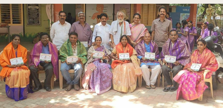
భీమవరం అక్టోబర్ 5 శ్రీ చక్ర