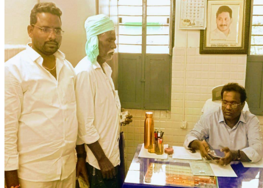
కుట్రపూరిత కారణంతో నా పెన్షన్ తొలగించారని విన్నవించుకుంటానని తిరుపాలు తెలిపారు.

విన్నవించాను. దానికి నీవు గ్రామంలో ఉండడం లేదు అని వాలంటీరు నాగయ్య, వెల్డర్ అసిస్టెంట్ ఓం ప్రకాష్ లిఖితపూర్వకంగా తెలియజేశారని అందుకు నీ పెన్షన్ తొలగించడమైంది అని ఆయన సమాధానం ఇచ్చారు. జూలై ఆగస్టు నెలలలో కూడా నా పెన్షన్ రావడం లేదని ఎండిఓ కు విన్నవించాను. గతంలో కూడా నేను బ్రతికి ఉన్న చనిపోయినట్లుగా చిత్రీకరించి నా పెన్షన్ తొలగించారు. నేను ఒంగోలు గ్రీవెన్స్ సెల్ లో కలెక్టర్ కు, దర్శి గ్రీవెన్స్ లో కలెక్టర్ గారిని కలిసి అర్జీలు సమర్పించగా స్పందించిన అధికారులు ఇతను చనిపోలేదు బతికే ఉన్నాడు అని నిర్ధారించి పెన్షన్ మంజూరు చేశారు. నా పెన్షన్ మంజూరు చేయని యెడల సోమవారం గ్రీవెన్స్ లో కలెక్టర్ తో కలిసి