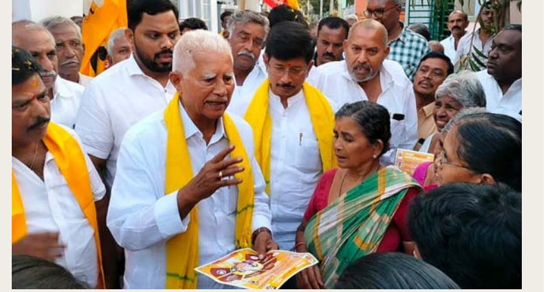
ప్రాధుటూరు, డిసెంబర్ 28 (శ్రీచక్ర) :