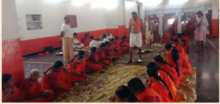
పెద్దకడబూరు, డిసెంబర్ 28 (శ్రీచక్ర) :