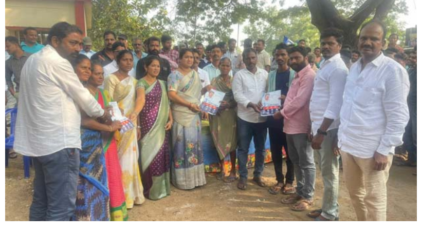
చింతూరు, డిసెంబర్ 28 (శ్రీచక్ర) :

అర్హత ఉన్న ప్రతి ఒక్కరికి ప్రభుత్వం అందించే సంక్షేమ పథకాలు అందించాలని రంపచోడ వరం ఎమ్మెల్యే ధనలక్ష్మి అధికారులకు సూచించారు. చింతూరు మండలం ఏడుగురాళ్ళపల్లి సచివాలయం పరిధిలో గురువారం గడప గడపకు మన ప్రభుత్వం కార్యక్రమాన్ని ఎమ్మెల్యే ధన లక్ష్మి నిర్వహించారు. ప్రతి ఇంటికి వెళ్లి ఈ నాలుగు సంవత్సరాలు కాలంలో వైయస్సార్ నివసి ప్రభుత్వంలో ముఖ్యమంత్రి జగన్మోహన్ రెడ్డి ప్రవేశపెట్టిన సంక్షేమ, అభివృద్ధి పథకాలను ప్రజ