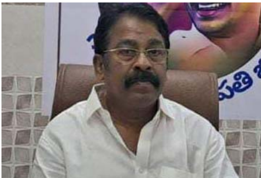
గూడూరు రూరల్, డిసెంబర్ 28 (శ్రీచక్ర) :