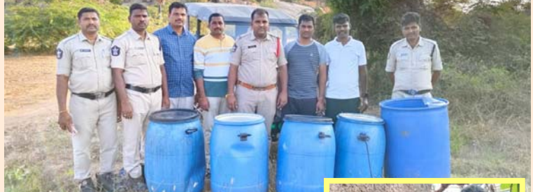
పెద్దకడబూరు, డిసెంబర్ 28 (శ్రీచక్ర) :