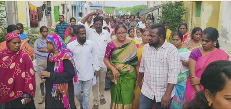
తిరుపతి రూరల్, డిసెంబర్ 28 (శ్రీచక్ర) :