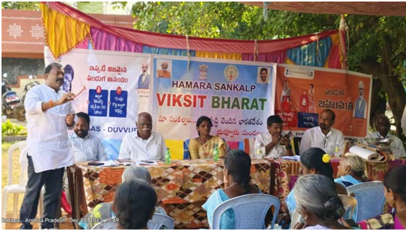
కర్నూలు, డిసెంబర్ 28 (శ్రీచక్ర) :