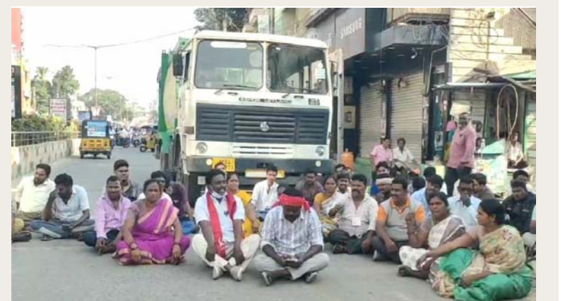
ప్రాధుటూరు, డిసెంబర్ 28