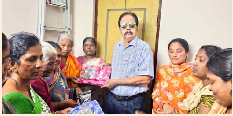
కర్నూలు, డిసెంబర్ 28 (శ్రీచక్ర) :