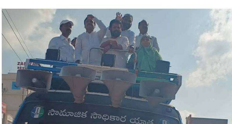
ప్రాధుటూరు, డిసెంబర్ 28