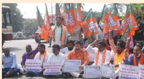
తిరుపతి, డిసెంబర్ 28 (శ్రీచక్ర) :