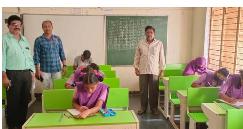
ప్రాధుటూరు, డిసెంబర్ 28 (శ్రీచక్ర) :