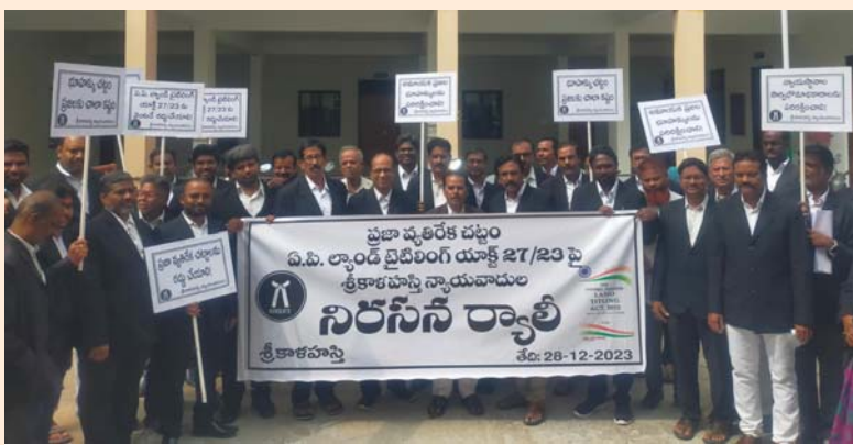
శ్రీకాళహస్తి, డిసెంబర్ 28 (శ్రీచక్ర) :

శ్రీకాళహస్తిలో న్యాయవాదులు కోర్ట్ ఆవరణం నుండి శ్రీకాళహస్తి ఆర్డీఓ,ఎం ఆర్ ఓ కార్యాలయాలకు బైక్ ర్యాలీ గా వెళ్లి తమ నిరసనను తెలియజేసిన అనంతరం వినతిపత్రం అందించారు. న్యాయవాదులు మాట్లాడుతూ.. సామాన్య ప్రజలను ఇబ్బందులకు గురిచేసేవిధంగా రాష్ట్ర ప్రభుత్వం నూతనంగా తీసుకువచ్చిన ఎపి ల్యాండ్ టైటిలింగ్ యాక్ట్ ను(భూహక్కు చట్టం)వెంటనే రద్దుచేయాలని కోరారు. ఈ చట్టం ద్వారా సామాన్య ప్రజలు తమ భూమిపై హక్కును కోల్పోయే పరిస్థితి ఏర్పడుతుందని, ఈ చట్టం అమలు పరచడం వలన సామాన్యమైన తమ సొంత భూమిని నిరూపించుకోవాలంటే హైకోర్టుకు వెళ్ళాల్సిన పరిస్థితి ఏర్పడుతుందని, దీనివలన వ్యయ ప్రయాసలు కలిగి ప్రజలు, రైతులు అనేక ఇబ్బందులకు గురవుతారని వారు తెలియజేశారు. ఈ భూహక్కు చట్టాన్ని రద్దు చేసేవరకు ప్రజలు, రైతుల పక్షాన న్యాయవాదులు నిలబడి పోరాటాలు చేస్తామన్నారు.