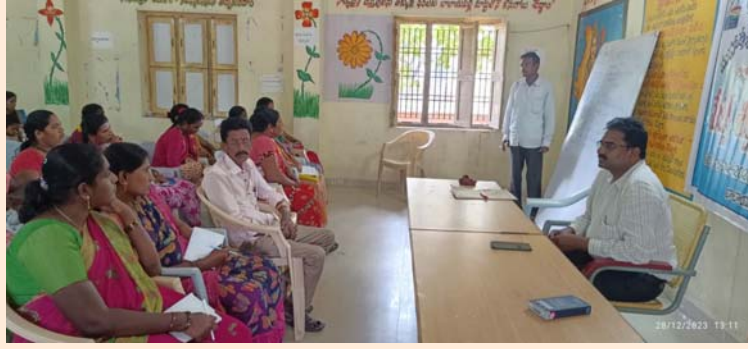
బాలాయపల్లి, డిసెంబర్ 28