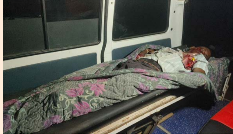
గూడూరు రూరల్, జనవరి 1 (శ్రీచక్ర) :