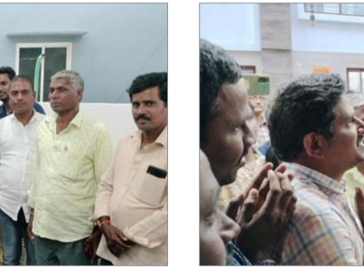
ముఖ్యమంత్రి పాదయాత్రలో ఇచ్చిన హామీని నెరవేర్చే విధంగా ఎన్ ఎన్ ఏ ఉద్యోగులందరినీ రెగ్యులర్ చేయాలని ఉద్యోగ భద్రత కల్పించాలని ముఖ్యమంత్రికి మీ ద్వారా తెలియజేయవలసిందిగా విజ్ఞప్తి చేయడం మరియు విజ్ఞాపన పత్రం సమర్పించడం జరిగింది దీనిలో ఎన్ ఎన్ ఏ ఉద్యోగులందరూ పాల్గొన్నారు. శిక్ష మరియు బక్క కార్యచరణ సమితి తిరుపతి జిల్లా..