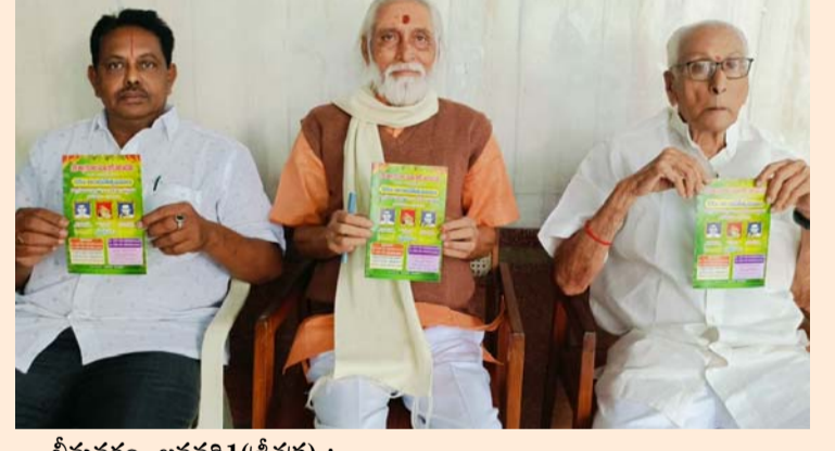
భీమవరం, జనవరి 1 (శ్రీచక్ర) :

● త్యాగరాజ భవనం, అల్లూరి సీతారామరాజు సాంస్కృతిక కేంద్రంలో ఉత్సవాలు.. సన్నాహాలు పూర్తి