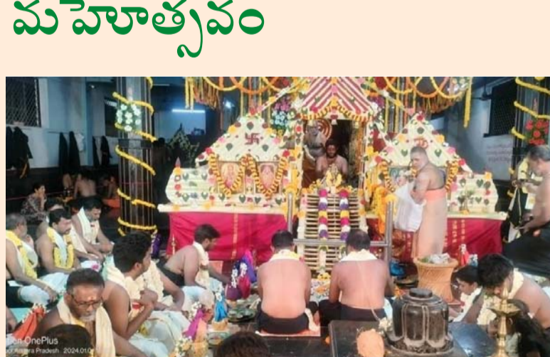
● మణికం అయ్యప్ప స్వామి భక్తి బృందం