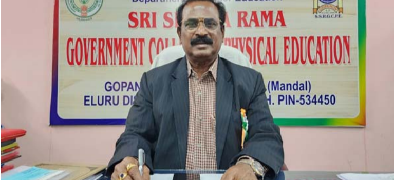
దెందులూరు, జనవరి 01 (శ్రీచక్ర) :