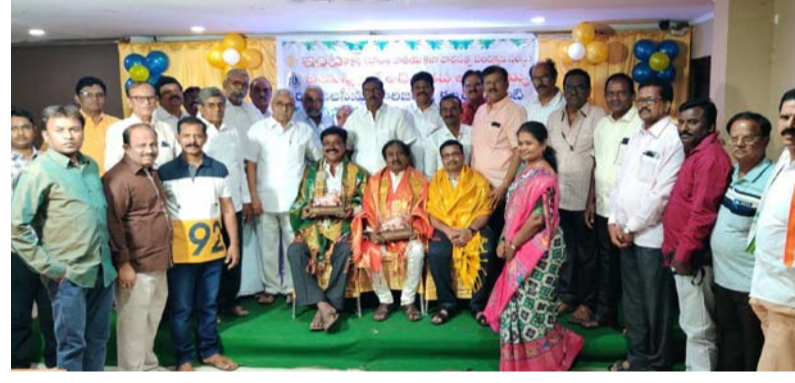
ప్రొద్దుటూరు, జనవరి 1 (శ్రీచక్ర) :