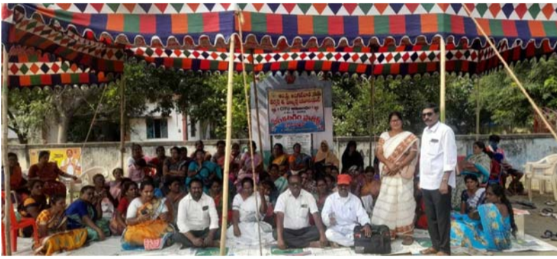
ఎన్ డబ్ల్యూ ఎఫ్ మద్దతు