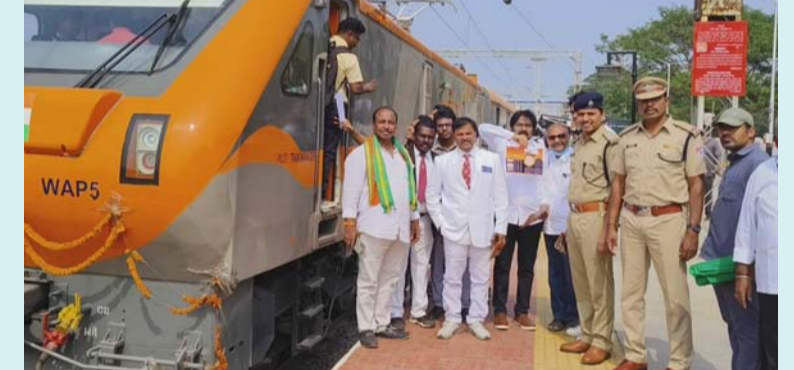
గూడూరురూరల్, జనవరి 1 (శ్రీచక్ర) :