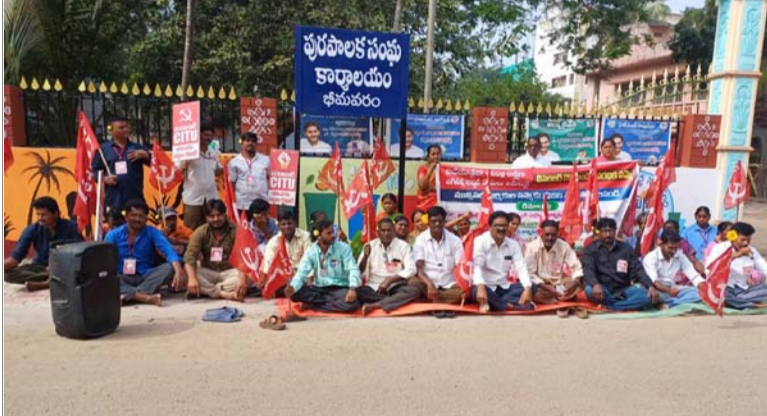
భీమవరం, జనవరి 1 (శ్రీచక్ర) :