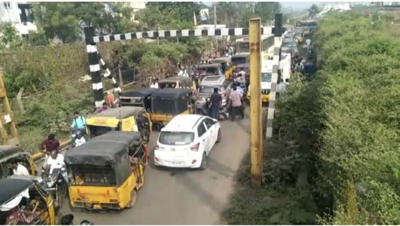
గూడూరు రూరల్, జనవరి 1 (శ్రీచక్ర) :

ప్రతిరోజు వాహనాలకు అంతరాయం గంటల తరబడి వేచి ఉండాల్సిందే ఇప్పటికైనా దానికి సంబంధించిన అధికారులు స్పందించి ట్రాఫిక్ అంతరాయం లేకుండా చేయండి అంటూ గూడూరు స్థానిక ఒకటో పట్టణం నుండి రెండవ పట్టణం కు మరియు వెంకటగిరి కి రాహారికి వెళ్లేందుకు మార్గం మధ్యలో రైల్వే అండర్ బ్రడ్జ్ నిర్మించి