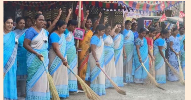
వీరవారం, జనవరి 1 (శ్రీచక్ర) :