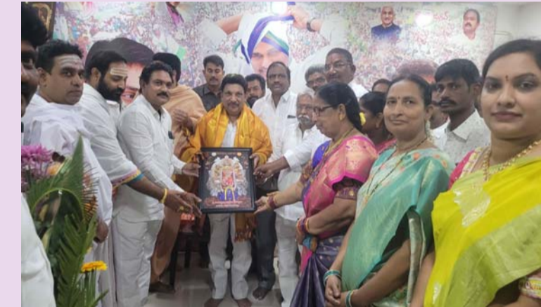
భీమవరం, జనవరి 1