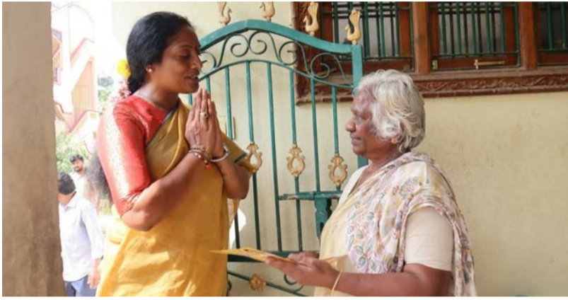
● మీ ఇంటి వద్దకు మీ పులివర్తి నాని బాబు ఘోరిటి భవిష్యత్తుకు గ్యారంటీ కార్యక్రమం