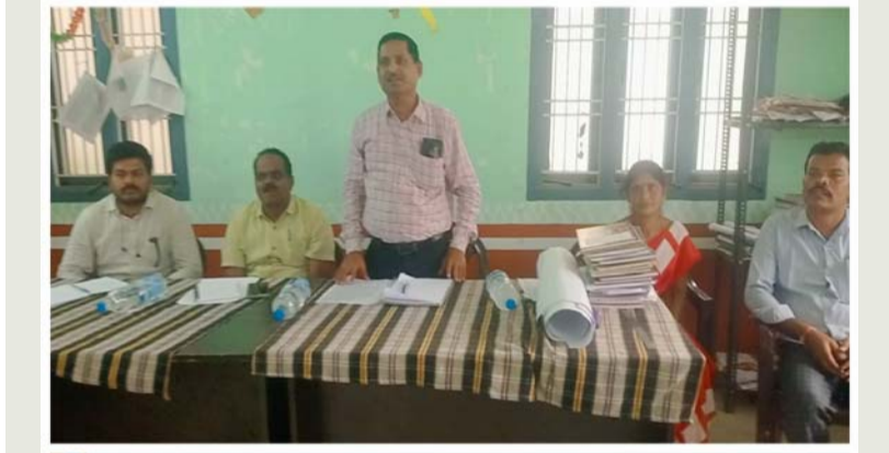
ఉదయగిరి/వింజమూరు, జనవరి 4 (శ్రీచక్ర) :