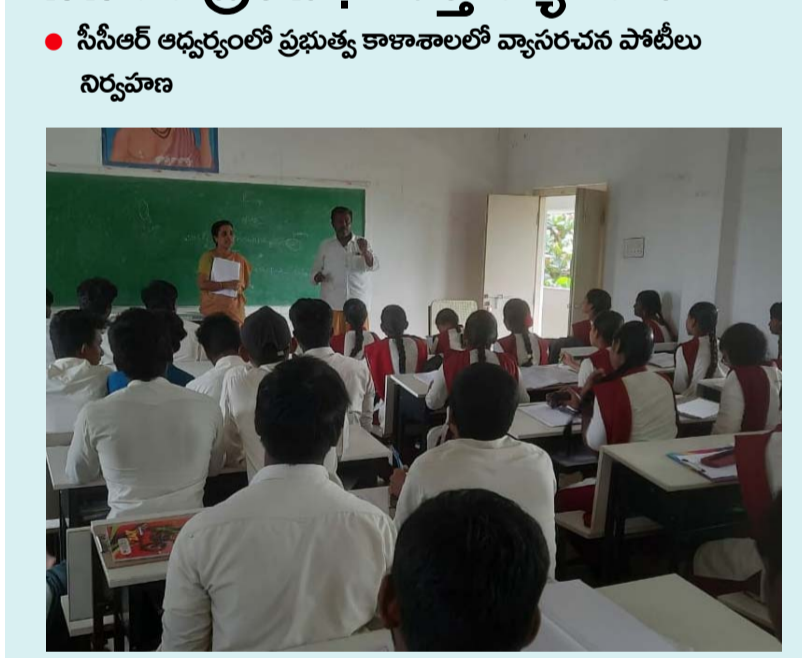
వరదయ్యపాలెం, జనవరి 4 (శ్రీచక్ర) :