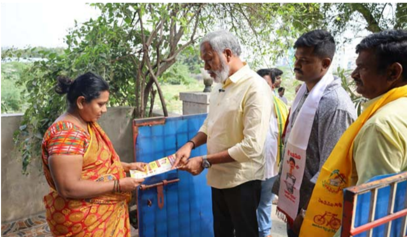
● ప్రధాన సమస్యలు రోడ్డు, కాలువలు, ఇంటి పట్టాలు, తెలుగు గంగ నీళ్లు