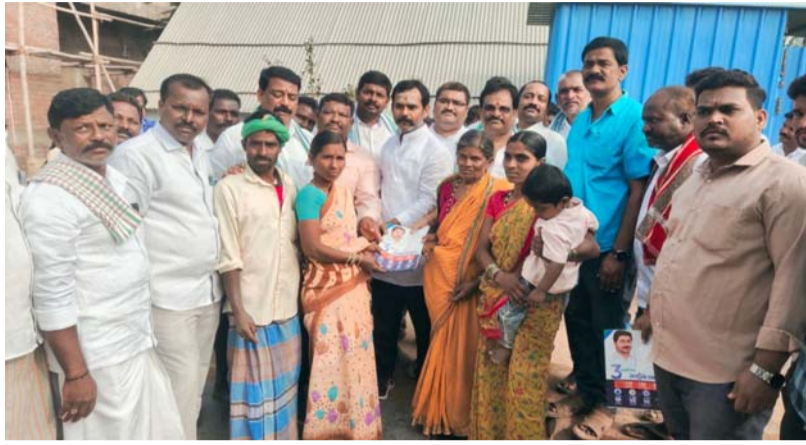
పెద్దకడబూరు, జనవరి 4 (శ్రీచక్ర) :