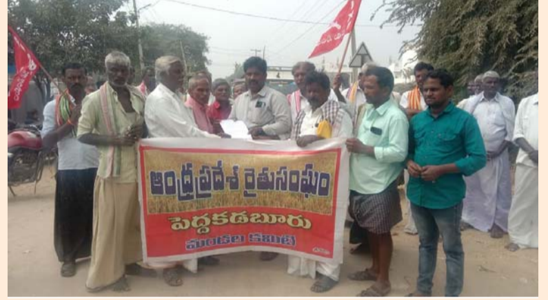
పెద్దకడబూరు, జనవరి 4 (శ్రీచక్ర) :