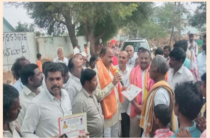
పెద్దకడబూరు, జనవరి 4