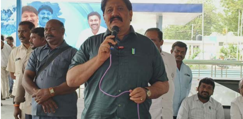
ప్రొద్దుటూరు, జనవరి 9 (శ్రీచక్ర) :