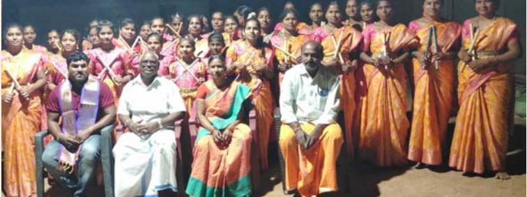
ప్రొద్దుటూరు, జనవరి 9 (శ్రీచక్ర) :