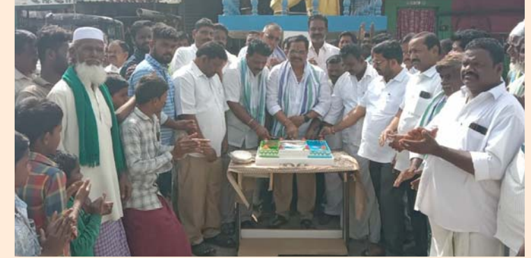
పెద్దకడబూరు, జనవరి 9 (శ్రీచక్ర) :