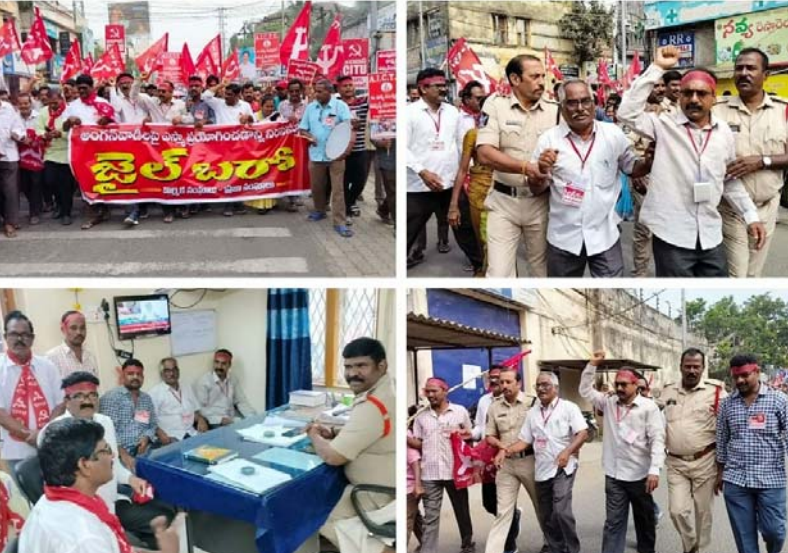
భీమవరం, జనవరి 9 (శ్రీచక్ర) :