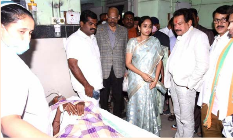
కర్నూలు, జనవరి 9 (శ్రీచక్ర) :

అత్యవసర విభాగంలో ఉన్న రోగులను పరామర్శించి వారి బాగోగులను అడిగి తెలుసుకున్న కేంద్ర ఆరోగ్య శాఖ సహాయ మంత్రి ఎన్.పి.సింగ్ బగేల్