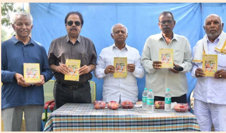
కర్నూలు సెన్సిటీవ్, జనవరి 9 (శ్రీచక్ర) :