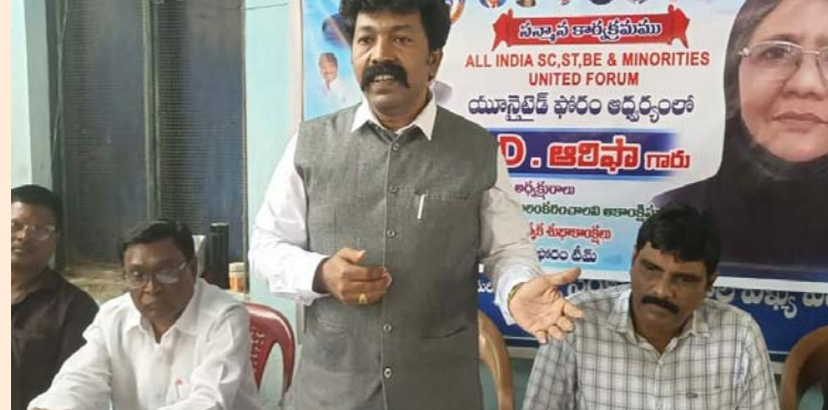
గూడూరు, జనవరి 9 (తీచక) :