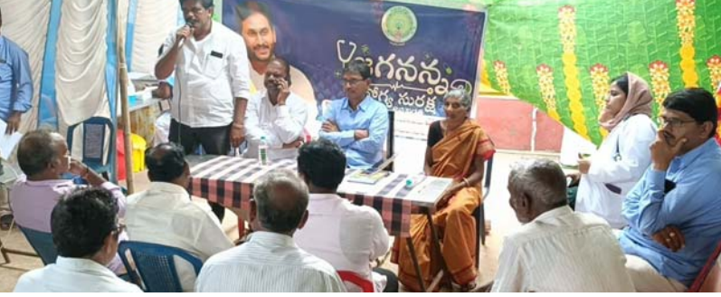
జలదంకి, జనవరి 9 (శ్రీచక్ర) :