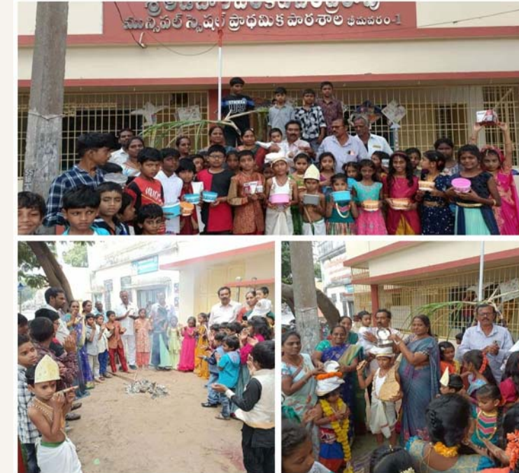
భీమవరం, జనవరి 9 (శ్రీచక్ర) :