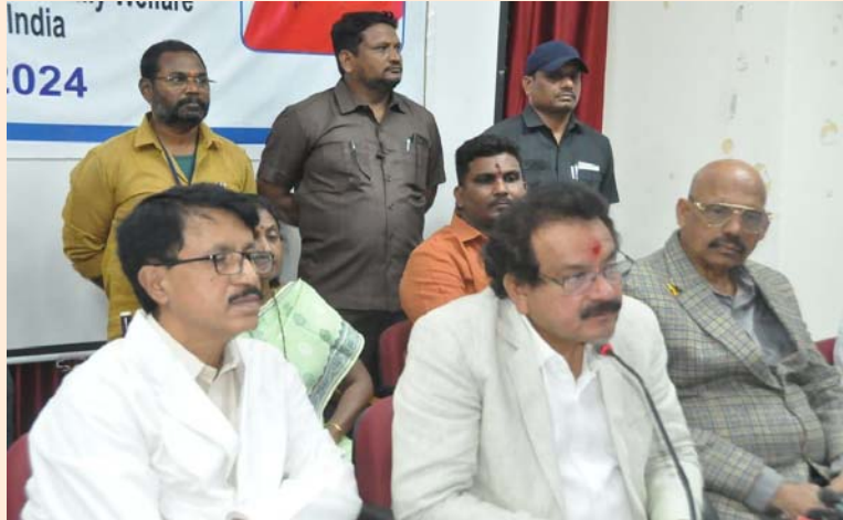
కర్నూలు, జనవరి 9 (శ్రీచక్ర) :

● రాష్ట్ర కేంద్ర ఆరోగ్య కుటుంబ సంక్షేమ శాఖ సహాయ మంత్రి ఎన్.పి.సింగ్ బగేల్