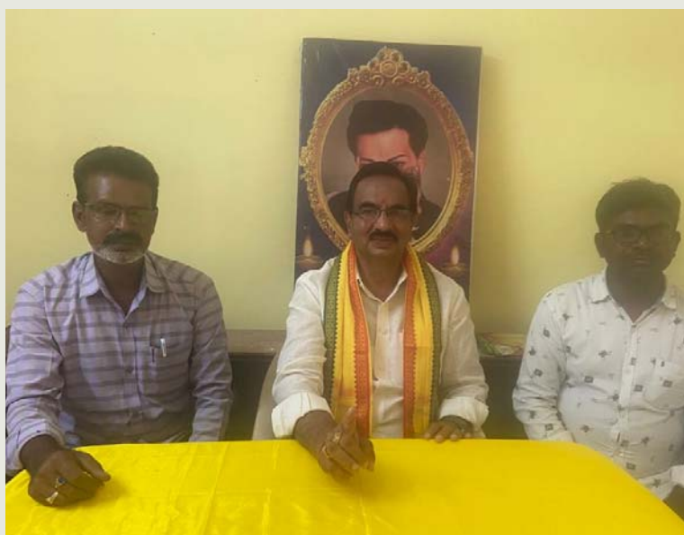
ఉదయగిరి, జనవరి 10 (శ్రీచక్ర) :