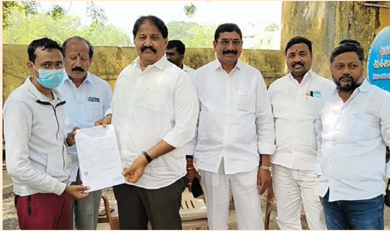
ప్రొద్దుటూరు, జనవరి 10 (శ్రీచక్ర) :