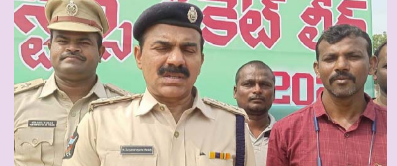
గూడూరు, జనవరి 13