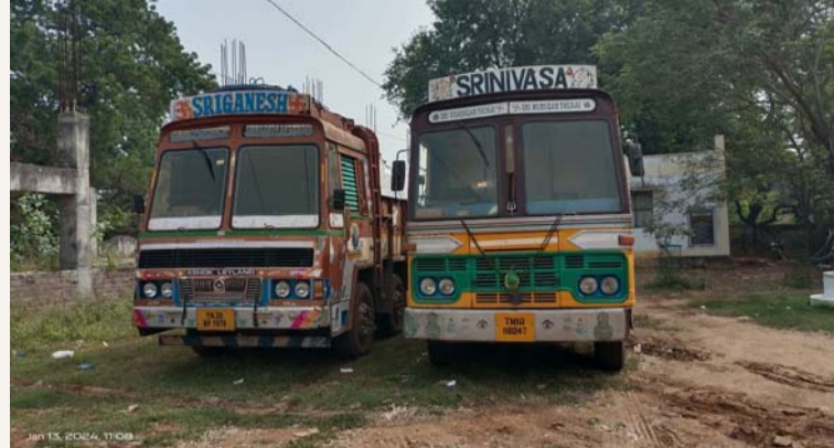
గూడూరు రూరల్, జనవరి 13 (శ్రీచక్ర) :

అక్రమ మైనింగ్ పై కొందా రుణిపిస్తున్న మైనింగ్ అధికారులు అక్రమ మైనింగ్ వ్యాపారులూ ఇంక మీ ఆటలు సాగవు అంటున్న మైనింగ్ అధికారులు ఇంకమీదట సైదాపురం గూడూరు మండలాల్లో అక్రమ మైనింగ్ చేయాలంటే భయం పుట్టేలా చేయబోతున్న మైనింగ్ అధికారులు ఇప్పటికైనా మైనింగ్ అధికారులు స్పందించినందుకు సైదాపురం, గూడూరు మండలాల ప్రజలు ఆనందం వ్యక్తం చేస్తున్నారు. మైనింగ్ అధికారులు లాగ్, రెవిన్యూ, పోలీస్ అధికారులు కూడా అక్రమ మైనింగ్ పై దాడులు చేస్తే, అక్రమ మైనింగ్ చేసే వ్యాపారులు బయపడుతారని చెబుతున్న ప్రజలు ఈరోజు తెల్లవారుజామున ఎటువంటి అనుమతులు లేకుండా ఎటువంటి పత్రములు కూడా లేకుండా తెల్ల రాయిని తరలిస్తున్న తమిళనాడుకు చెందిన మూడు లారీలను స్వాధీనం చేసుకున్న మైనింగ్ అధికారులు.