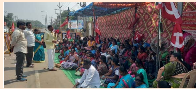
కడప సిటీ, జనవరి 13 (శ్రీచక్ర) :