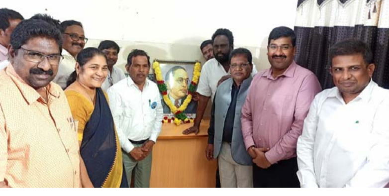
భీమవరం, జనవరి13(శ్రీచక్ర) :