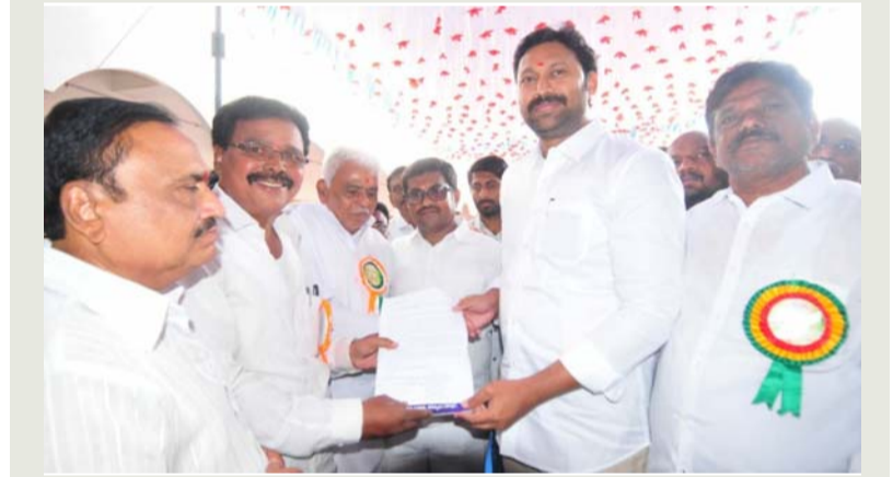
ప్రాద్దుటూరు, జనవరి 13 (శ్రీచక్ర) :