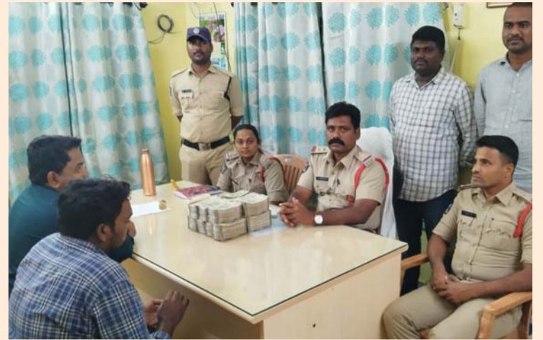
ప్రొద్దుటూరు, జనవరి 13 (శ్రీచక్ర) :