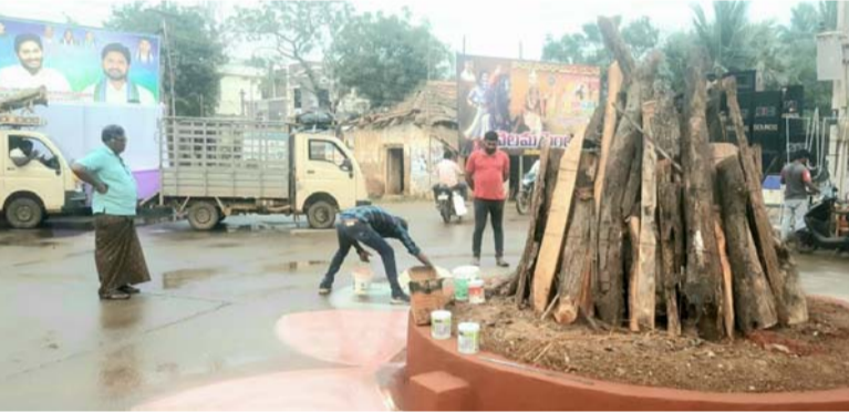
దెందులూరు, జనవరి 13 (శ్రీచక్ర) :