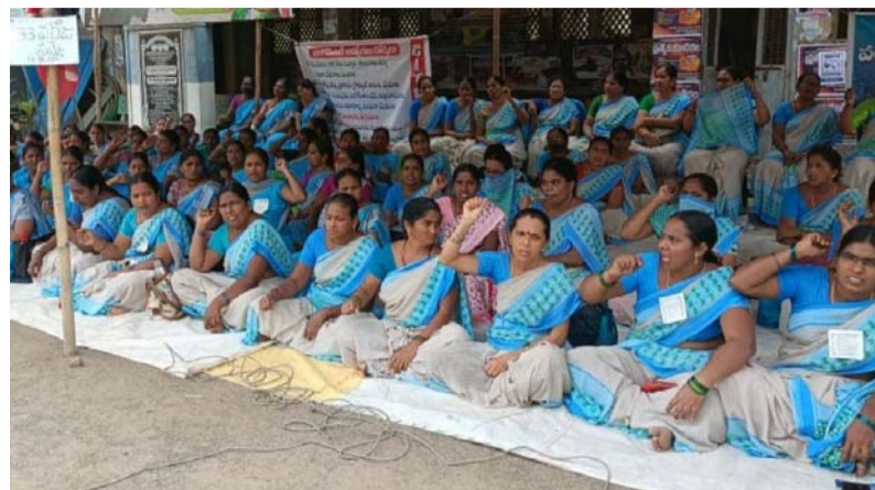
వీరవాసరం, జనవరి13(శ్రీచక్ర) :