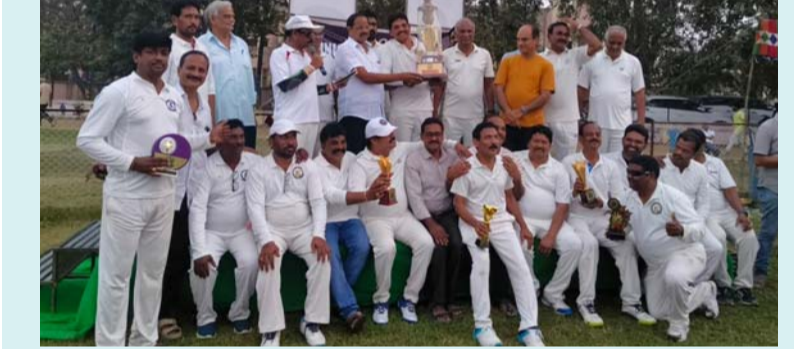
భీమవరం, జనవరి13(శ్రీచక్ర) :