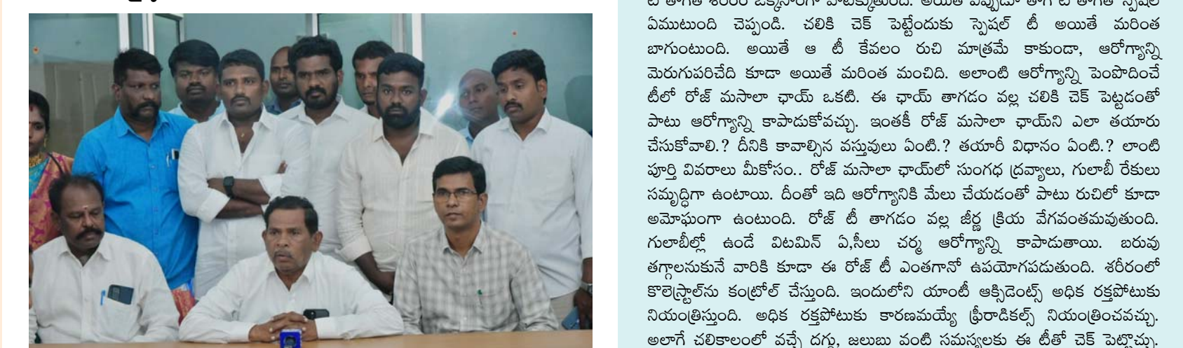
తిరుపతి, జనవరి 13 (శ్రీచక్ర) :