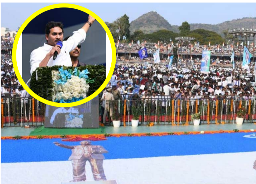
నచ్చడం లేదు. అంబేద్కర్ భావజాలం పత్తందారులకు నచ్చదని సీఎం జగన్ దుయ్యబట్టారు.

పనివాళ్లుగా ఉండిపోవాలా? అంటూ ప్రశ్నించారు. పేదలు చదివే ప్రభుత్వ స్కూళ్లను పట్టించుకోకపోవడం అంటరానితనమే. పేదలకు ఇళ్లు ఇస్తుంటే అడ్డుకోవడం కూడా అంటరానితనమే. పేదపిల్లలకు ట్యాబ్లెట్లు ఇస్తుంటే కుల్చురాలిత వార్తలు రాయడం అంటరానితనమే. దళితులకు చంద్రబాబు సింటా భూమి కూడా ఇచ్చింది లేదు. బీసీ, ఎస్సీ, ఎస్టీలపై చంద్రబాబుకు ఏ కోశానా ప్రేమలేదు. మన ప్రభుత్వం బదుల రూపురేఖలు మారిస్తే పత్తందారులకు