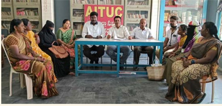
కడప సీటీ, జనవరి 20 (శ్రీచక్ర) :

● 11 నెలలుగా రాగిసరి, గుడ్లు ఉడకబెట్టినందుకు చెల్లిస్తామన్న అదనపు వేతనం తక్షణం చెల్లించాలి : ఏబిఐఎస్