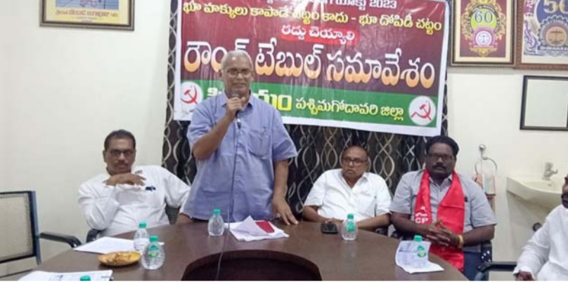
భీమవరం, జనవరి 20 (శ్రీచక్ర) :

● భీమవరంలో ప్రజాతంత్రవాదులతో రౌండ్ టేబుల్ సమావేశం