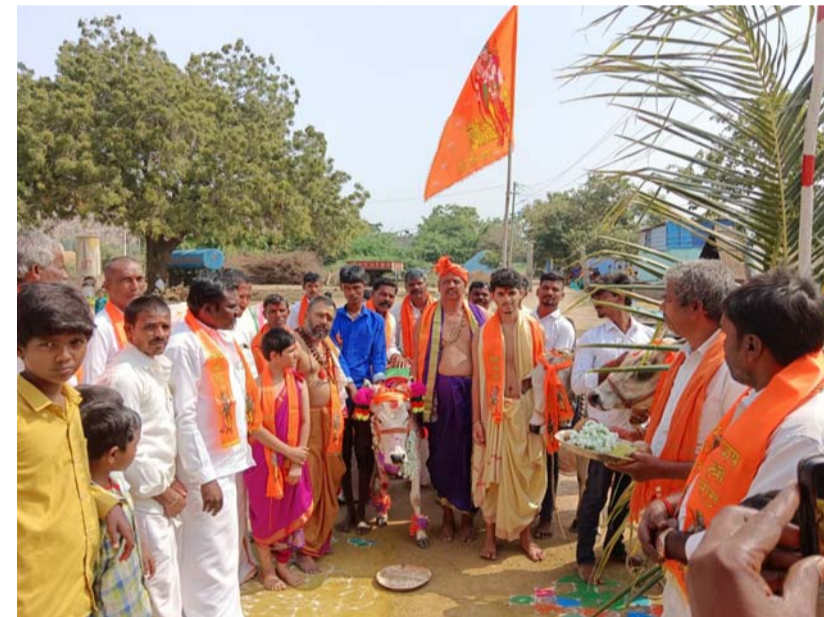
పెద్దకడబూరు, జనవరి 20 (శ్రీచక్ర):