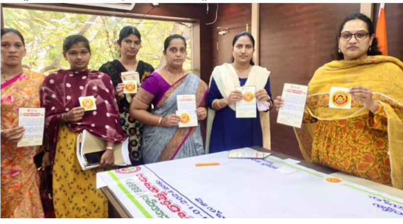
కర్నూలు, జనవరి, 20(శ్రీచక్ర):