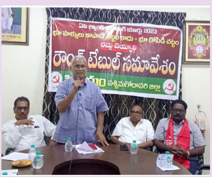
భీమవరం, జనవరి 20 (శ్రీచక్ర) :