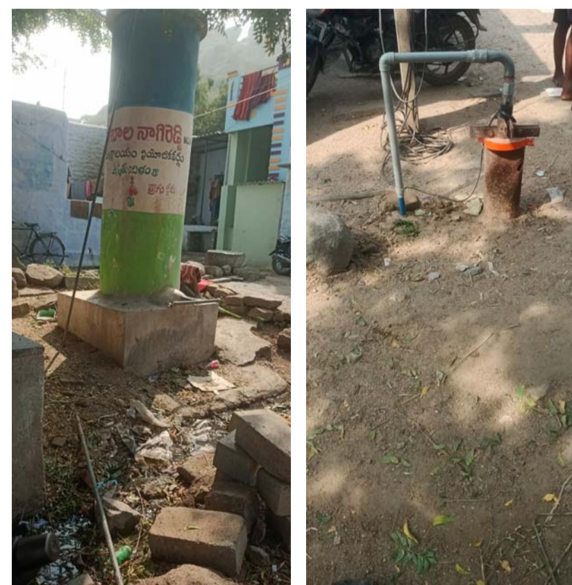
పెద్దకడబూరు, జనవరి 20 (శ్రీచక్ర):