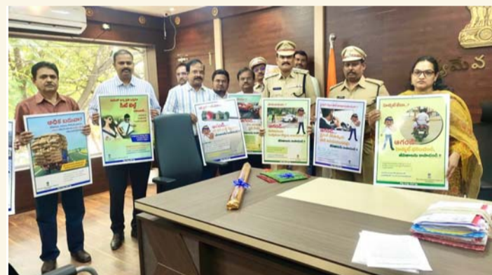
కర్నూలు, జనవరి, 20(శ్రీచక్ర):