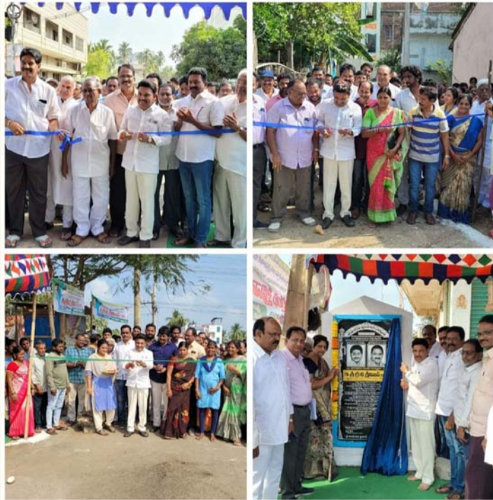
భీమవరం, జనవరి 20 (శ్రీచక్ర) :

● రాష్ట్ర ప్రభుత్వ వివ్, ఎమ్మెల్యే గ్రంధి శ్రీనివాస్