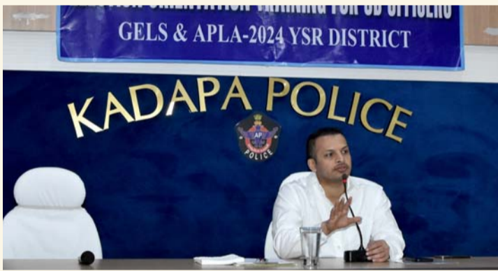
కడప, జనవరి 20 (శ్రీచక్ర) :