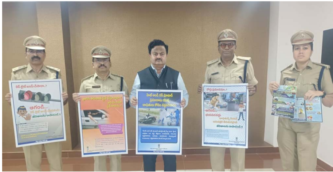
వారి ప్రాణానికే కాదు ఇతరుల ప్రాణాలకు కూడా ప్రమాదకరం అని, ద్విచక్ర వాహనాలు నడిపేవారు హెల్మెట్ తప్పనిసరిగా వాడాలని అది వారి ప్రాణాలకు రక్షణగా ఉంటుందని తెలిపారు. ట్రాఫిక్ నియమాలను ప్రతి ఒక్కరు పాటించాలని, రహదారి ప్రమాదంలో గాయపడిన వారిని ఆసుపత్రికి సకాలంలో తరలించి వారి ప్రాణాలను కాపాడాలని, ఇందులో భయపడకుండా పని లేదని తెలిపారు.