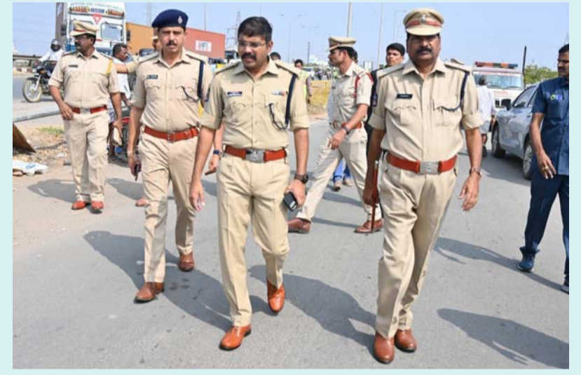
కర్నూలు, జనవరి 20(శ్రీచక్ర):