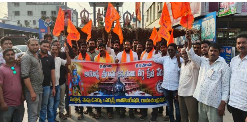
● యూనిట్ గౌరవ అధ్యక్షులు కంచుమర్రి