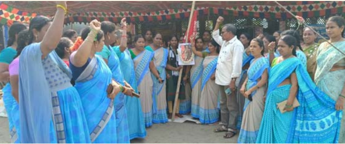
వీరవాసరం, జనవరి 21(శ్రీచక్ర) :