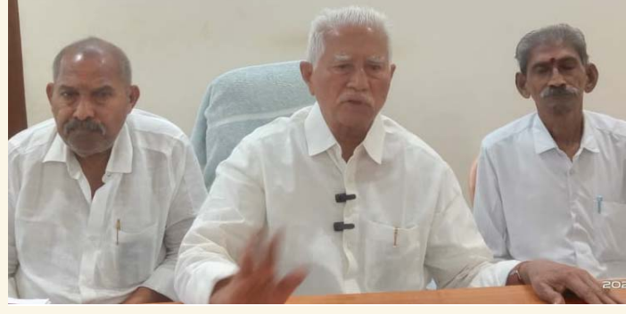
ప్రొద్దుటూరు, జనవరి 21(శ్రీచక్ర) :