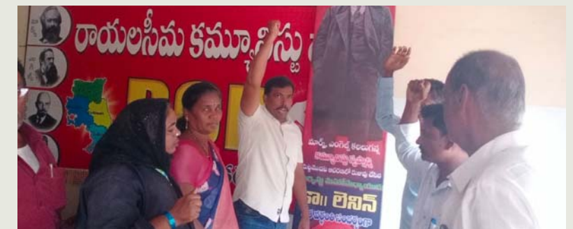
కడప సి.టి, జనవరి 21(శ్రీచక్ర) :