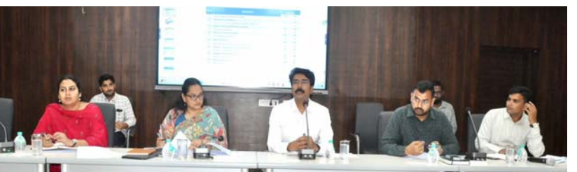
కర్నూలు, జనవరి 21(శ్రీచక్ర):