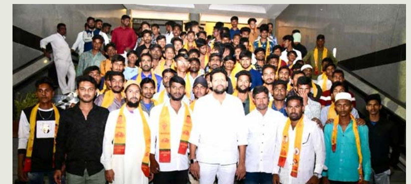
కర్నూలు, జనవరి 21(శ్రీచక్ర) :