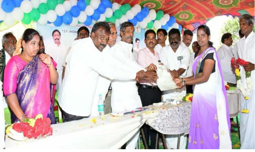
● ఎమ్మెల్యే కాటసాని రాంభూపాల్ రెడ్డి