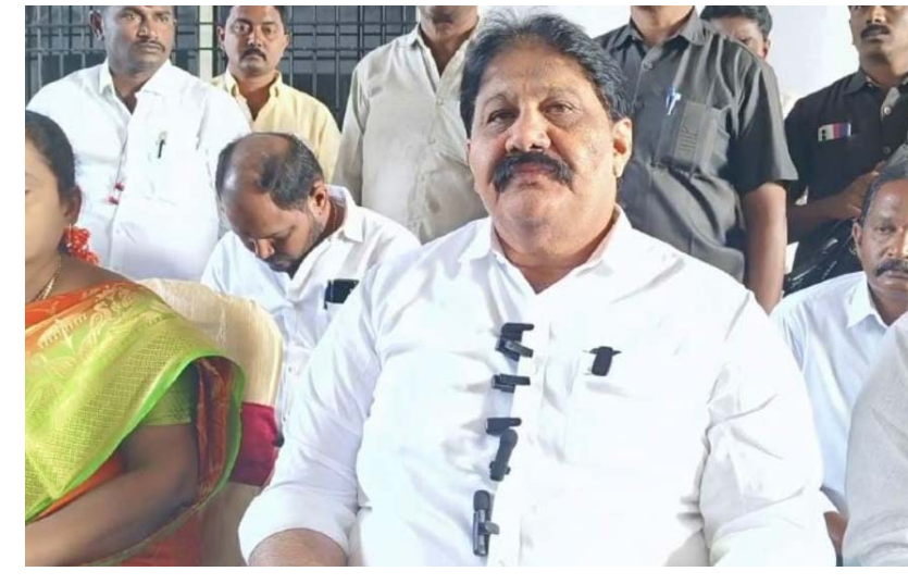
కడప సీటీ, జనవరి 21(శ్రీచక్ర) :