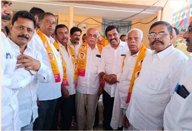
పీలేరు, 21 జనవరి (శ్రీచక్ర) :