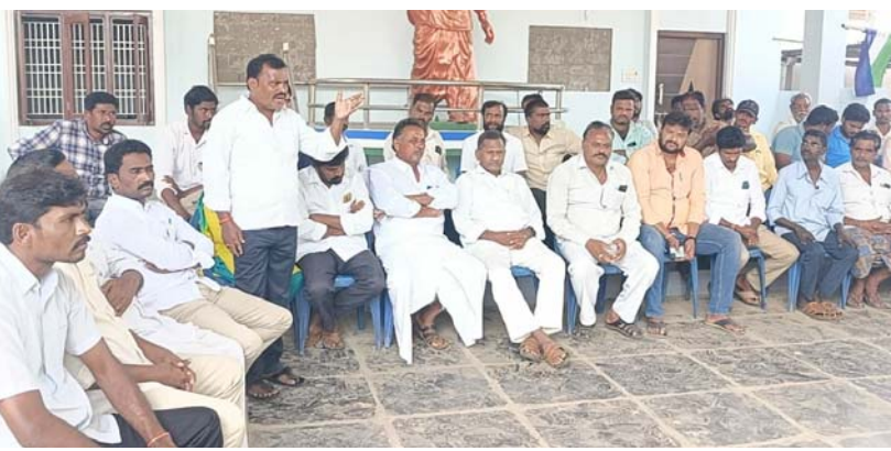
కనిగిరి, జనవరి21(శ్రీచక్ర) :

• పీసీ పల్లి వైఎస్ఆర్ పార్టీ నాయకులు ప్రజాప్రతినిధులు