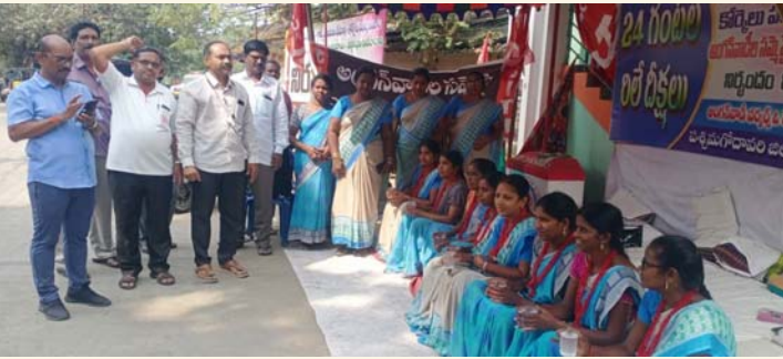
భీమవరం, జనవరి 21(శ్రీచక్ర) :