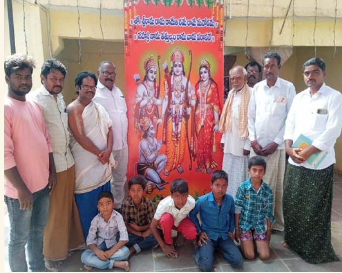
పెద్దకడబూరు, జనవరి 21 (శ్రీచక్ర) :