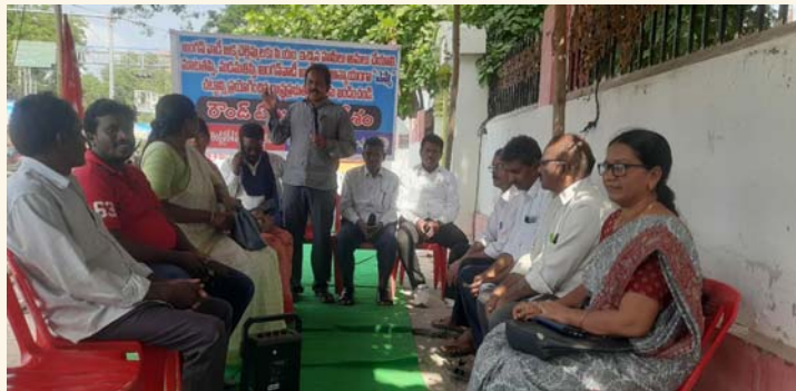
ఓంగోలు, జనవరి21(శ్రీచక్ర) :

• కేపీపీఎస్, వ్యవసాయ కార్మిక సంఘం రౌండ్ టేబుల్ సమావేశంలో వక్రల విలుపు