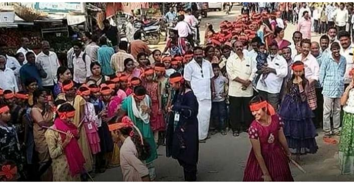
కలసపాడు, జనవరి 22 (శ్రీచక్ర) :

కడప జిల్లా కలసపాడు పట్టణంలో 300 మంది విద్యార్థులు చే కలసపాడు గ్రామ పురవీధుల గుండా రామనామ సంకీర్తనలు చేశారు. కుల మతాలకు ఆ తీతగా భారతీయ సాంప్రదాయ పద్ధతిలో రామ నామ స్మరణ చేసుకోంటూ కోలాట భజన లతో ప్రజలను ఆకర్షించే విధంగా కార్యక్రమాన్ని ఏర్పాటు చేశారు. మొదట గా సేయింట్ ఆంటోనీస్ పాఠశాల నుంచి వై యస్ ఆర్ సర్కిల్ మీదుగా రామమందిరం ను దర్శిస్తూ రామ నామ స్మరణ లతో పెద్ద ర్యాలీ నిర్వహించడం జరిగింది.