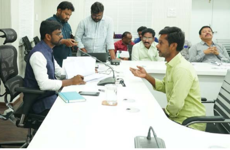
కడప, జనవరి 22 (శ్రీచక్ర) :

నగరపాలక పరిధిలోని అల్లీదారుల సమస్యలను ఎప్పటికప్పుడు పరిష్కరించే విధంగా చర్యలు తీసుకోవాలని నగరపాలక కమిషనర్ సాయి ప్రవీణ్ చంద్ అధికారులు ఆదేశించారు. ప్రజల యొక్క సమస్యలను పరిష్కరించు జగనన్నకు చెబుదాము కార్యక్రమము సోమవారము నగరపాలక సంస్థ వీడియో కాన్ఫరెన్స్ హాల్ నందు సంబంధిత శాఖ అధికారులు మరియు నగరపాలక సిబ్బందితో కలిసి నిర్వహించారు. ఈ సందర్భంగా ఆయన మాట్లాడుతూ ప్రజల నుండి వచ్చినటువంటి అల్లీలను కూడా శాఖాధిపతులు వాటి కేటాయించిన సమయంలో పూర్తిచేసేలా చర్యలు తీసుకోవాలని పరిష్కరణ సందు న్యాయ పద్ధతిలో పరిష్కార జరిగే విధంగా చర్యలు తీసుకోవాల్సిందిగా అధికారులకు ఆదేశించారు. అనంతరం మున్సిపల్ హెల్త్ ఆఫీసర్ సానిటేషన్ విభాగ అధికారులతో మాట్లాడుతూ కడప నగరం నందు 100% ఇంటింటి చెత్త సేకరణ జరగల చర్యలు తీసుకోవాలని ఎక్కడ కూడా చెత్త పాయింట్లు నందు చెత్త నిలువ ఉండకుండా శుభ్రం చేసే తగిన చర్యలు తీసుకోవాల్సిందిగా అధికారులకు ఆదేశించారు. నగరం నందు జరుగుతున్నటువంటి అభివృద్ధి పనులలో భాగంగా నాణ్యత లోపాలు లేకుండా పనులను వాటి కేటాయించిన సమయానికి పూర్తి జరిగేలా చర్యలు తీసుకోవాల్సిందిగా ఇంజనీరింగ్ విభాగ అధికారులకు సూచించారు. ఎక్కడ కూడా అనాధ నిర్మాణాలు లేకుండా తగిన చర్యలు తీసుకుంటూ అనుమతి లేని ఫ్లాట్లను ఎప్పటికప్పుడు తీసివేసేలా తగిన చర్యలు తీసుకోవాల్సిందిగా టౌన్ ప్లాన్ విభాగ అధికారులకు ఆదేశించారు.