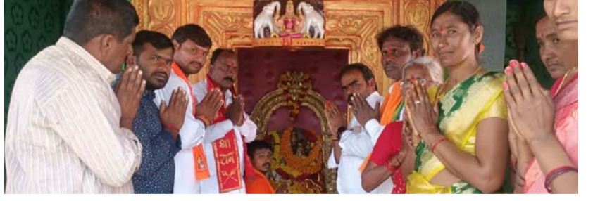
ఒంగోలు టౌన్, జనవరి 22 (శ్రీచక్ర) :