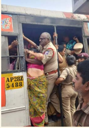
కడప సీటీ, జనవరి 22 (శ్రీచక్ర) :