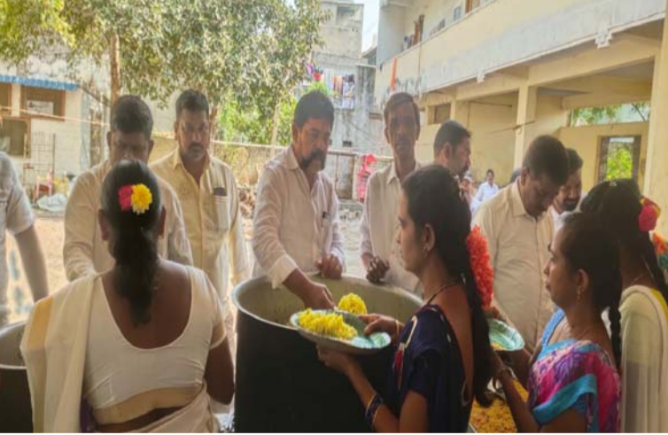
ప్రాద్దుటూరు, జనవరి 22 (శ్రీచక్ర) :