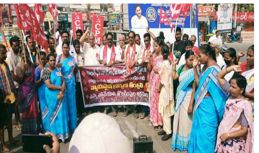
భీమవరం, జనవరి 22 (శ్రీచక్ర) :