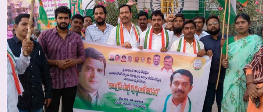
కడప సిడీ, జనవరి 22