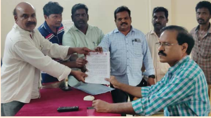
● రామచంద్రపురం తహశీల్దార్ కి వినతి పత్రం