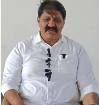
ప్రాద్దుటూరు, జనవరి 22 (శ్రీచక్ర) :