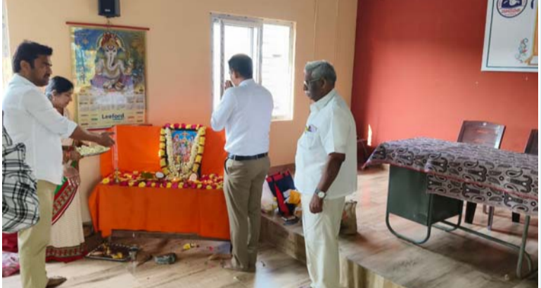
ప్రాద్దుటూరు, జనవరి 22