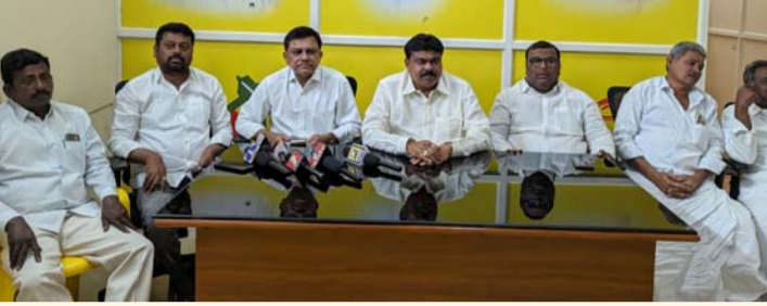
ప్రాధుటూరు, జనవరి 22