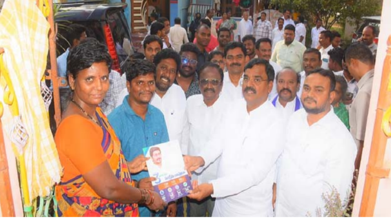
కడప అర్బన్, జనవరి 23 (శ్రీచక్ర) :

● గడప గడపకు మన ప్రభుత్వంలో రాష్ట్ర ఉపముఖ్యమంత్రి ఎన్.బి.అంజాద్ బాషా