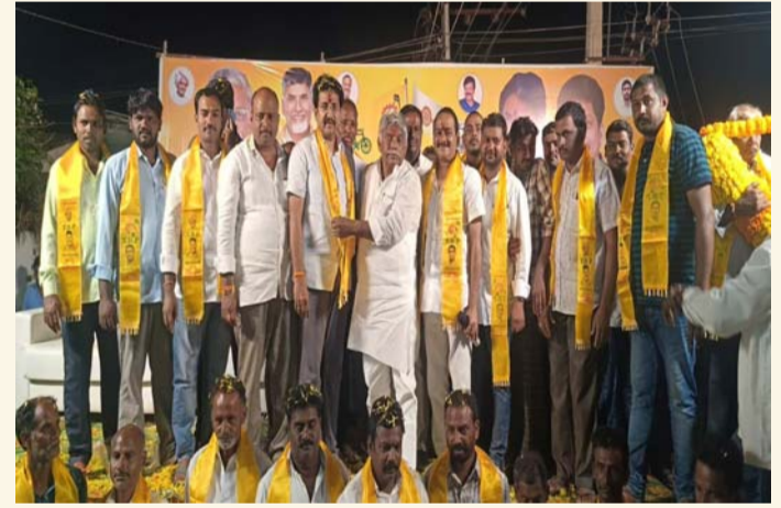
కిర్లంపూడి, జనవరి 23 (శ్రీచక్ర) :