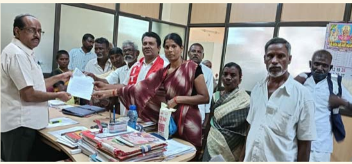
కడప సీటీ, జనవరి 23 (శ్రీచక్ర) :