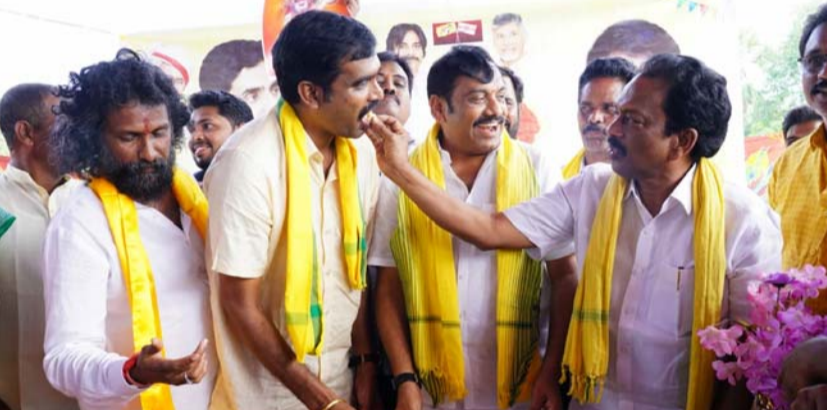
కాజులూరు, జనవరి 23 (శ్రీచక్ర) :