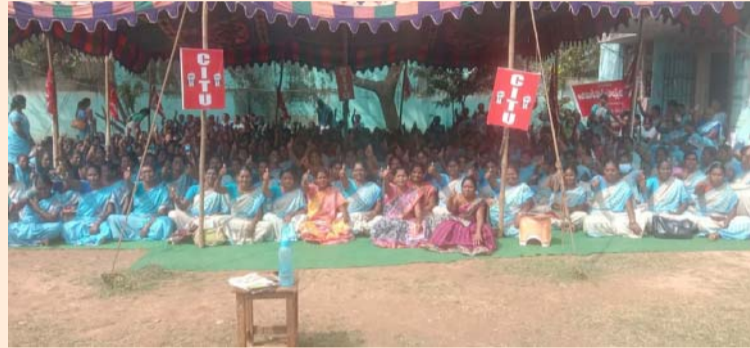
కోట, జనవరి 23 (శ్రీచక్ర) :

అంగన్వాడీల పలు సమస్యలపై ప్రభుత్వం స్పందించినందుకు స్థానిక కోట అంగన్వాడీ ప్రాజెక్ట్ పరిధిలోని అంగన్వాడీలు సంతోషం వ్యక్తం చేశారు. ఈ సందర్భంగా కోట మండలంలోని ఐసీడీఎస్ కోట ప్రాజెక్ట్ నందు కోట,వాకాడు,చిట్టమూరు మండలాల అంగన్వాడీ ఉద్యోగస్థులు మాట్లాడుతూ తమ డిమాండ్ లపై రాష్ట్ర ప్రభుత్వం స్పందించడం సంతోషంగా ఉందన్నారు. ఈ కార్యక్రమంలో కోట,వాకాడు, చిట్టమూరు మండలాల అంగన్వాడీ కార్యకర్తలు, హెల్పర్లు పాల్గొన్నారు.