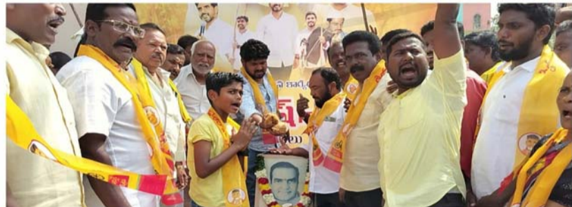
ఇవ్వకపోవడం వంటి కారణాలతో పార్టీలో విభేదాలకి దారి తీయడంతో వీటిని అరికట్టడానికి టీడీపీ అధిష్టానం చర్యలు తీసుకోవాలని పార్టీ కార్యకర్తలు నాయకులు కోరుతున్నారు.