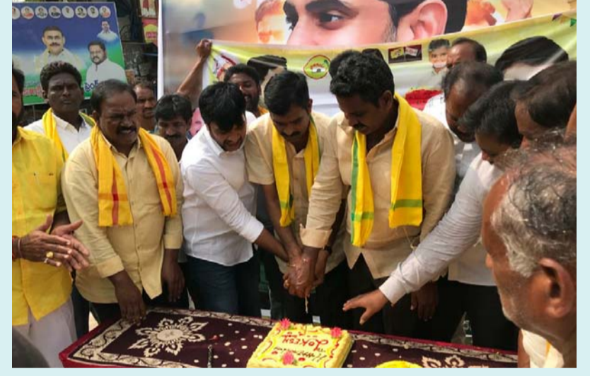
రామచంద్రపురం, జనవరి 23 (శ్రీచక్ర) :