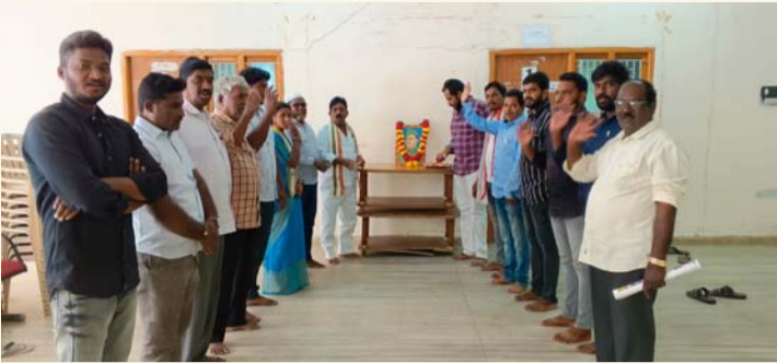
కడప సీటీ, జనవరి 23