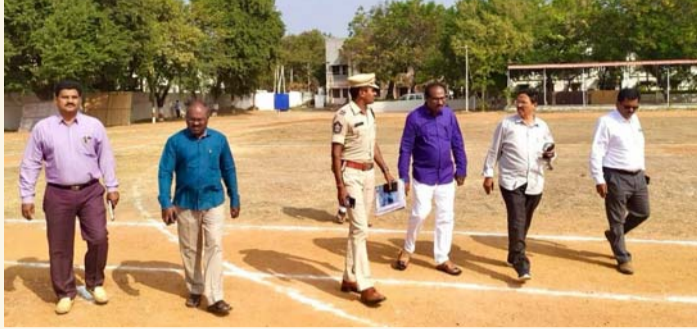
కర్నూలు, జనవరి 23 (శ్రీచక్ర) :