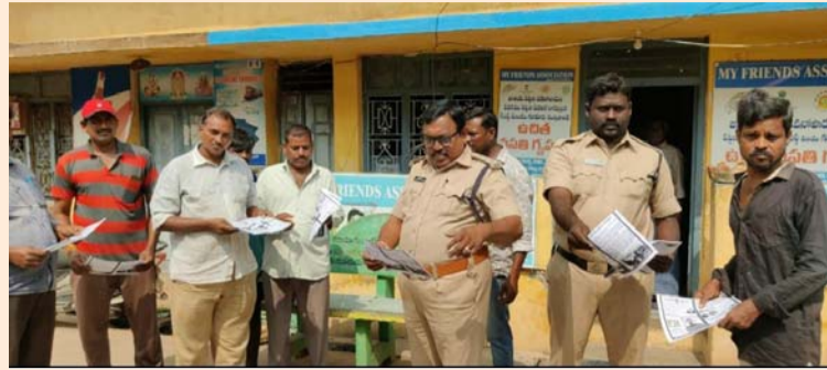
గూడూరు, జనవరి 23