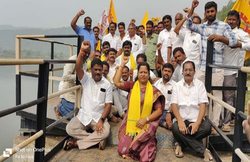
వరుపుల సత్య ప్రభ