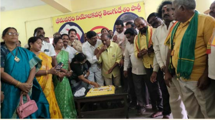
భీమవరం, జనవరి 23 (శ్రీచక్ర) :