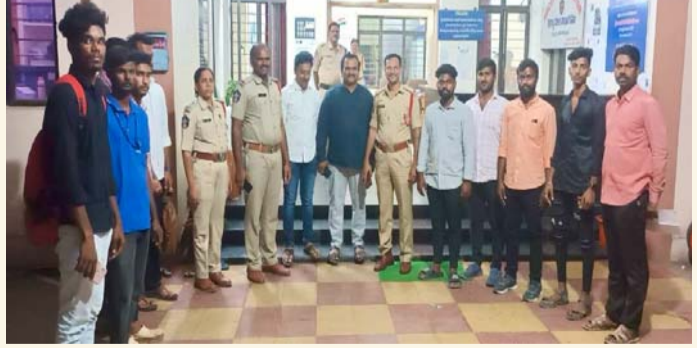
కర్నూలు, జనవరి 23(శ్రీచక్ర) :