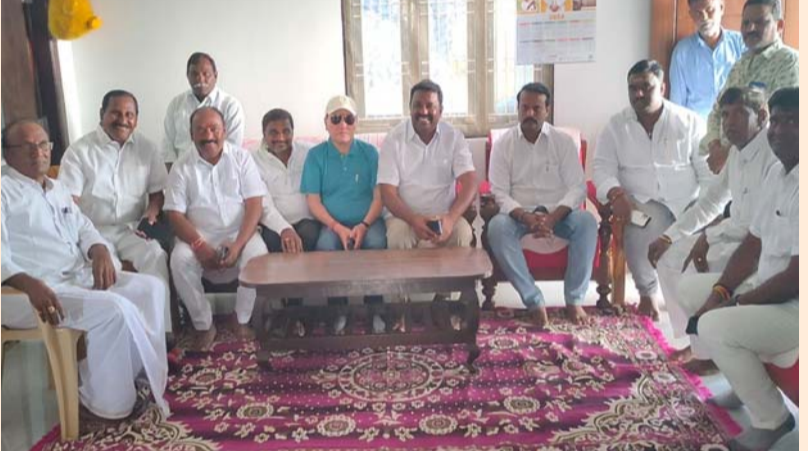
వింజమూరు, జనవరి 24 (శ్రీచక్ర) :