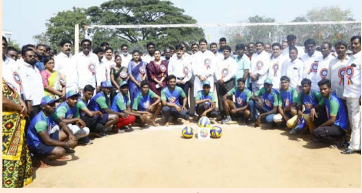
ఆత్మకూరు నియోజకవర్గం, జనవరి 24 (శ్రీచక్ర) :