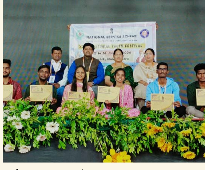
భీమవరం, జనవరి 24 (శ్రీచక్ర) :