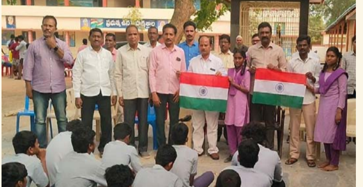
కనిగిరి, జనవరి 25 (శ్రీచక్ర) :