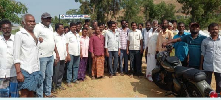
కడప సిఠి, జనవరి 25 (శ్రీచక్ర) :