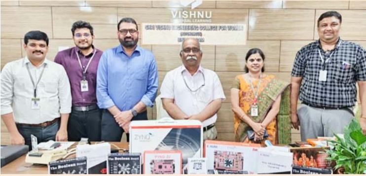
భీమవరం, జనవరి 25 (శ్రీచక్ర) :

• రూపొందించిన శ్రీవిష్ణు ఇంజనీరింగ్ కాలేజీ ఫర్ ఉమెన్ యొక్క ఎలక్ట్రానిక్స్ అండ్ కమ్యూనికేషన్ ఇంజనీరింగ్ విభాగం