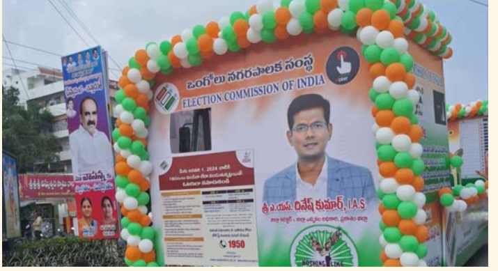
ఓంగోలు, జనవరి 25