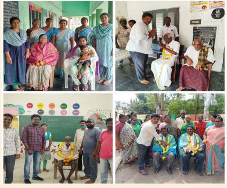
వీరవాసరం, జనవరి 25 (శ్రీచక్ర) :