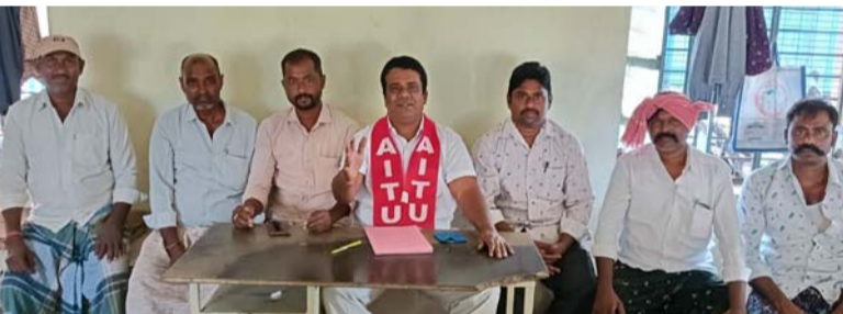
కడప సిఠి, జనవరి 25 (శ్రీచక్ర) :