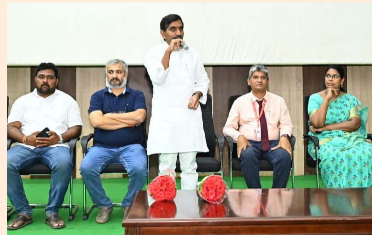
దెందులూరు, జనవరి 25 (శ్రీచక్ర) :