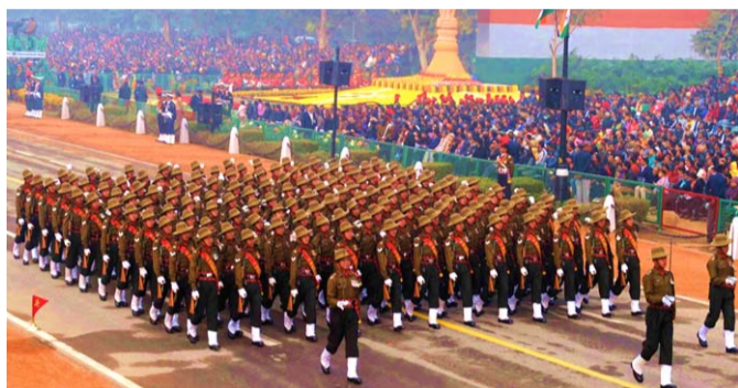
న్యూఢిల్లీ, జనవరి 25

శుక్రవారం 75వ గణతంత్ర వేడుకలకు సర్వం సిద్ధమైంది. న్యూఢిల్లీలోని కర్తవ్య పథ్ లో రిపబ్లిక్ డే పరేడ్ జరగనుంది. పరేడ్ లో సాయుధ బలగాలకు చెందిన 3 శాఖల బృందాలు చేసే కవాతు, ఆయుధాలు, సైనిక పరికరాల ప్రదర్శనలు, మోటార్ సైకిల్ విన్యాసాలు నిర్వహించనున్నారు. ఉదయం 10:30 గంటలకు విజయ్ చౌక్ నుంచి కర్తవ్య పథ్ వరకూ పరేడ్ సాగనుంది. ఈ ఏడాది గణతంత్ర దినోత్సవ వేడుకలకు ముఖ్య అతిథిగా ఫ్రాన్స్ అధ్యక్షుడు ఇమ్మాన్యుయేల్ మాక్రాన్ ను ఆహ్వానించారు. 72 వేల మంది పరేడ్ తిలకించేలా అధికారులు ఏర్పాటు చేశారు. 42 వేల సీట్లను సాధారణ పౌరులకు కేటాయించారు. ఈ ఏడాది 'పీజీఐ భారత్', 'భారత్ లోక్ తంత్రకి మాతృక' థీమ్ గా ప్రకటించారు. ఇది ప్రజాస్వామ్యాన్ని పెంపొందించే దిశగా భారత దేశ పాత్రను నొక్కి చెబుతోంది. మరోవైపు, వేడుకల కోసం భారీ బందోబస్తు ఏర్పాటు చేశారు. ఢిల్లీలోని 11 జోన్లలో 11 మంది డీసీపీలు, 8 వేల మంది పోలీసులు పహారా కాస్తున్నారు. ఏటా గణతంత్ర వేడుకలకు భారీగా భద్రతా ఏర్పాటు చేయనున్నారు. రైల్వే స్టేషన్లు, ఎయిర్పోర్టులు కూడళ్లలో తనిఖీలు ముమ్మరం చేశారు.