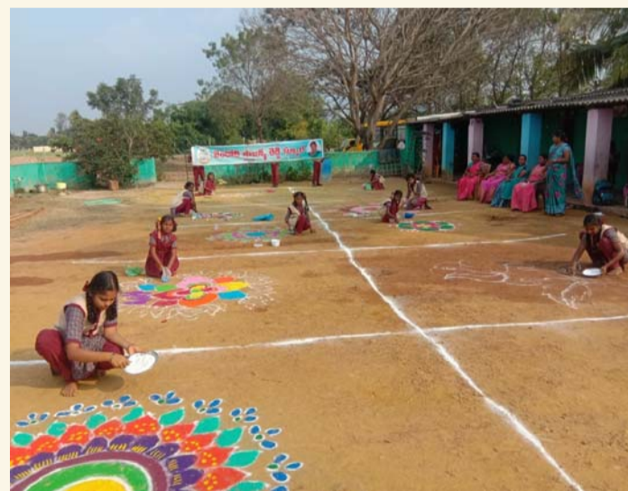
బాలాయపల్లి, జనవరి 25 (శ్రీచక్ర) :