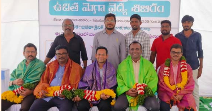
● నెల్లూరు కిమ్స్ ఆసుపత్రి నుంచి పలు ముఖ్య డాక్టర్లు రావడంతో పేషెంట్లతో కిక్కిరిసిన జనతా క్లినిక్ హాస్పిటల్