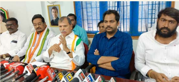
కడప సీటీ, జనవరి 27(శ్రీచక్ర) :