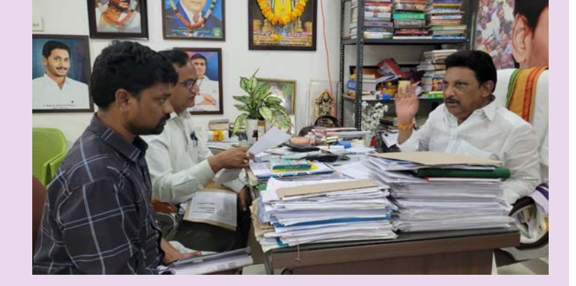
భీమవరం, జనవరి 27 (శ్రీచక్ర) :