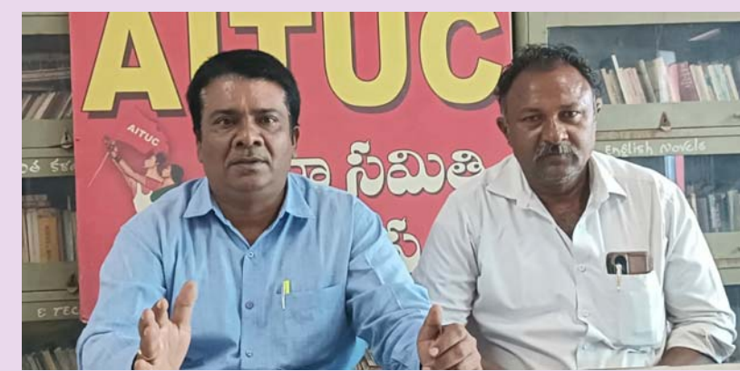
కడప సీటీ, జనవరి 27(శ్రీచక్ర) :