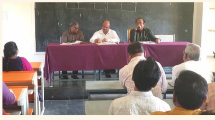
భీమవరం, జనవరి 29 (శ్రీచక్ర) :