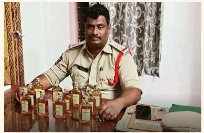
ఉదయగిరి, జనవరి 29 (శ్రీచక్ర) :