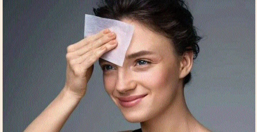
పొందవచ్చు. అరటిపండు కూడా ముఖం మీద జిడ్డును తొలగించటానికి సహాయపడుతుంది. ఒక బౌల్ లో అరటిపండు గుజ్జు వేసి దానిలో రెండు స్పూన్స్ ఓట్స్, ఒక స్పూన్ పాలు వేసి బాగా కలిపి ముఖానికి రాసి పది నిమిషాల తర్వాత గోరువెచ్చని నీటితో శుభ్రం చేసుకోవాలి.

కొంత మంది చర్మం చాలా జిడ్డుగా ఉంటుంది. ఎన్ని సార్లు ముఖం కడిగినా, ఎన్ని జాగ్రత్తలు తీసుకున్నా సరే ముఖం జిడ్డు గానే ఉంటుంది. ఈ జిడ్డు కారణంగా మొటిమలు, ఖాక్ హెడ్స్, వైట్ హెడ్స్ వంటి సమస్యలు చాలా ఇబ్బందిని కలిగిస్తాయి. జిడ్డు తగ్గితే ఇటువంటి సమస్యలు కూడా ఉండవు. ఇప్పుడు చెప్పే చిట్టాను ఫాలో అయితే ముఖం మీద జిడ్డు తగ్గి చర్మం చర్మం తాజాగా, కాంతివంతంగా ఉంటుంది. వంటింటిలో ఉండే కొన్ని వస్తువులను ఉపయోగించి చాలా సులభంగా జిడ్డును తొలగించుకోవచ్చు. ముఖం మీద జిడ్డును తొలగించటానికి పెరుగు చాలా సహాయపడుతుంది.