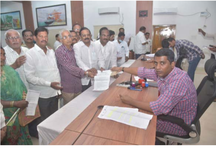
కోట, జనవరి 29 (శ్రీచక్ర) :

నెల్లూరు జిల్లా కలెక్టర్ కార్యాలయం వద్ద విశ్రాంత ఉద్యోగులు ధర్నా చేపట్టడం జరిగింది. ఈ సందర్భంగా మంగళవారం నెల్లూరు జిల్లా కలెక్టర్ కార్యాలయం వద్ద రాష్ట్ర ప్రభుత్వ కమిషనర్ అనోసియేషన్, నెల్లూరు జిల్లా శాఖ అధ్యక్షులతో ధర్నా కార్యక్రమాన్ని నిర్వహించడం జరిగింది. ఈ సందర్భంగా జిల్లా కలెక్టర్ కి పెన్ననర్ల సమస్యలను పరిష్కరించాలని రాష్ట్ర ప్రభుత్వ కమిషనర్ అనోసియేషన్ సంఘం నాయకుల చేతుల మీదగా వినతి పత్రాన్ని అందజేశారు. ఈ కార్యక్రమానికి సుమారుగా 250 మంది పెన్ననర్లు పాల్గొనడం జరిగింది. అనంతరం ఆయా నాయకులు మాట్లాడుతూ పెండింగ్ లో ఉన్న