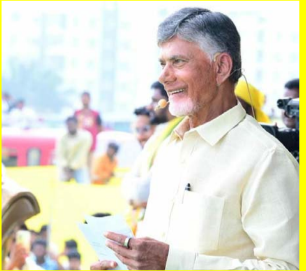
చంద్రబాబు పట్టు తప్పి కింద పడబోయారు.