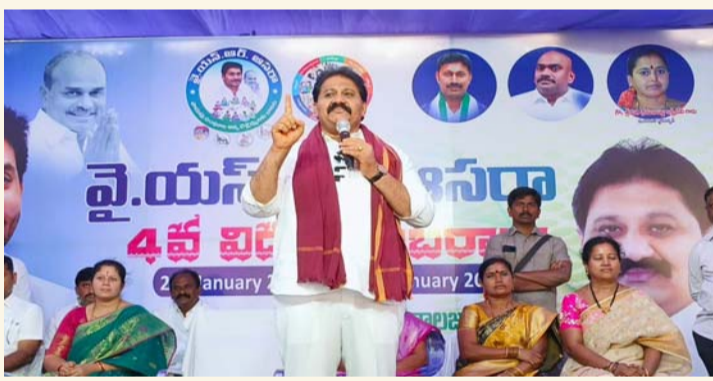
ప్రొద్దుటూరు, జనవరి 30 (శ్రీచక్ర) :