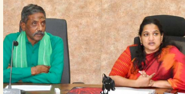
కర్నూలు, జనవరి 30(శ్రీచక్ర) :