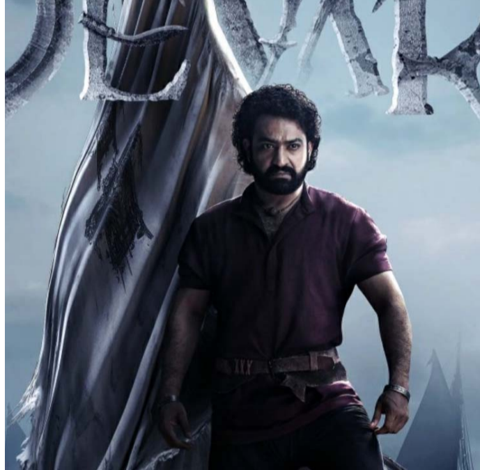
పలు చిత్రాల విషయంలో ఇవే సందేహాలు