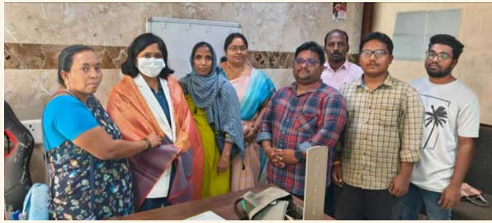
కడప సీటీ, జనవరి 30 (శ్రీచక్ర) :