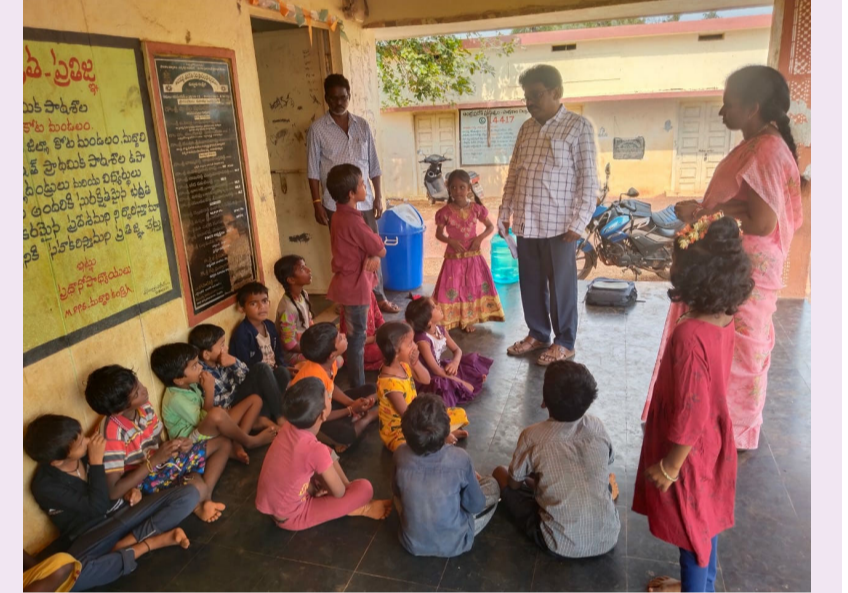
కోట, ఫిబ్రవరి 2 (శ్రీచక్ర) :