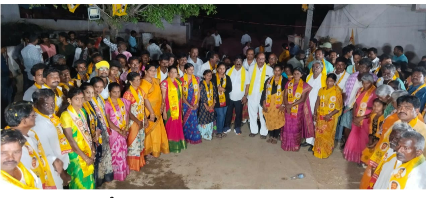
• పదివేల మెజారిటీ దిశగా ముమ్మర ప్రయత్నాలు చేస్తున్న టిడిపి శ్రేణులు