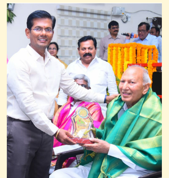
ఓంగోలు టౌన్, ఫిబ్రవరి 2 (శ్రీచక్ర) :