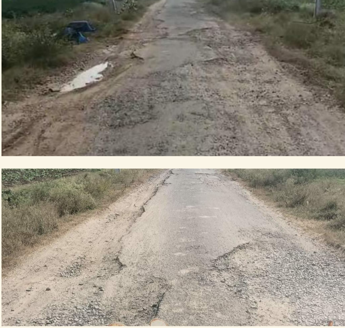
ఉదయగిరి/కొండాపురం, ఫిబ్రవరి 2 (శ్రీచక్ర) :

కొండాపురం మండలంలోని ఆరేంద్రబి రోడ్ల పరిస్థితి చాలా దారుణంగా ఉంది. గుంతల మయమై కంకర రాళ్లతో ఘోరంగా ఉన్నాయి. ఇలా ఉండటం వల్ల వాహనదారులు చాలా ఇబ్బందులకు గురవుతున్నారు. అంతేకాకుండా రోడ్డు మార్జిన్ దిగాలంటే మోటార్ లోతు గుంతలు తో సతమతమవుతున్నారు. ఇంత దారుణంగా ఉన్న అధికారులకు దయ లేదు. అంతేకాకుండా కొద్దిగా గొప్ప ఉన్న రోడ్లు కూడా రైతులు నీటి పారుదల కోసం అడ్డంగా తవ్వేస్తున్నారు. వీరికి అవగాహన కల్పించి రోడ్లు తవ్వకుండా అవగాహన కల్పించడంలో కూడా విఫలమయ్యారు.. అంతేకాకుండా అంతటి దారుణమైన పరిస్థితుల్లో రోడ్లు ఉంటే అధికారులు కాంట్రాక్టర్లకు ముక్త్యే ప్రజాధనాన్ని దుర్వినియోగం చేస్తున్నారు. కావన జిల్లాస్థాయి అధికారులు స్పందించి రైతులకు అవగాహన కలిగిస్తూ గుంతల మయమైన రోడ్లన్నీ వెంటనే మరమ్మత్తులు చేయించాలని కోరుతున్నాము.