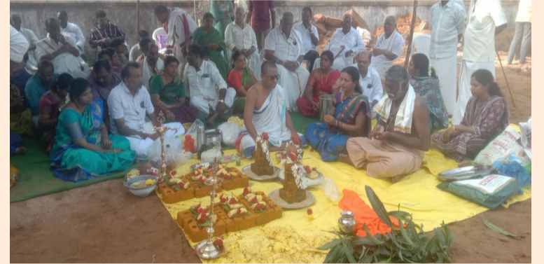
గూడూరు, ఫిబ్రవరి 2 (శ్రీచక్ర) :