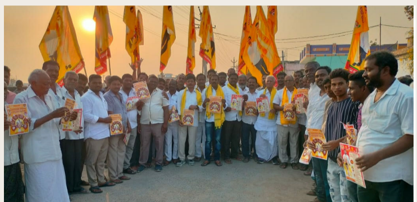
ప్రొద్దుటూరు, ఫిబ్రవరి 2 (శ్రీచక్ర) :