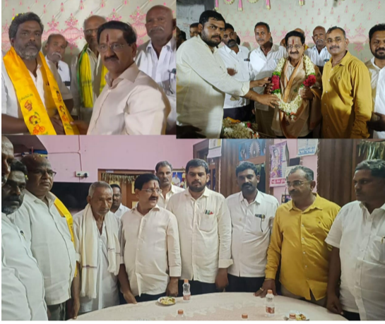
ఉదయగిరి/కొండాపురం, ఫిబ్రవరి 2 (శ్రీచక్ర) :