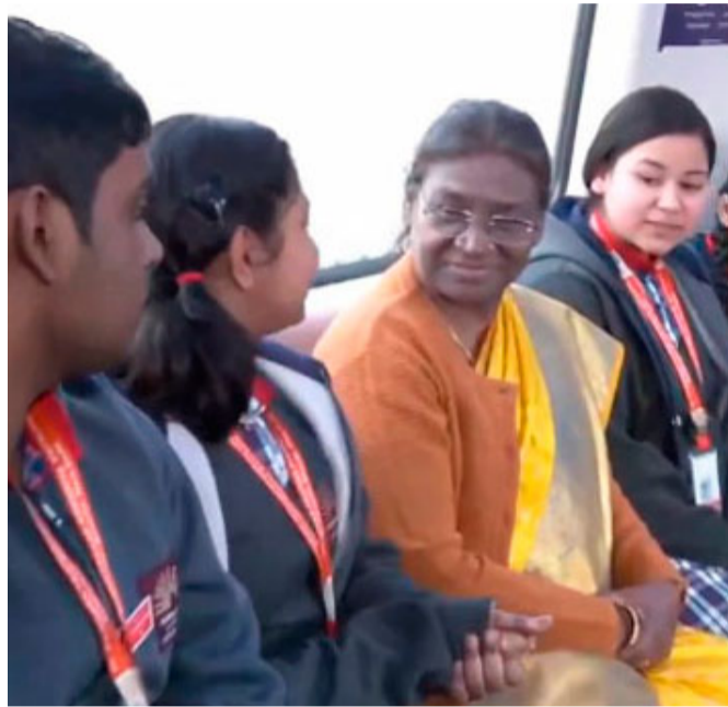
న్యూఢిల్లీ, ఫిబ్రవరి 7 (ఆర్ఎన్ఎ) :

విద్యార్థులతో ముచ్చటించి ధైర్యం చెప్పిన రాష్ట్రపతి