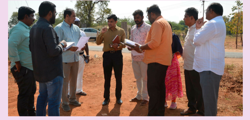
పెద్దకడబూరు, ఫిబ్రవరి 7