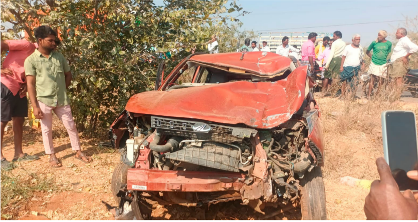
పెద్దకడబూరు, ఫిబ్రవరి 7 (శ్రీచక్ర):