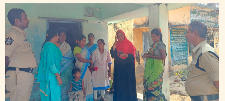
బాలాయపల్లి, ఫిబ్రవరి9(శ్రీచక్ర) :