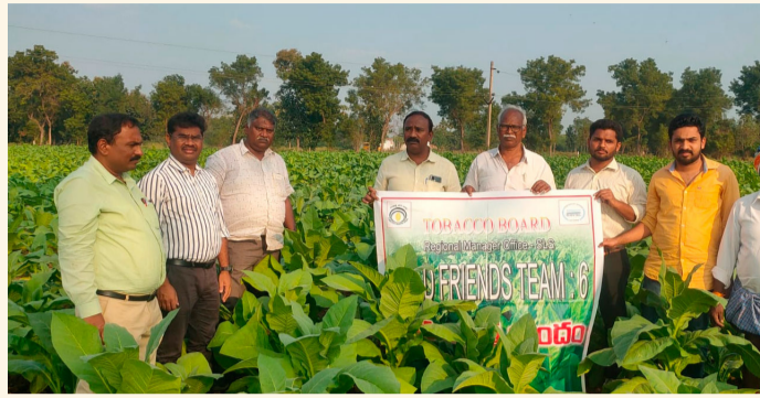
మరిపాడు, జనవరి10 (శ్రీచక్ర) :