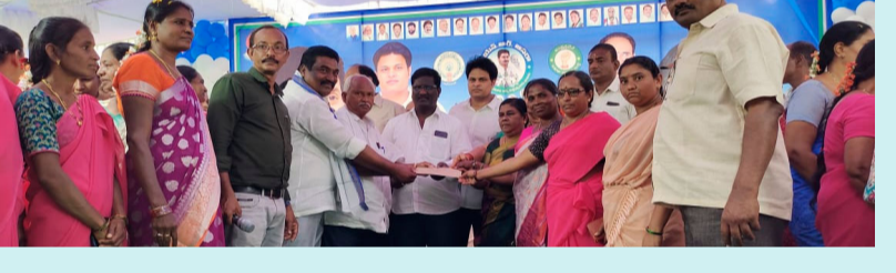
చీరాల, ఫిబ్రవరి 9 (శ్రీచక్ర) :