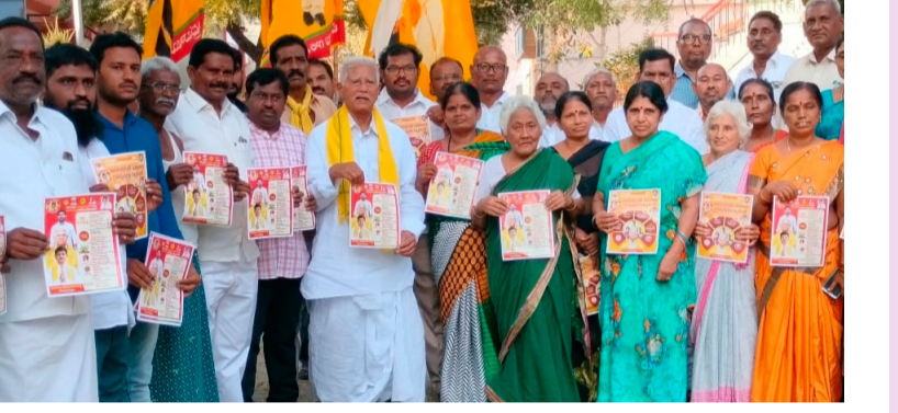
ప్రాద్దుటూరు, ఫిబ్రవరి9 (శ్రీచక్ర):