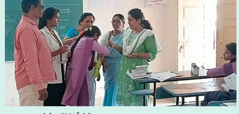
కాజులూరు, ఫిబ్రవరి 9 (శ్రీచక్ర) :