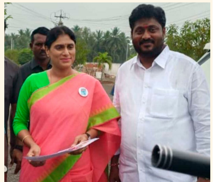
దెందులూరు ఫిబ్రవరి 9 (శ్రీచక్ర) :