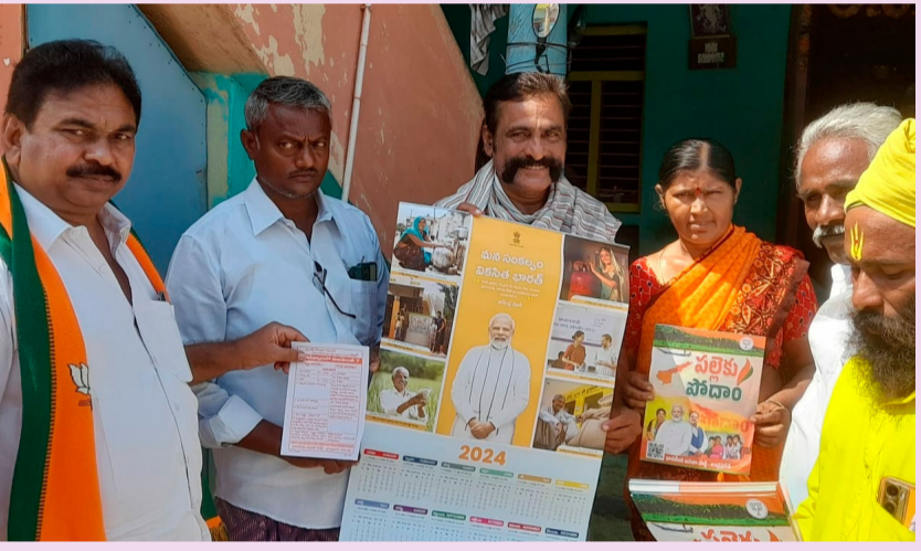
ప్రాద్దుటూరు, ఫిబ్రవరి9 (శ్రీచక్ర):

ప్రాద్దుటూరు జిజిపి అసింజ్లీ కన్వీనర్ గొర్రె శ్రీనివాసులు