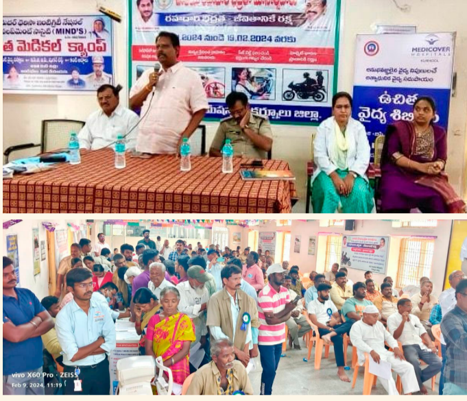
కర్నూలు, ఫిబ్రవరి 9 (శ్రీచక్ర):