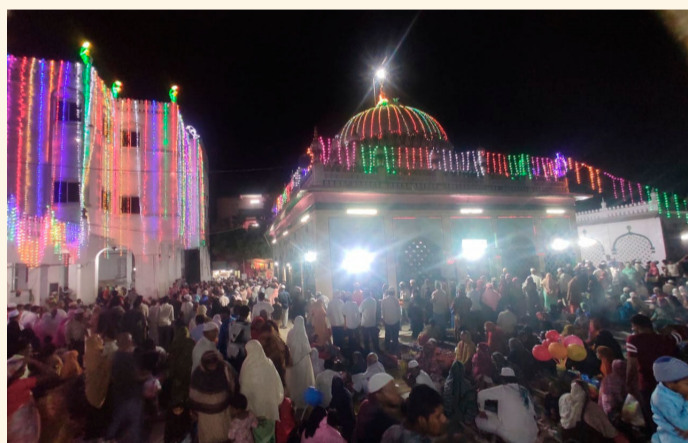
ఏఎస్ పేట, ఫిబ్రవరి9 (శ్రీచక్ర) :