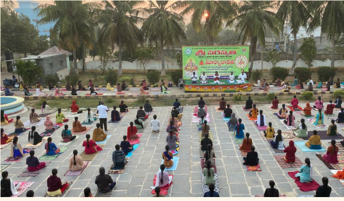
ఒంగోలు, ఫిబ్రవరి 16 (శ్రీచక్ర) :