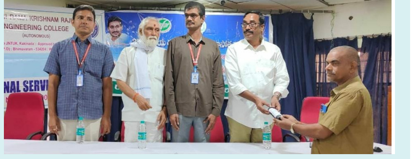
భీమవరం, ఫిబ్రవరి 16 (శ్రీచక్ర) :