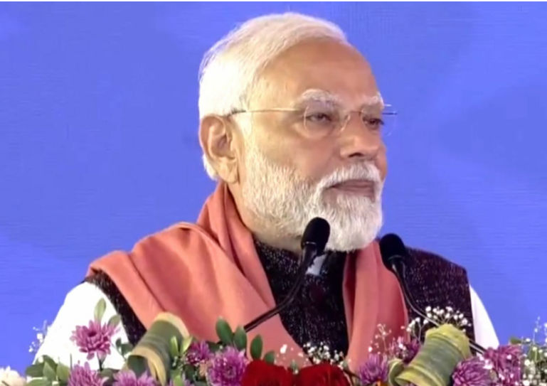
హర్యానా, ఫిబ్రవరి 16 (శ్రీచక్ర):

రైతు ఉద్యమ నేపథ్యంలో హర్యానాలో పర్యటిస్తున్న ప్రధాని నరేంద్ర మోడీ కీలక వ్యాఖ్యలు చేశారు. రైతులకు మేలు చేసే పథకాలపై కేంద్ర ప్రభుత్వం పనిచేస్తోందని శుక్రవారం అన్నారు. రైతుల బ్యాంకు రుణాలకు తమ ప్రభుత్వం గ్యారంటీ ఇచ్చిందని ప్రధాని నరేంద్రమోడీ అన్నారు. శుక్రవారం నాలుగో రోజుకు చేరిన రైతుల ఆందోళన నేపథ్యంలో ఆయన ఈ ప్రకటన చేశారు. హర్యానా రేవారిలో ఎయిమ్స్ కి శంకుస్థాపన చేసిన ప్రధాని మోడీ, కేంద్రంలోని తమ బీజేపీ ప్రభుత్వం రైతులకు ప్రయోజనాలు అందించేందుకు పనిచేస్తుందని అన్నారు. అక్కడ ఏర్పాటు చేసిన సభలో ప్రసంగించిన ప్రధాని మోడీ, కాంగ్రెస్ నేతృత్వంలోని యూపీఏ ప్రభుత్వంపై పలుమార్లు విమర్శలు గుప్పించారు. బ్యాంకుల నుంచి రుణాలు పొందేందుకు కేంద్రం రైతులకు 'గ్యారంటీ' ఇచ్చిందని, ఇంతకు ముందు వాటిని తిరస్కరించారని ప్రధాని అన్నారు. కాగా పంటకు కనీస మద్దతు(ఎంఎస్పీ) చట్టంతో సహా 12 హామీలను అమలు చేయాలని కోరుతూ రైతులు రోడ్లెక్కారు. కేంద్ర ప్రభుత్వంపై ఒత్తిడి తెచ్చేందుకు 'ఢిల్లీ ఫలో' పేరుతో దేశ రాజధాని ముట్టడికి పిలుపునిచ్చారు. అయితే, వీరందరినీ హర్యానా-ఢిల్లీ బోర్డర్ లో పోలీసులు, కేంద్ర బలగాలు అడ్డుకున్నారు. కేంద్రమంత్రులు, రైతు సంఘాల నేతలతో పలుమార్లు చర్చలు జరిపినప్పటికీ ఆందోళన విరమణపై హామీ రాలేదు.