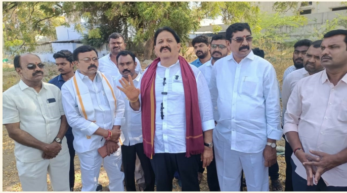
ప్రొద్దుటూరు, ఫిబ్రవరి 16 (శ్రీచక్ర) :