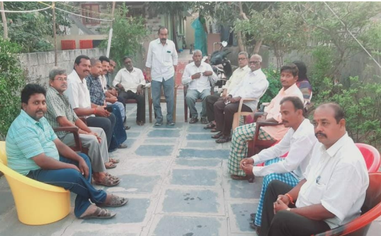
ఓరాల, ఫిబ్రవరి 16 (శ్రీచక్ర) :