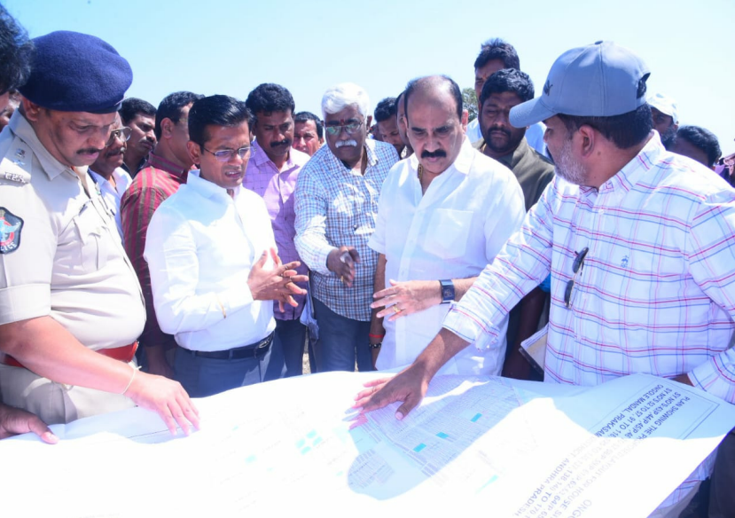
ఒంగోలు టౌన్, ఫిబ్రవరి 16 (శ్రీచక్ర) :

ముఖ్యమంత్రి జగన్ పర్యటనకు ప్రకాశం జిల్లా యంత్రాంగం ఏర్పాట్లు చేస్తున్నారు. ఈ నెల 20న రాష్ట్ర ముఖ్యమంత్రి జిల్లా పర్యటన దృష్ట్యా భద్రతా ఏర్పాట్లు ప్రకాశం జిల్లా కలెక్టర్, ఎస్సీ పాల్గొని పటిష్ట భద్రతా ఏర్పాట్లు చేస్తున్నట్లు ప్రకాశం జిల్లా ఎస్సీ పి.పరమేశ్వర రెడ్డి అన్నారు. పేదలకు ఒంగోలు నగరంలోని ఎన్ అగ్రహారం వెంగంకుల్లపాలెం గ్రామంలో జగన్ ఎన్ టౌన్ షిప్ లో ఇళ్ల