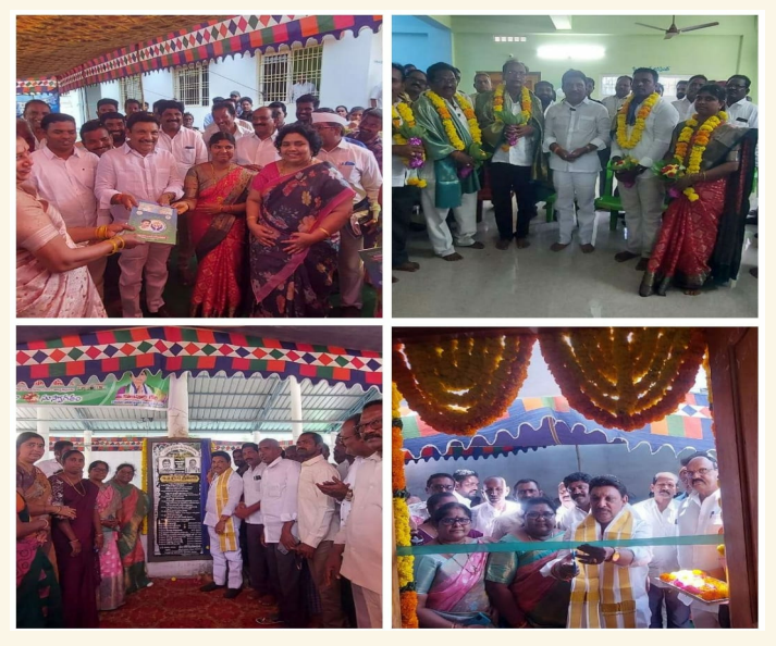
వీరవాసరం, ఫిబ్రవరి 16 (శ్రీచక్ర) :