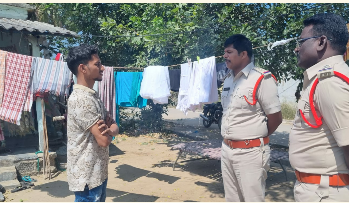
సింగరాయకొండ, ఫిబ్రవరి 16 (శ్రీచక్ర) :