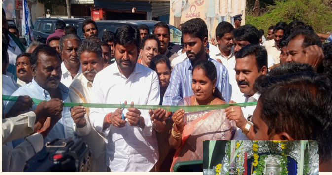
దెందులూరు, ఫిబ్రవరి 16 (శ్రీచక్ర) :