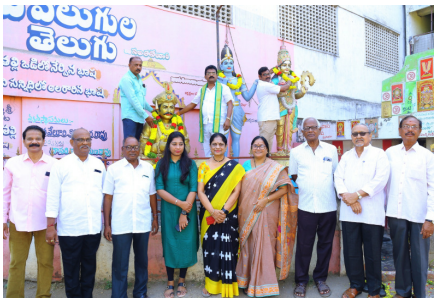
ఒంగోలు టౌన్, ఫిబ్రవరి 16 (శ్రీచక్ర) :