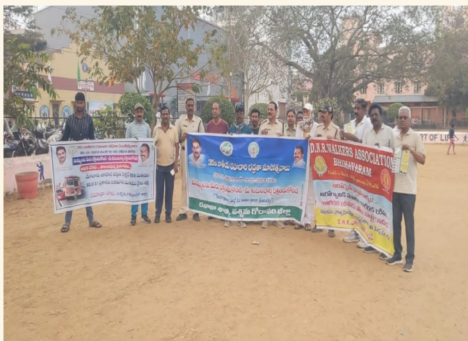
భీమవరం, ఫిబ్రవరి 16