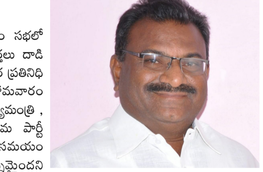
నిజామాబాద్, ఫిబ్రవరి 19 (శ్రీచక్ర) :