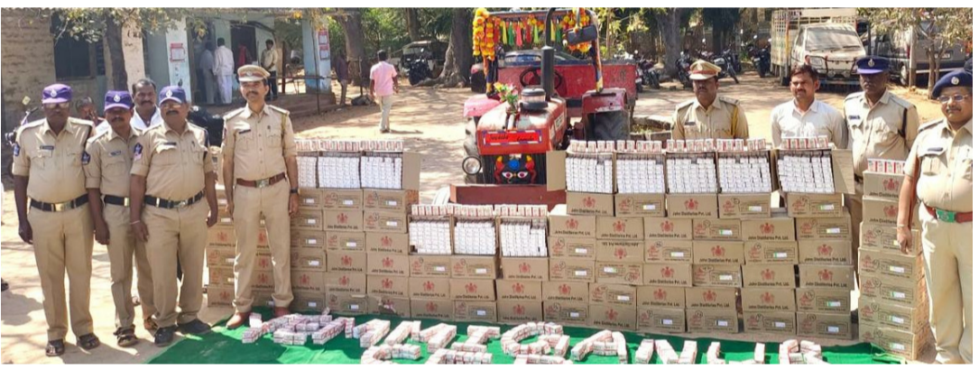
కర్నూలు, ఫిబ్రవరి 19(శ్రీచక్ర) :