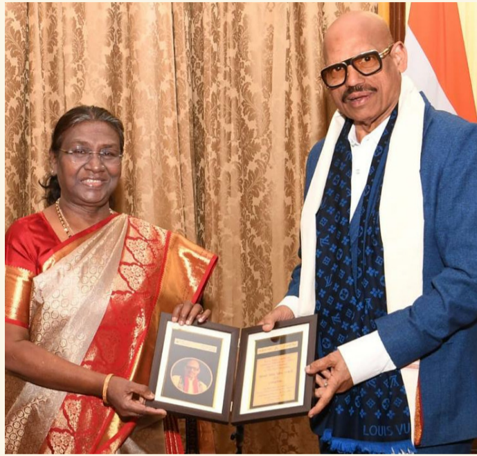
ఢిల్లీ, ఫిబ్రవరి 19(శ్రీచక్ర):

న్యూఢిల్లీలో ఈనెల 17వ తేదీ న్యూ మహారాష్ట్ర సదస్ లో జరిగిన కార్యక్రమంలో రాజ్యసభ సభ్యులుగా ఉన్న సమయంలో ఆరు శాఖల పార్లమెంటరీ స్టాండింగ్ కమిటీ చైర్మన్లు చేసిన అత్యుత్తమ కృషికి గాను సంసద్ మహారత్న అవార్డు అందుకున్న రాజ్యసభ మాజీ సభ్యులు టీజీ వెంకటేష్ న్యూఢిల్లీలో రాష్ట్రపతి ద్రౌపది ముర్మును సోమవారం మర్యాదపూర్వకంగా కలుసుకున్నారు. ఈ సందర్భంగా రాష్ట్రపతి ద్రౌపది రాజ్యసభ మాజీ సభ్యులు టీజీ వెంకటేష్ కు సంసద్ మహారత్న అవార్డు జ్ఞాపికలను, ప్రశంసా పత్రాన్ని అందజేసి అభినందించారు. 2019 నుంచి 2022 వరకు ఆరు శాఖల పార్లమెంటరీ స్టాండింగ్ కమిటీ చైర్మన్లు అత్యుత్తమ సేవలు అందించిన మాజీ రాజ్యసభ సభ్యులు టీజీ వెంకటేష్కు ప్రైమ్ పాయింట్ ఫౌండేషన్ అనే సంస్థ అవార్డును ప్రకటించింది. ఈ అవార్డును ఢిల్లీలో జరిగిన కార్యక్రమంలో తెలంగాణ గవర్నర్ తమిళ సై సౌందర రాజన్ చేతుల మీదుగా రాజ్యసభ మాజీ సభ్యులు టీజీ వెంకటేష్ అందుకున్న విషయం తెలిసింది . ఈ నేపథ్యంలో రాజ్యసభ మాజీ సభ్యులు వెంకటేష్ రాష్ట్రపతి ద్రౌపది ముర్మును మర్యాదపూర్వకంగా కలిసి ఆమెచే అభినందనలు, ప్రశంసలు అందుకున్నారు