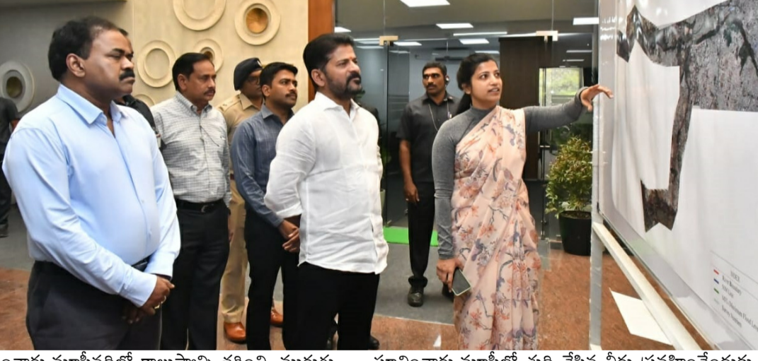
ఆదేశించారు. మూసీనదిలో కాలుష్యాన్ని తగ్గించి, మురుగు నీరు ప్రవహించకుండా అవసరమైన ప్రాంతాల్లో మురుగునీటి శుద్ధి ప్లాంట్లను ఏర్పాటు చేయాలని సూచించారు. మూసీలో శుద్ధి చేసిన నీరు ప్రవహించేందుకు చర్చలు చేపట్టడంతోపాటు తగు నీటి మట్టం ఉండేలా చెక్ డ్యాంలు నిర్మించాలని సీఎం రేవంత్ రెడ్డి ఆదేశించారు.

హైదరాబాద్ మహానగరంలో మూసీని ప్రారంభమయ్యే ప్రాంతం నుంచి చివరి వరకు మూసీ నది పరీవాహక ప్రాంతాన్ని మొత్తం ఉపాధి, ఆర్థికాభివృద్ధి ప్రాంతంగా రూపొందించాలని ముఖ్యమంత్రి రేవంత్ రెడ్డి ఆదేశించారు. మూసీ రివర్ ప్రాజెక్ట్ డెవలప్మెంట్ కార్యక్రమంపై సమీక్ష సమావేశం నిర్వహించారు. ఈ సమావేశంలో పలు కీలక అంశాలపై చర్చించారు. ఈ సందర్భంగా సీఎం రేవంత్ రెడ్డి మాట్లాడుతూ.. ట్రిడ్డీలు, కమ్యూనిటీ, హాపింగ్ కాంప్లెక్సులు, అమ్మాజీమెంట్ పార్కులు, హాకర్ జోన్లు, పాత్ వేలను ప్రభుత్వ, ప్రైవేటు పార్ట్నర్ షిప్ విధానంలో నిర్మించే విధంగా సమగ్ర ప్రణాళికల రూపొందించాలని అధికారులను