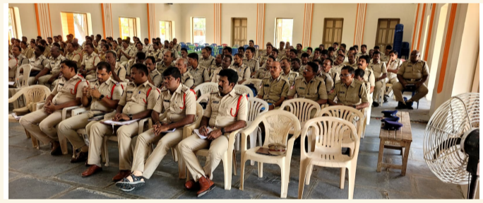
చీరాల, ఫిబ్రవరి19