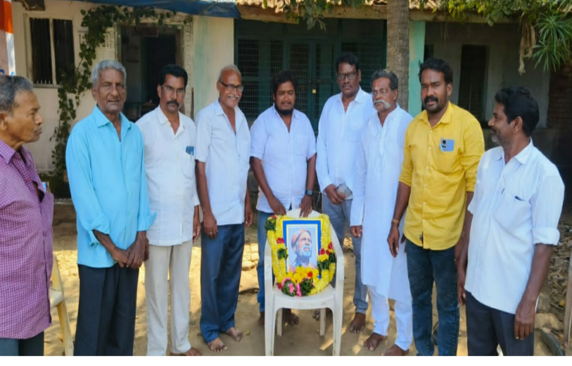
రామచంద్రపురం, ఫిబ్రవరి 23 (శ్రీచక్ర) :