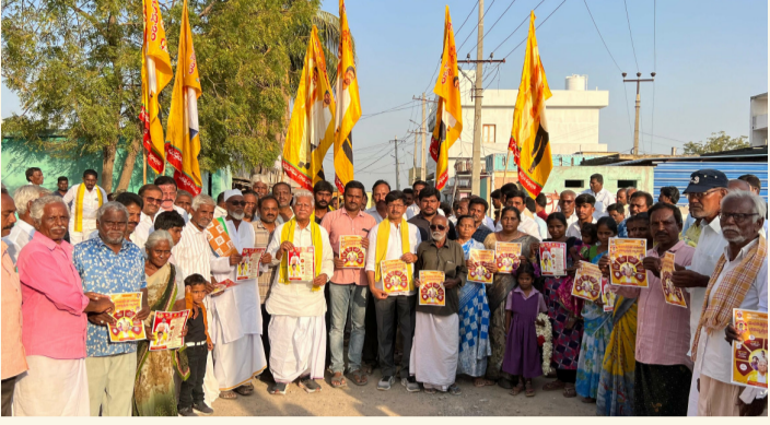
ప్రొద్దుటూరు, ఫిబ్రవరి 23 (శ్రీచక్ర) :