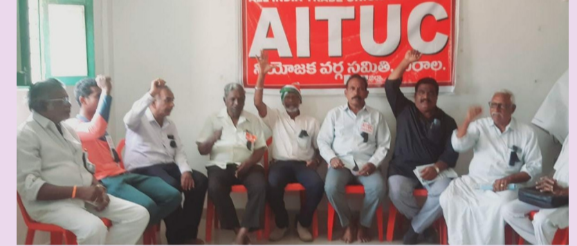
చీరాల, ఫిబ్రవరి 23 (శ్రీచక్ర) :