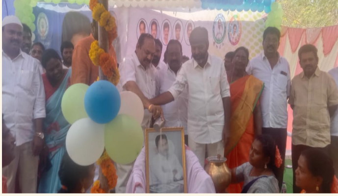
కోట, మార్చి 1 (తీచక్క) :