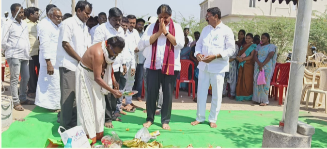
ప్రాద్దుటూరు, మార్చి 1 (శ్రీచక్ర):