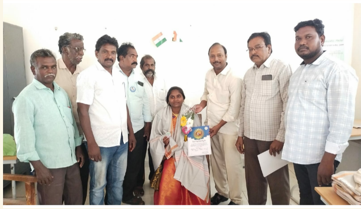
తాడేపల్లిగూడెం, మార్చి 1(శ్రీచక్ర) :