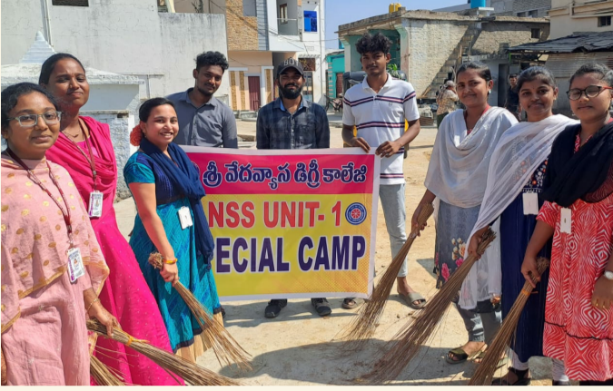
ప్రాద్దుటూరు, మార్చి 1 (శ్రీచక్ర):