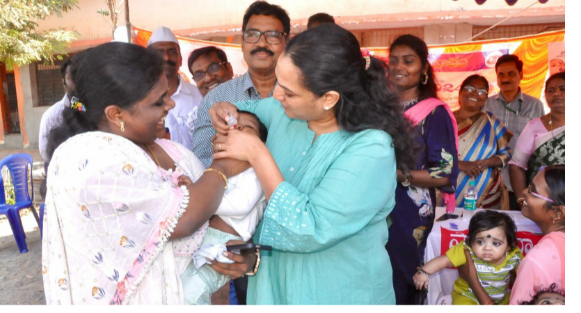
కర్నూలు, మార్చి 3 (శ్రీచక్ర):