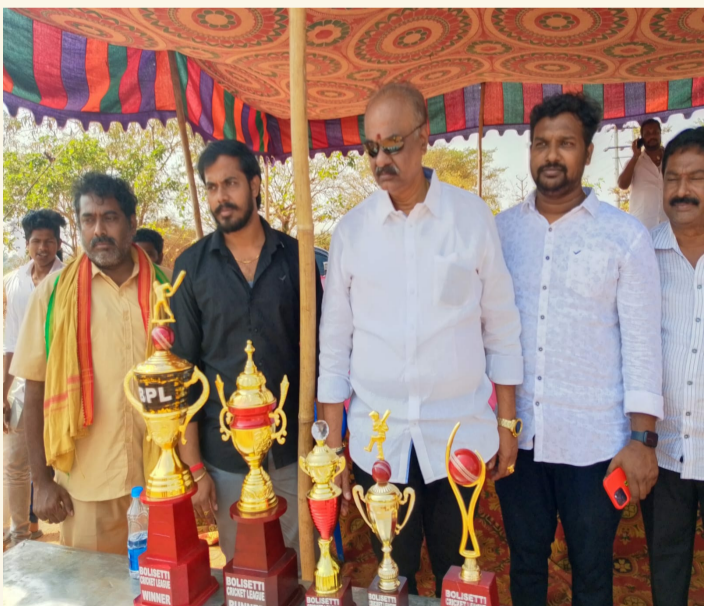
తాడేపల్లిగూడెం, మార్చి 3 (శ్రీచక్ర) :