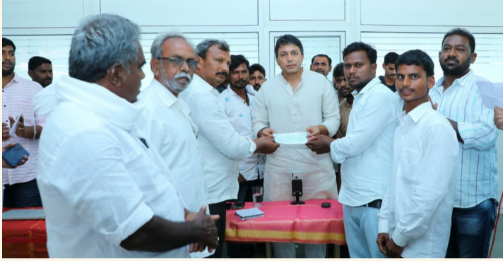
మరిపాడు, మార్చి 3 (శ్రీ చక్ర) :