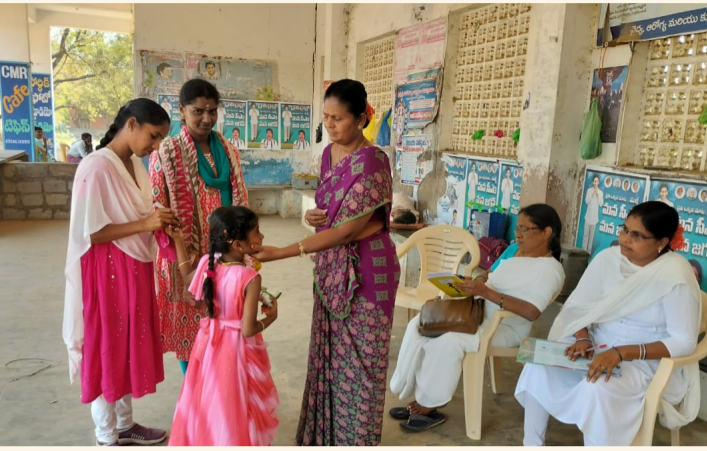
బాలాయపల్లి, మార్చి 03(శ్రీచక్ర) :