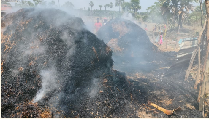
పోలవరం నియోజకవర్గం ప్రతినిధి, మార్చి 03 (శ్రీచక్ర) :

● రూ 30 వేల ఆస్తి నష్టం ● అర్జునుల్లో ఘటన