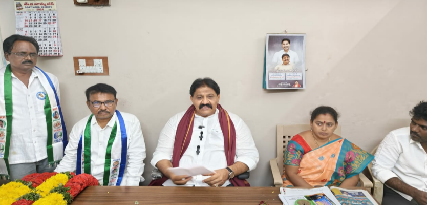
ప్రాద్దుటూరు, మార్చి 3 (శ్రీచక్ర) :