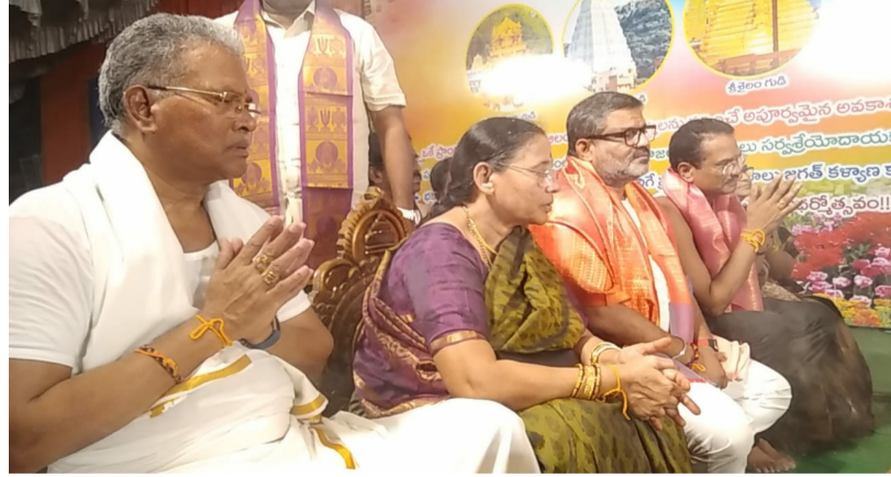
తాడేపల్లిగూడెం, మార్చి 03 (శ్రీచక్ర) :