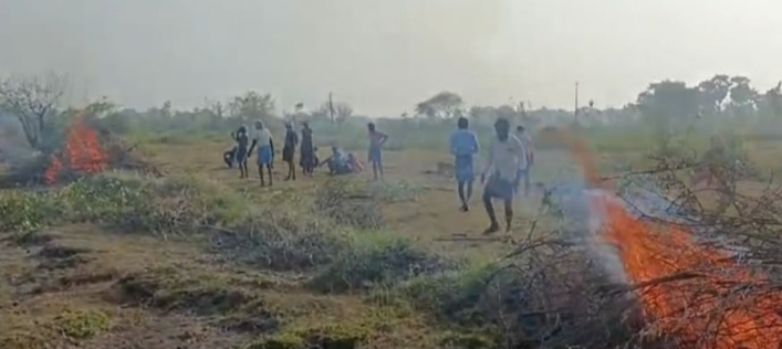
బాలాయపల్లి, మార్చి 03(శ్రీచక్ర) :