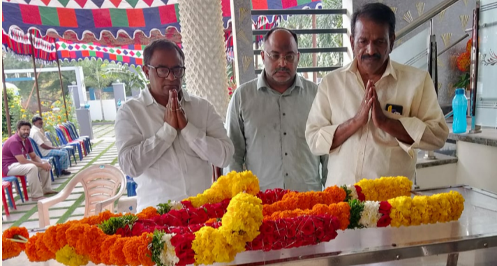
ఉదయగిరి/కలిగిరి, మార్చి 3 (శ్రీచక్ర) :

● సంతాపం తెలిపిన పలువురు రాజకీయ ప్రముఖులు, నాయకులు