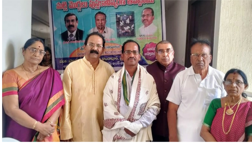
పెద్దకడబూరు, మార్చి 3 (శ్రీచక్ర) :