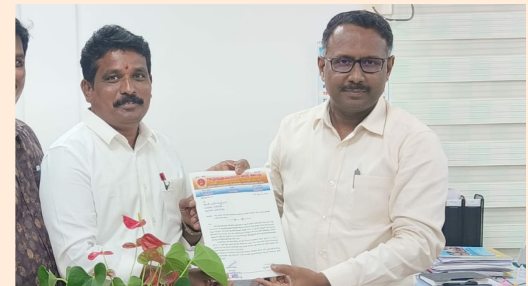
ప్రాద్దుటూరు, మార్చి 7, (శ్రీచక్ర) :