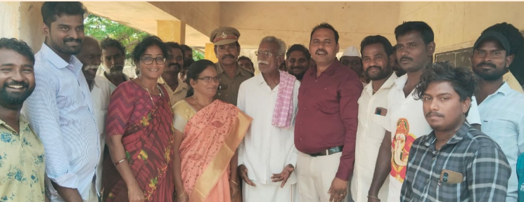
సూర్యపేట ప్రతినిధి, మార్చి07(శ్రీచక్ర) :

పేర్నాడు గ్రామంలో "రోడ్డు వేస్తేనే ఓటు వేస్తాము" అనే నినాదం గురించి అన్ని డిపార్ట్మెంట్ అధికారులు రావడం జరిగింది. ఎమ్మార్వో మాకు సపోర్ట్ గా మాట్లాడారు కానీ 4000 ఓట్లు ఆపడం వలన మీకు రోడ్డు రాదు అని చెప్పారు. ఆర్ అండ్ బీ డీఈ మాట్లాడుతూ మేము త్వరలోనే ఫండ్ తీసుకొస్తాము అని చెప్పారు. ఫార్వెస్ట్ అధికారులు మాట్లాడుతూ మేము అంతకుముందు అప్రూవల్ కోసం రిపోర్ట్ పంపాము త్వరలోనే వస్తుంది అని చెప్పారు. అందుకు మూడు పంచాయతీ ప్రజలు.. మేము ఇప్పుడు మ్యెల్యే అభ్యర్థులని నమ్మి మోసపోయామే మళ్ళీ ఓట్లు వేసి మోసపోలేము మాకు ఎలక్షన్ వద్దు అని చెప్పడం జరిగింది. రోడ్డు వేయకుండా ఓటింగ్ కి వెళ్లేము సార్ మా సమస్య పరిష్కారం జరిగితేనే ఓటింగ్ అని చెప్పడం జరిగింది.