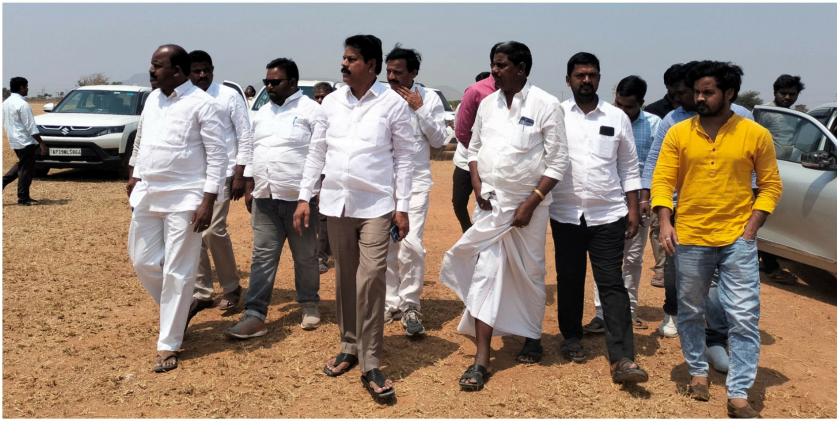
యర్రగొండపాలెం, మార్చి 7(శ్రీచక్ర) :