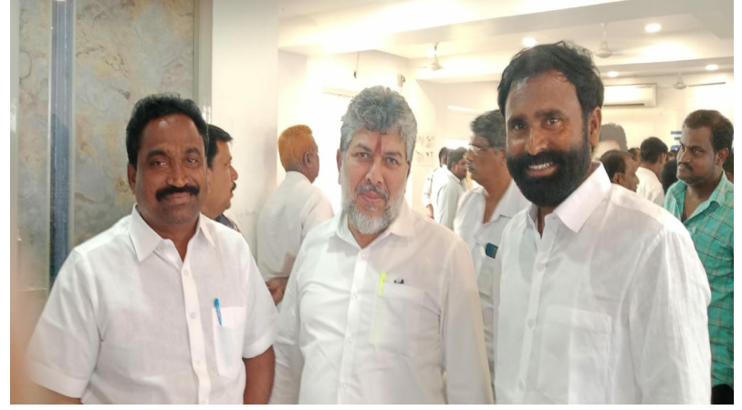
కోట, మార్చి07(శ్రీచక్ర) :