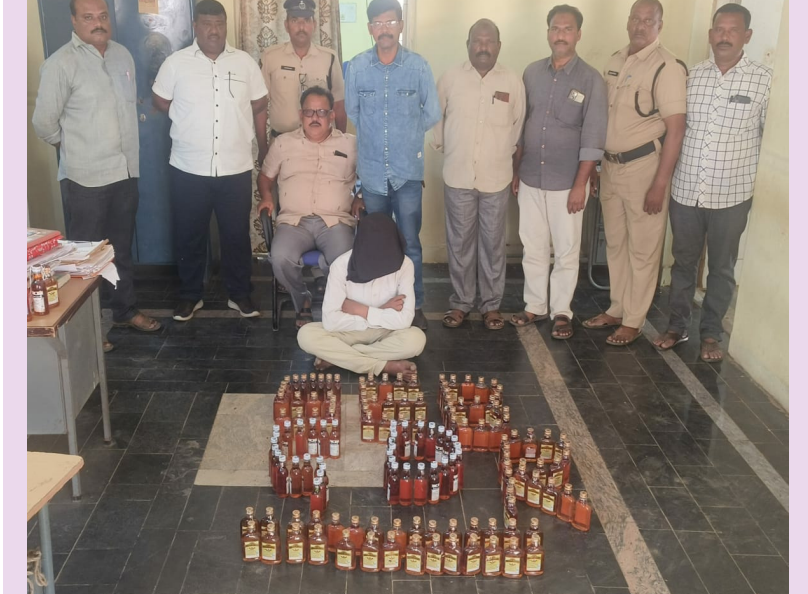
గూడూరు, మార్చి07(శ్రీచక్ర) :