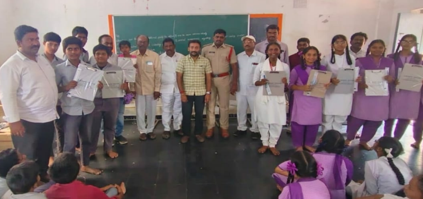
పామూరు, మార్చి 7(శ్రీచక్ర) :