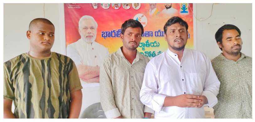
గూడూరు, మార్చి07(శ్రీచక్ర) :