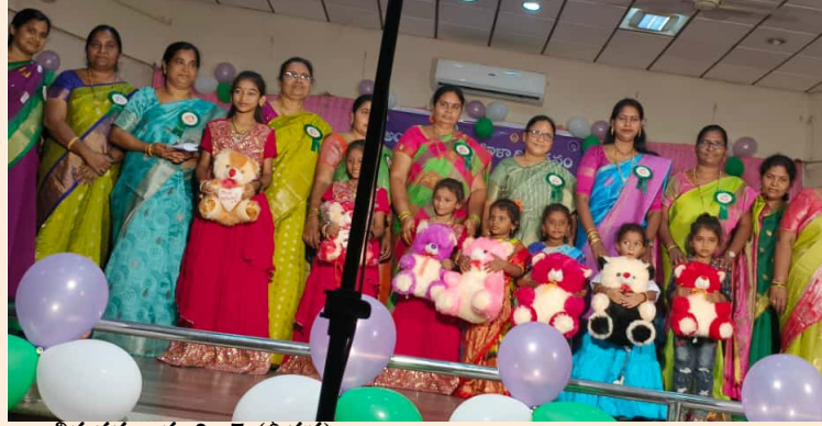
భీమవరం, మార్చి 7 (తీచక) :