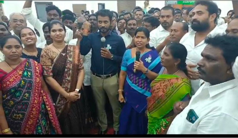
ద్వారకాతిరుమల, మార్చి07(శ్రీచక్ర) :