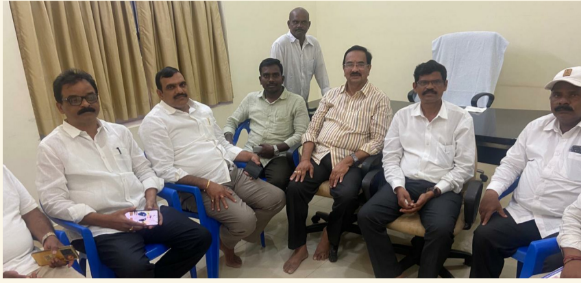
ఉదయగిరి, మార్చి 9 (శ్రీచక్ర) :