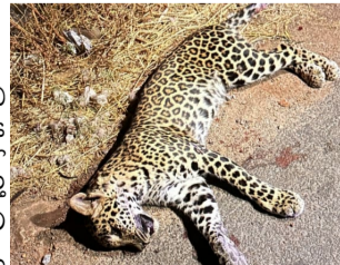
పెద్దకడబూరు, మార్చి 09 (శ్రీచక్ర) :

పెద్దకడబూరు మండల పరిధిలోని హనుమాపురం గ్రామం శివారుల్లో శనివారం తెల్లవారుజామున గుర్తు తెలియని వాహనం ఢీ కొని చిరుత పులి మృతి చెందింది. ఎమ్మిగనూరు మండలంలోని గుడేకల్ కొండలో నిప్పు పెట్టడంతో చిరుత పులి అక్కడి వచ్చి జాతీయ రహదారిని దాటుతుండగా అటువైపు వెళుతున్న గుర్తు తెలియని వాహనం బలంగా ఢీ కొట్టడంతో అక్కడికక్కడే మృతి చెందింది. ఉదయం గమనించిన హనుమాపురం గ్రామస్తులు అటవీశాఖ అధికారులకు సమాచారం ఇచ్చారు. సంబంధనా స్థలానికి వచ్చిన అటవీశాఖ అధికారులు చిరుత పులి మృతదేహానికి పోస్టుమార్టం నిర్వహించి పూడ్చి పెట్టారు.