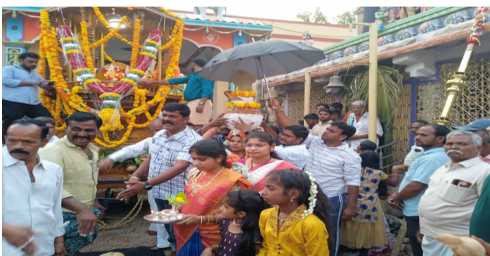
పెద్దకడబూరు, మార్చి 09 (శ్రీచక్ర) :