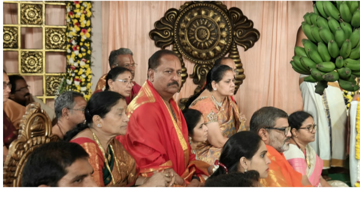
తాడేపల్లిగూడెం, మార్చి 09 (శ్రీచక్ర) :

• పట్టు వస్త్రాలు సమర్పించిన డిప్యూటీ సీఎం కొట్టు దంపతులు