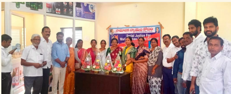
నిజామాబాద్, మార్చి 9(శ్రీచక్ర):