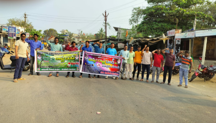
చింతూరు, మార్చి 10 (శ్రీచక్ర) :

చింతూరు ఏజెన్సీలో ఆదివారం తలపెట్టిన మన్యం బండ్ విజయవంతంగా ముగిసింది. విలీన మండలాల్లోని చింతూరు,వర రామచంద్రపురం,కూనవరం, ఎటపాక మండలాల్లో మన్యం బండ్ కు సిపిఎం,ఆదివాసి సంఘాలు మద్దతు తెలిపాయి.ఆదివాసీలు పిలుపు మేర విలీన మండలాల్లోని వ్యాపారస్థులు, దుకాణదారులు స్వచ్ఛందంగా బండ్ లో పాల్గొన్నారు.ఆదివాసి స్పెషల్ డివిన్య