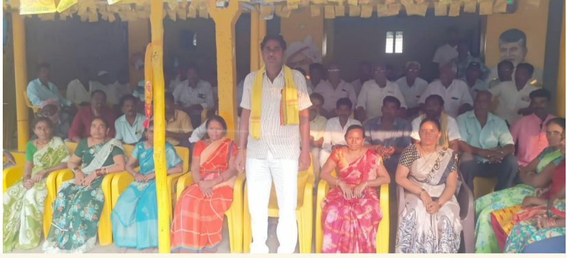
వేలేరుపాడు, మార్చి10(శ్రీచక్ర) :

వేలేరుపాడు టిడిపి నేతలు కార్యకర్తలు డిమాండ్