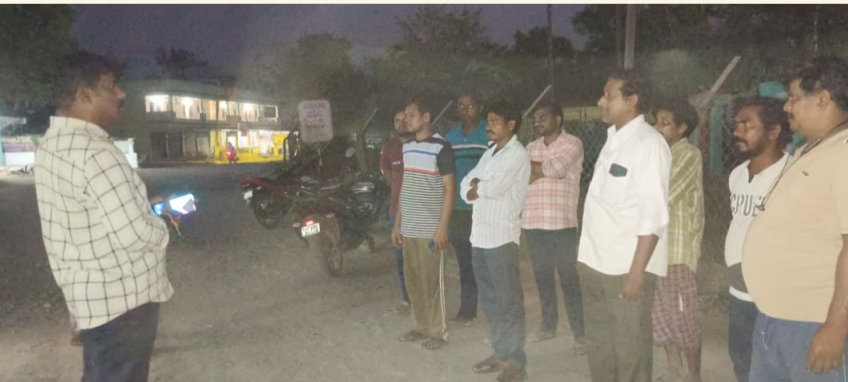
కుక్కుసూరు, మార్చి10(శ్రీచక్ర) :

కుక్కుసూరు మండల కేంద్రంలో పోలీస్ స్టేషన్ పరిధిలో వాహనాల తనిఖీలు నిర్వహించారు. ఈ తనిఖీలు లో వాహనదారులు ప్రతి ఒక్కరి లైసెన్సులను, బండి పేపర్లు పరిశీలించారు. ప్రతి వాహనదారుడు తప్పనిసరిగా లైసెన్స్ కలిగి ఉండాలని, బండి పేపర్లు, హెల్మెట్ తప్పనిసరిగా ఉండాలని వాహనదారులకు చుచించారు. వెసికల్ చట్టాలను ఉల్లంఘిస్తే చర్యలు తప్పవని హెచ్చరించారు. ఈ కార్యక్రమంలో పోలీస్ నిబ్బంది, వాహనదారులు పాల్గొన్నారు.