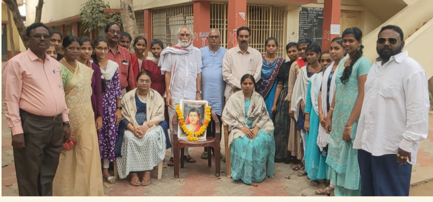
భీమవరం, మార్చి 10 (శ్రీచక్ర) :

• ఇరువురు ఉపాధ్యాయులను సత్కరించిన జిల్లా సర్వోదయ మండలి