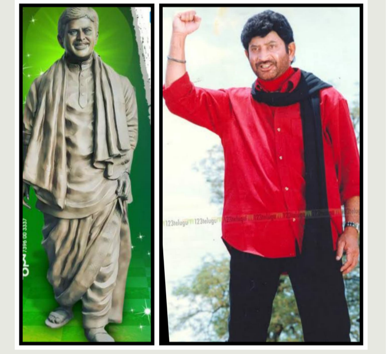
రాజుపేంఠ్రవరం, మార్చి10 (శ్రీచక్ర) :