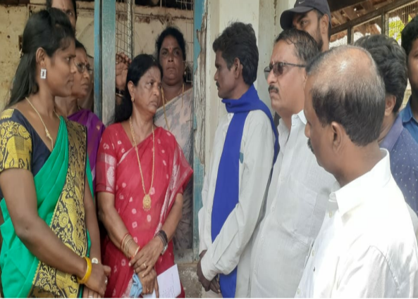
పిఠాపురం/యు. కొత్తపల్లి, మార్చి 10 (శ్రీచక్ర) :

• సమస్యలు పరిష్కారం చూపే కార్యాక్రమం చేయాలని మంకుపట్టు