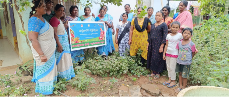
ద్వారకాతిరుమల, మార్చి 10 (తీచక) :