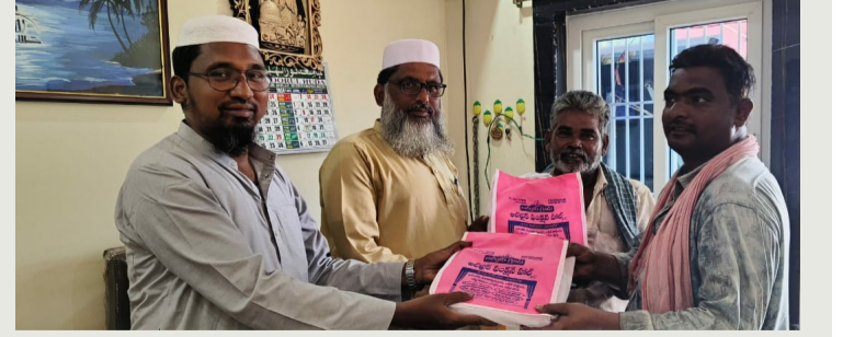
ఉదయగిరి, మార్చి 10 (శ్రీచక్ర) :

ఉదయగిరి పట్టణంలోని అల్ ఖైర్ ఫంక్షన్ హాల్ ఏర్పాటు చేసి సంవత్సరం పూర్తి కావడంతో ప్రథమ వార్షికోత్సవం సందర్భంగా 100 మంది సిబ్బందికి పేదలకు ఉచితంగా అల్ ఖైర్ బ్రదర్స్ బట్టలు పంపిణీ చేశారు. ఈ సందర్భంగా వారు మాట్లాడుతూ ఫంక్షన్ హాల్ అభ్యుత్పాదిక సిబ్బంది ఎంతగానో కృషి చేశారని అందుకు కృతజ్ఞతగా బట్టలతో సిబ్బందికి సత్కారం చేశామన్నారు. భవిష్యత్తులో మరెన్నో సేవా కార్యక్రమాలు చేపట్టేందుకు ముందుకు రాబోతున్నామన్నారు.