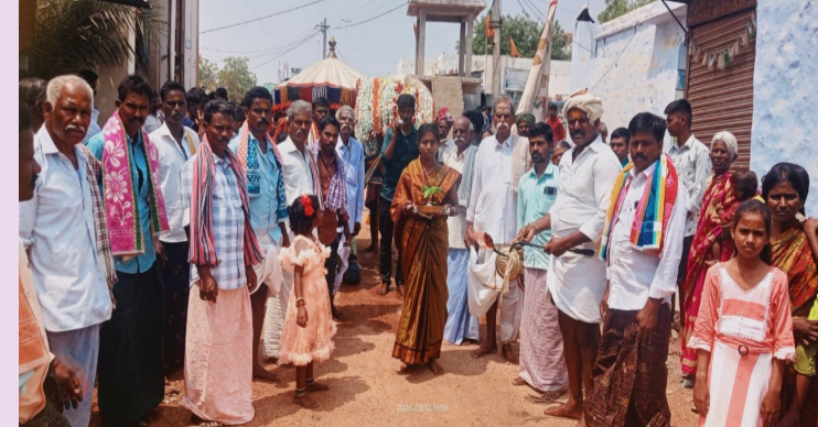
పెద్దకడబూరు, మార్చి 10 (శ్రీచక్ర) :