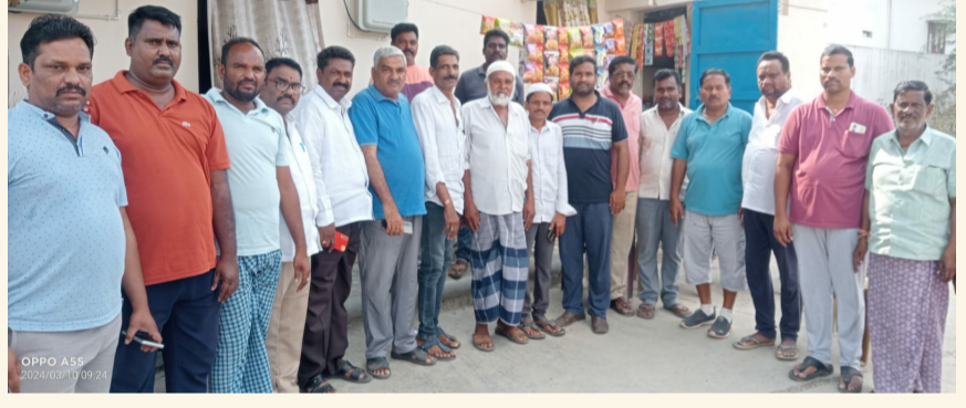
పామారు, మార్చి 10 (తీచక) :