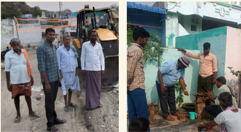
పెద్దకడబూరు, మార్చి 11 (శ్రీచక్ర) :