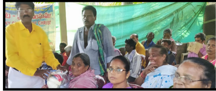
రాజమహేంద్రవరం, మార్చి11 (శ్రీ చక్ర) :