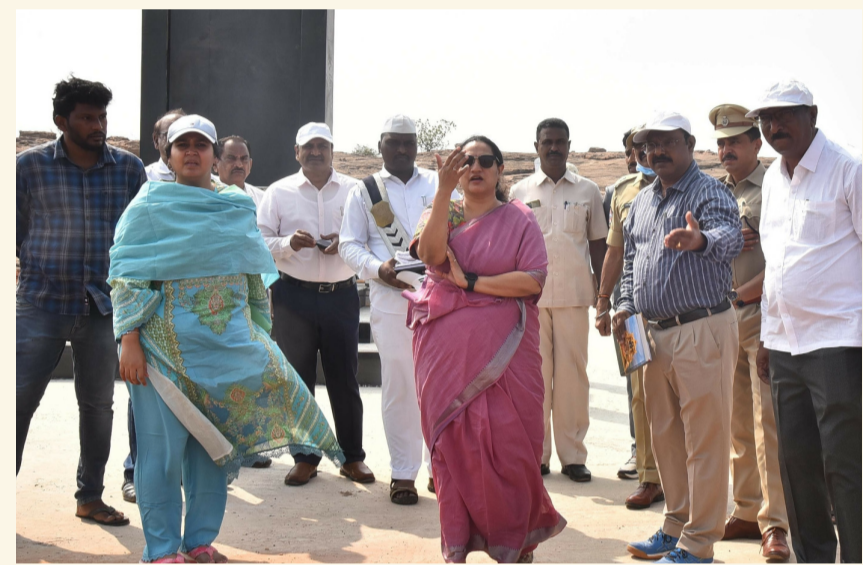
కర్నూలు, మార్చి 11 (శ్రీచక్ర):