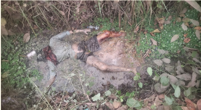
కాజులూరు, మార్చి11(శ్రీచక్ర) :