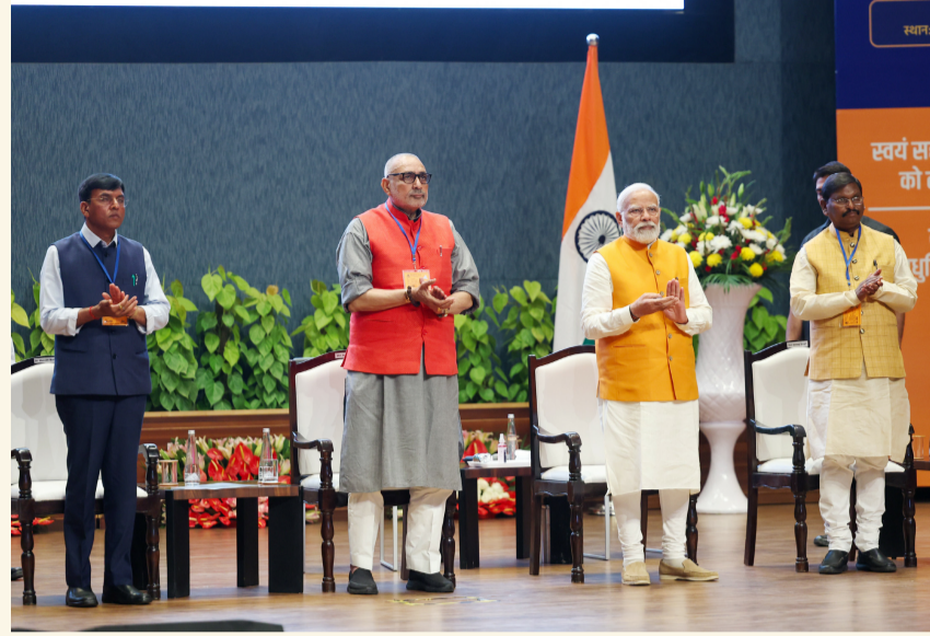
న్యూఢిల్లీ, మార్చి 11 (శ్రీచక్ర) :