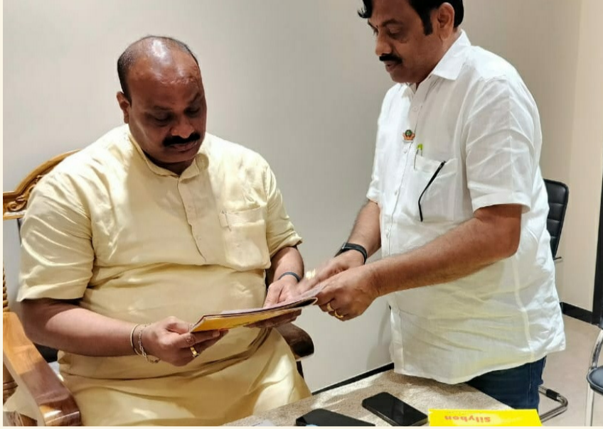
రామచంద్రపురం, మార్చి11(శ్రీచక్ర) :

• టీడీపీ రాష్ట్ర అధ్యక్షులు అచ్చం నాయుడుని కోరిన టీడీపీ నేత :డాక్టర్ చప్పిడి!