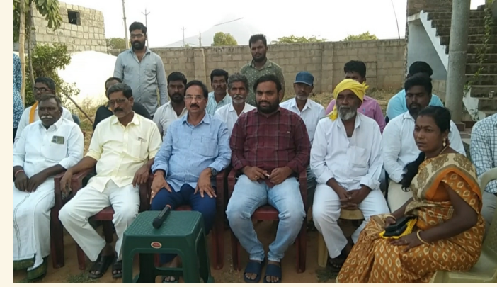
ఉదయగిరి మార్చి 19 (శ్రీ చక్ర) :