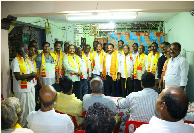
కండుకూరు, మార్చి 19 (శ్రీచక్ర) :