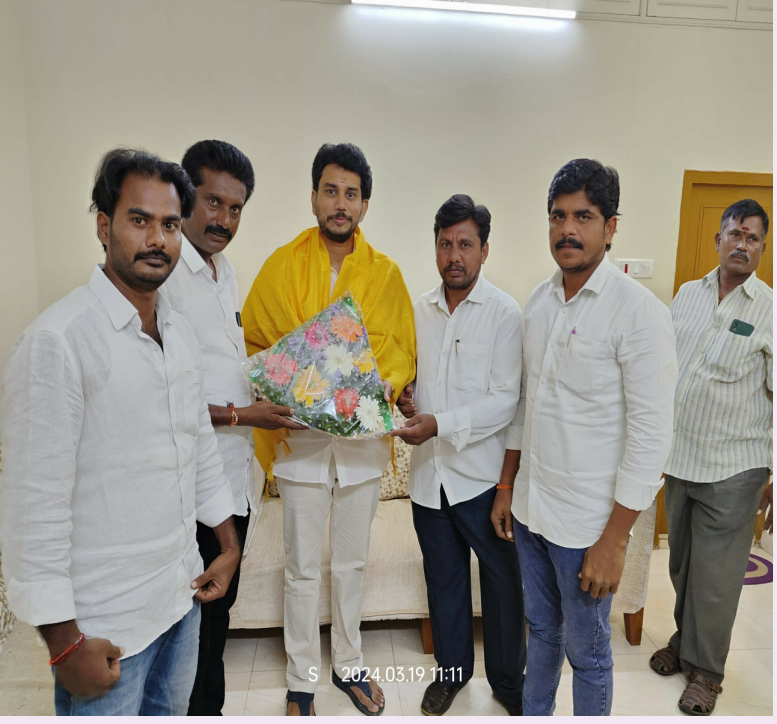
యర్రగోండపాలెం, మార్చి 19 (శ్రీచక్ర) :