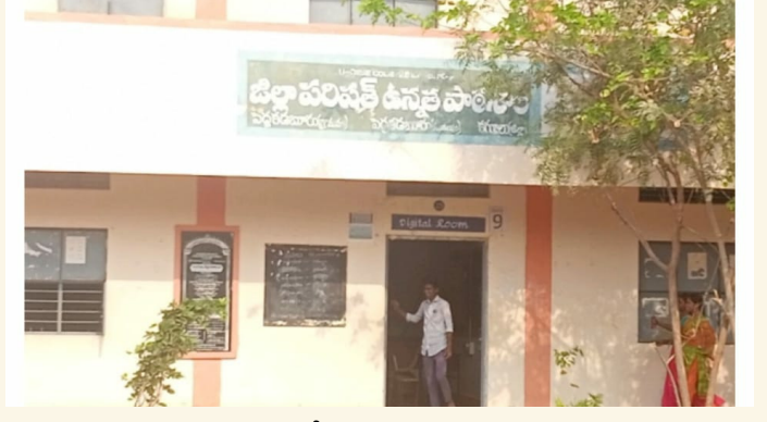
పెద్దకడబూరు, మార్చి 19 (శ్రీచక్ర) :