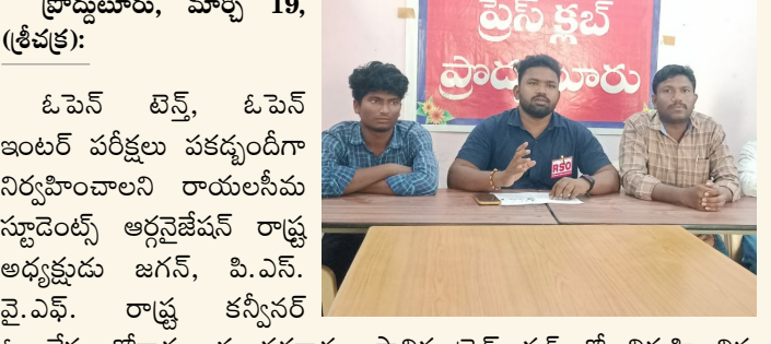
ప్రాద్దుటూరు, మార్చి 19, (శ్రీచక్ర):