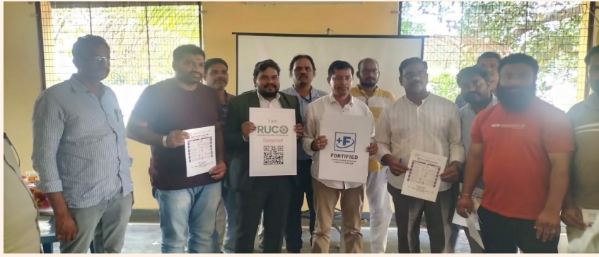
రామచంద్రపురం, మార్చి 19