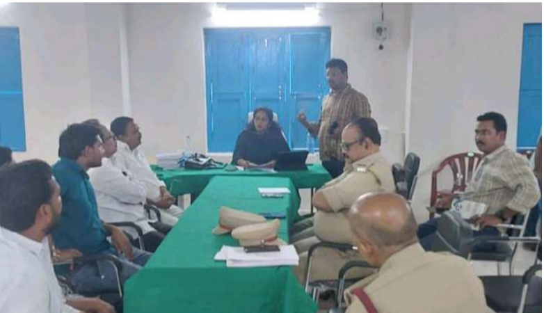
కార్యక్రమంలో నోడల్ అధికారులు ఉన్నారు.

యర్రగొండపాలెం మార్చి 21(శ్రీచక్ర )ఎన్నికల కోడ్ అమలులో ఉన్నందున ఎన్నికల ప్రచారానికి అన్ని రాజకీయ పార్టీల నాయకులు అనుమతులు తప్పనిసరిగా తీసుకోవాలని ఎర్రగొండపాలెం నియోజకవర్గ రిటనింగ్ అధికారిని డా. పి. శ్రీలేఖ అన్నారు. గురువారం ఎర్రగొండపాలెంలోని ఆర్. ఓ. కార్యాలయంలో ఆర్. రాజకీయ పార్టీల నాయకులతో సమావేశం నిర్వహించారు. ఈ సందర్భంగా పలు అంశాలపై చర్చించారు. ఈ