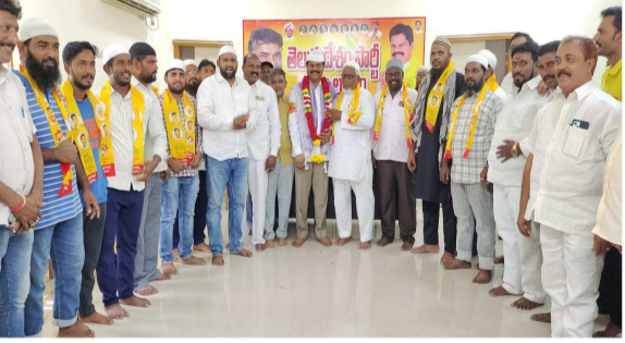
కార్యక్రమంలో తెలుగుదేశం పార్టీ నాయకులు, కార్యకర్తలు పాల్గొన్నారు.