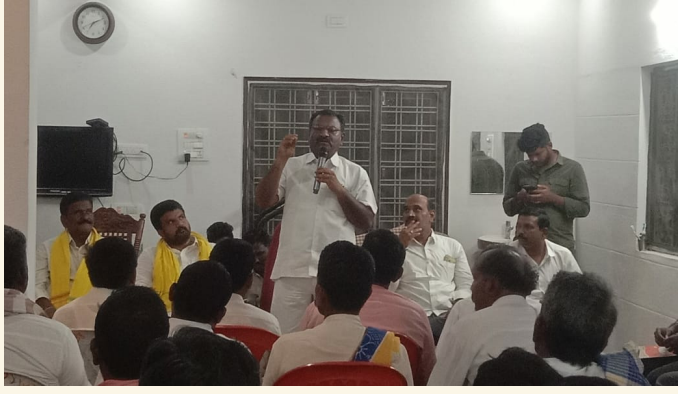
పెద్దకడబూరు, ఏప్రిల్ 05 (శ్రీచక్ర) :