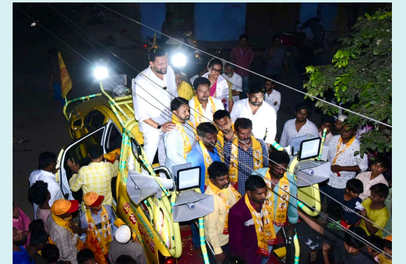
కర్నూలు, ఏప్రిల్ 5 (శ్రీచక్ర) :