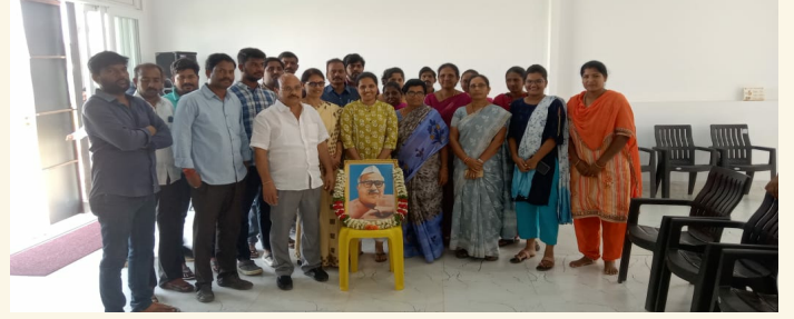
ఉదయగిరి/వింజమూరు, ఏప్రిల్ 5 (శ్రీచక్ర) :