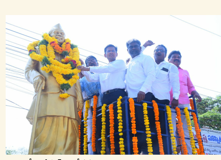
ఓంగోలు, ఏప్రిల్ 5 (శ్రీచక్ర) :