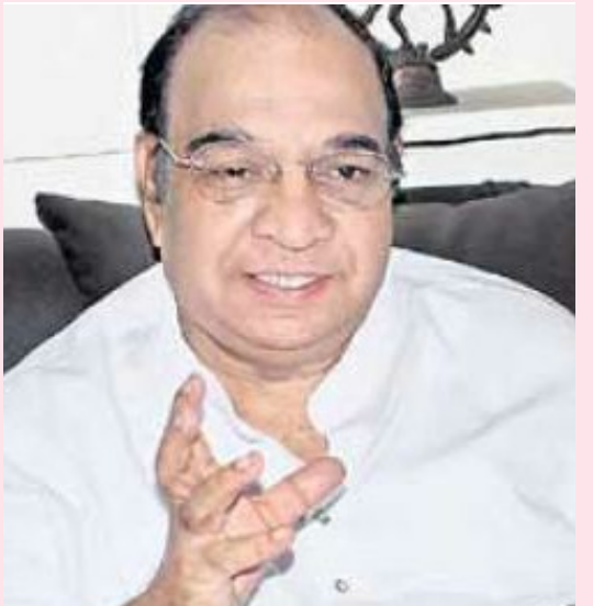
తొలి తెలుగు న్యూస్ రీడర్స్ ప్రఖ్యాతి సీఎం రేవంత్, కేసీఆర్ సంతాపం