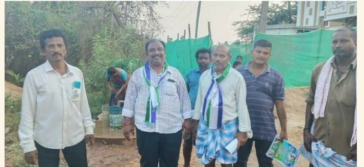
ఏఎస్ పేట, ఏప్రిల్ 5 (శ్రీచక్ర) :

ఎన్నికల ప్రచారంలో భాగంగా నేడు ఏఎస్ పేట మండల వైసీపీ నాయకుల అధ్యక్షులలో స్థానిక నాయకులతో సమీకృత మండలంలోని జమ్మవరం పంచాయతీలో గడపగడపకు ఎన్నికల ప్రచారం నిర్వహించడం జరిగింది. ఈ సందర్భంగా నాయకులు మాట్లాడుతూ మన రాష్ట్రంలో సంక్షేమ పథకాలు విరివిగా తిరిగి సాగాలంటే మళ్ళీ మనమంతా కష్టపడి జగన్మోహన్ ముఖ్యమంత్రిగా చేసుకోవాలని వారు తెలిపారు. ఏ గడపకు వెళ్ళిన జగన్మోహన్ రెడ్డి కి, పెద్దలు మన నెల్లూరు పార్లమెంట్ సభ్యులు వేణుంబాక విజయసాయి రెడ్డి కి అలాగే మన ప్రయతమ నాయకులు అత్యుకారు శాసనసభ్యులు మేకపాటి విక్రమ్ రెడ్డి కి అత్యధిక మెజారిటీతో గెలిపించేందుకు ప్రజలంతా సిద్ధంగా ఉన్నారని వారు తెలిపారు. మన నెల్లూరు పార్లమెంట్ అభ్యర్థి పెద్దలు విజయసాయి రెడ్డి ని విమర్శించే స్థాయి ప్రతిపక్ష నాయకులకు లేదని ఒంటిచేత్తో శాసించే స్థాయికి ఎదిగిన గొప్ప నాయకుడు విజయ సాయిరెడ్డి అని, రాష్ట్రంలో అనేక మంది నాయకులకు ఆయన ఆదర్శనీయుడని వారు తెలిపారు. ఈ కార్యక్రమంలో ఏఎస్ పేట మండల వైసీపీ నాయకులు, జమ్మవరం వైసీపీ నాయకులు, కార్యకర్తలు జగన్మోహన్ మరియు విక్రమ్ అన్న అభిమానులు పాల్గొన్నారు.