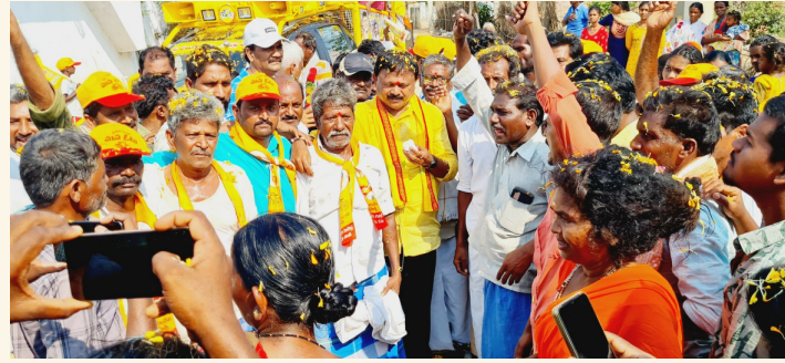
గూడూరు, ఏప్రిల్ 5 (శ్రీచక్ర) :

● ప్రజాగళం యాత్ర- సూపర్ 6 పథకాలు ప్రచారంలో భాగంగా