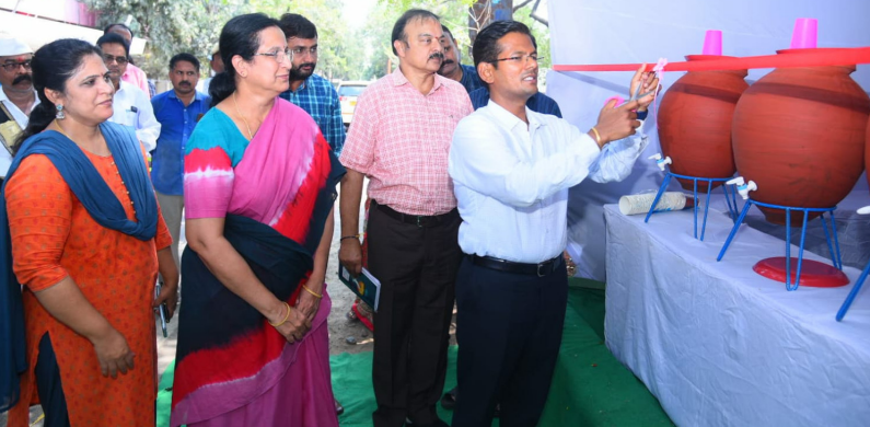
ఓంగోలు, ఏప్రిల్ 5 (శ్రీచక్ర) :