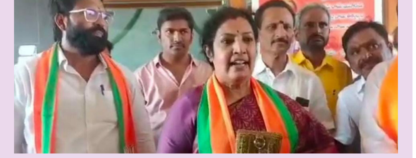
ద్వారకాతిరుమల ఏప్రిల్ 05 (శ్రీచక్ర) :

చిన్న వెంకన్న దర్శించుకున్న ఆంధ్రప్రదేశ్ రాష్ట్ర బిజెపి అధ్యక్షులూ దగ్గుపాటి పురందరేశ్వరి కుటుంబ సభ్యులతో కలిసి సమీపంగా అలయానికి చేరుకున్న ఆమెకు అలయ అధికారులు మర్యాదపూర్వకంగా స్వాగతం పలికారు ముందుగా కుటుంబ సభ్యులతో కలిసి స్వామి అమ్మవార్లను దర్శించుకుని ప్రత్యేక పూజలు నిర్వహించారు అనంతరం అలయ ముఖ మండపంలో వేద పండితులు అర్చకులు చే వేద అశీర్వాదనం పొందారు తరువాత ద్వారక తిరుమల గ్రామంలో వైష్ణవి ఫంక్షన్ హాల్ నందు నిర్వహించిన సమావేశంలో పాల్గొన్నారు ఈ సందర్భంగా మాట్లాడుతూ రాష్ట్ర ప్రజలందరూ మార్పుని అకాంక్షిస్తున్నారని మే 13న జరిగే ఎన్నికలతో ఆ మార్పు వస్తుందని అలాగే రాష్ట్రం అభివృద్ధి చెందాలన్న దేశం అభివృద్ధి చెందాలన్న ఎన్నీపి కుటమీ అభ్యర్థులకు ప్రజలందరూ ఓటు వేసి గెలిపించాలని అభ్యర్థిస్తున్నానని అదేవిధంగా రాష్ట్రంలో ఉన్న ఎండోమెంట్ సిబ్బంది ఎవరైతే ఉన్నారో వారందరినీ ఎన్నికల విధులకు వాడుకోవాలని ప్రభుత్వం భావిస్తుందని అయితే ఉత్తరాయన వచ్చింది ఈ ఉత్తరాయన కాల సందర్భంలో పండుగలు ఎక్కువగా ఉంటాయని ఈ సమయంలో వారిని ఎన్నికల విధులకు వాడుకుంటే దేవాలయాలకు వచ్చే భక్తులు చాలా ఇబ్బంది పడతారని కనుక ఈ విషయాన్ని ఎలక్షన్ కమిటీ కూడా గుర్తించి ఎవరైతే ఎండోమెంట్ సిబ్బంది ఉన్నారో వారిని ఎన్నికల విధులకు వాడకుండా దేవాలయాల వచ్చే భక్తులకు ఎటువంటి ఇబ్బందులు కలవకుండా అన్ని సదుపాయాలు సమకూర్చడానికి వారి సేవలు వినియోగించుకోవాలని అభ్యర్థిస్తున్నాను అని ఆమె తెలిపారు.