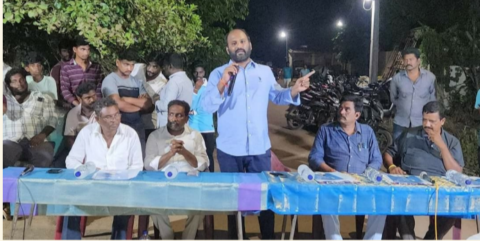
దెందులూరు, ఏప్రిల్ 15 (శ్రీచక్ర) :

● దెందులూరు మండలంలో కామిరెడ్డి నాని విస్తృత సమావేశాలు