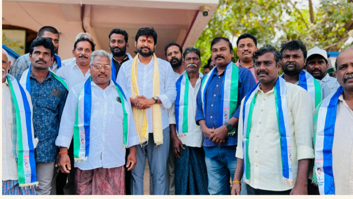
దెందులూరు, ఏప్రిల్ 15 (శ్రీచక్ర) :