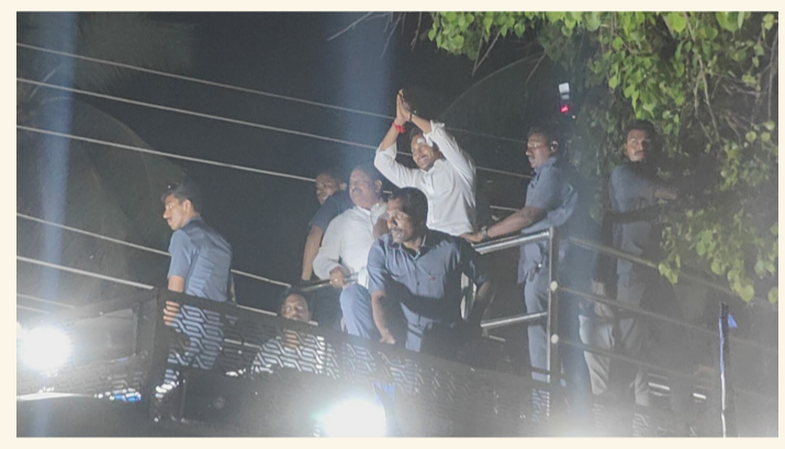
తాడేపల్లిగూడెం, ఏప్రిల్ 16 (శ్రీచక్ర) :