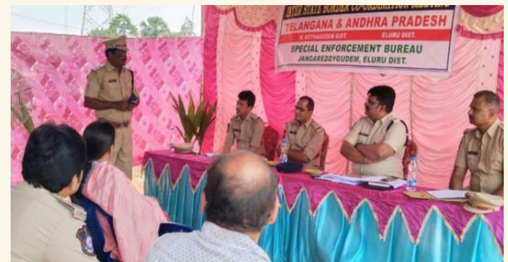
జీలుగుమిల్లి, ఏప్రిల్ 16