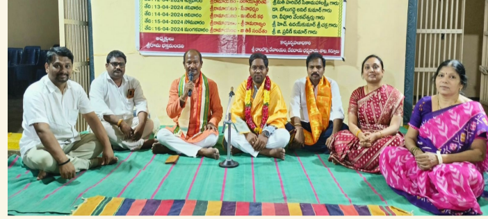
కర్నూలు, ఏప్రిల్ 16 (శ్రీచక్ర) :

● ఘనంగా ముగిసిన శ్రీమద్రామాయణ ప్రవచన సప్తాహం