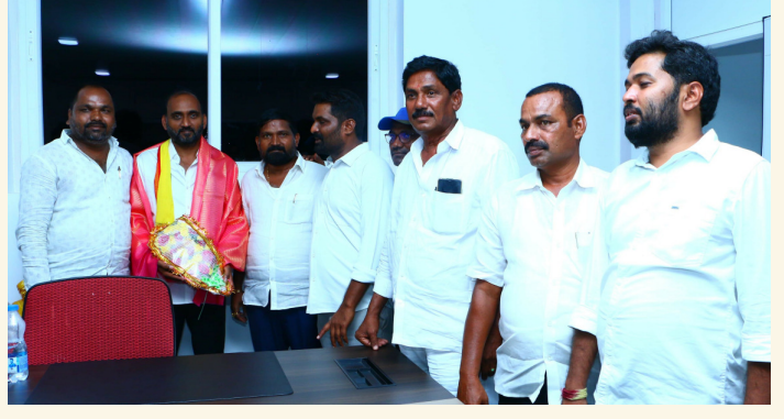
15కుటుంబాలు వైసీపీని వీడి తెలుగుదేశం లోకి చేరిక..!