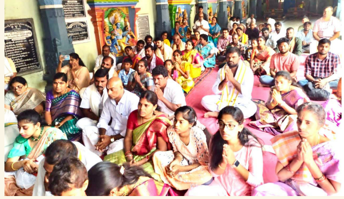
రాపూరు, ఏప్రిల్ 20 (శ్రీచక్ర) :

శ్రీ పొట్టి శ్రీరాములు నెల్లూరు జిల్లా రాపూరు మండలంలోని పెంచలకోన క్షేత్రంలో స్వయంబుగా వెలసిన స్వామి శ్రీ పెనుశిల లక్ష్మీనరసింహస్వామి దేవస్థానం నందు శనివారం సందర్భంగా ఉదయం 4.00 గంటలకు అభిషేకం 10:30 కు స్వామి అమ్మవార్లకు కళ్యాణ్ మహోత్సవం మరియు శ్రీవారి వసంత ఉత్సవాల సందర్భంగా సాయంత్రం 6.00 గంటలకు అనుజ్ఞ విశ్వ కేశనారాధన, పుణ్య హవాచనం, రక్షణంధనం, అంకురార్చన, ప్రధాన అర్చకులు, వేద పండితులు, మంత్రోచ్చారణతో, వైభవంగా నిర్వహించారు భక్తులకు ఎటువంటి లోటుపాట్లు లేకుండా క్యాంప్ లైన్ లో ఏర్పాటు చేసిన సరఫరా అన్నదానం మొదలగు కార్యక్రమాలు ఉప కమిషనర్ మరియు కార్య నిర్వహణ అధికారి పర్యవేక్షణలో ప్రత్యేక పర్యవేక్షణలో నిర్వహించడం జరిగింది.