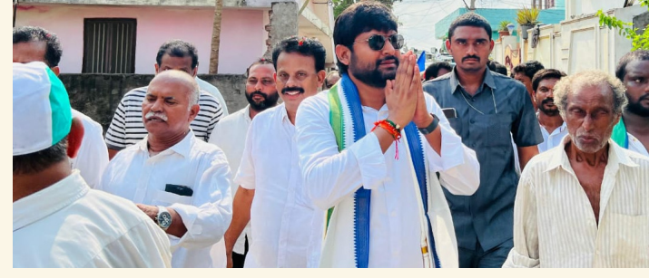
పెదపాడు, ఏప్రిల్ 20 (శ్రీచక్ర) :

● రెండవ రోజు పెదపాడు మండలంలో మన ఊరు మన కొరారు కార్యక్రమం