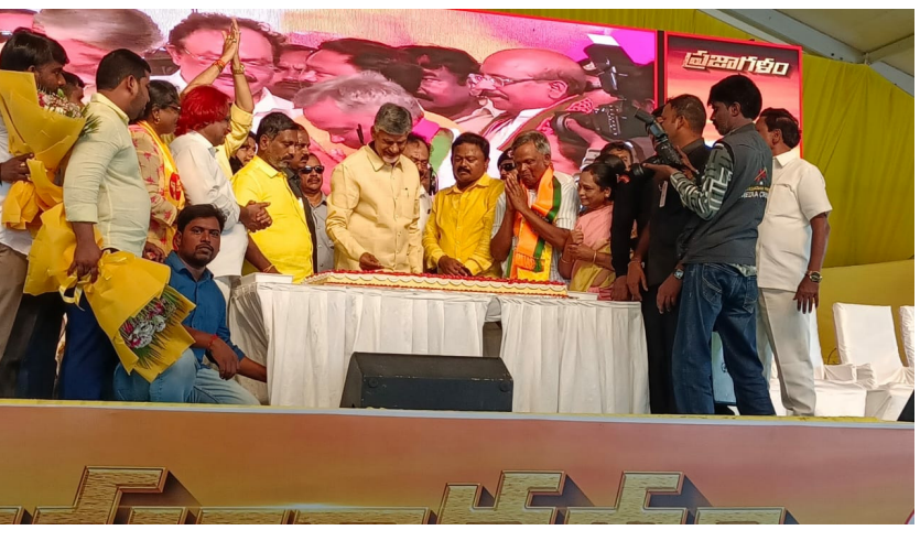
గూడూరు, ఏప్రిల్ 20 (శ్రీచక్ర) :