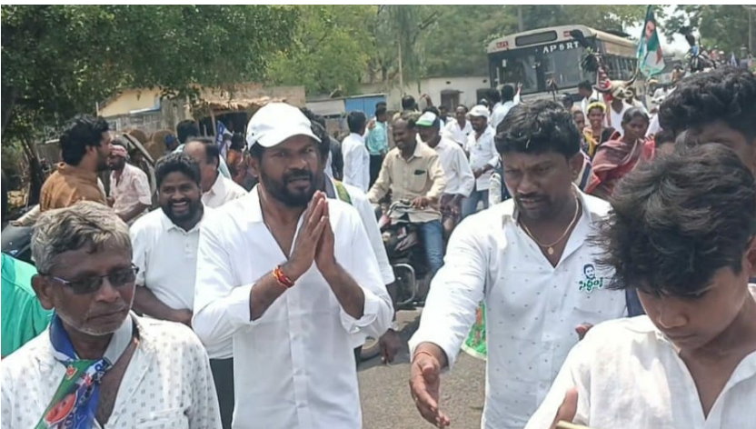
కుక్కునూరు, ఏప్రిల్ 20 (శ్రీచక్ర) :

కుక్కునూరు మండలంలో వింజరం, మాధవరం. దామరచర్ల పంచాయతీ లో ఉన్న గ్రామాల్లో విస్తృత ప్రచారం సాగించారు. ప్రతి గ్రామంలో వైఎస్ఆర్పి నాయకులు ప్రజలు కార్యకర్తలకు ఘన స్వాగతం పలికారు. హారతి పట్టి పూలతో సన్మానం చేసి ఆశీర్వాదించారు. బైక్ ర్యాలీ నిర్వహించారు రేలా ద్యాన్లతో ఉత్సాహం నింపారు. ప్రతి గ్రామం తిరిగి ఒకటి మహాసేనులకు అభివాదం చేస్తూ ప్రచారం కొనసాగించారు. అభివృద్ధిని చూడాలంటే ఫ్యాను గుర్తుకు ఓటీసీ అక్షయ్ మెజార్స్ తో గెలిపించాలని ప్రచారం చేశారు. ప్రతి గిరిజనులకు పోడు భూముల పట్టాలు ఇచ్చేందుకు కృషి చేస్తామని అన్నారు. టీడీపీ హయాంలోనే పోలవరం