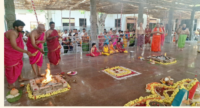
మంత్రాలయం, ఏప్రిల్ 22, (శ్రీచక్ర) :