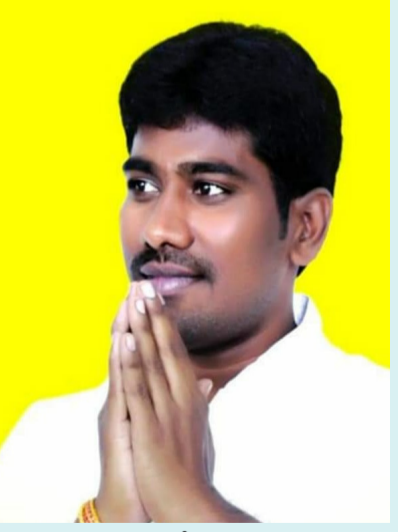
పామూరు, ఏప్రిల్ 22