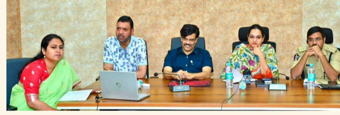
కర్నూలు, ఏప్రిల్ 27(శ్రీచక్ర):

జిల్లా ఎన్నికల అధికారి/జిల్లా కలెక్టర్ డా. జి.సృజన