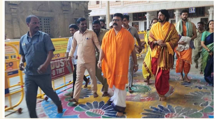
మంత్రాలయం, ఏప్రిల్ 27,(శ్రీచక్ర) :