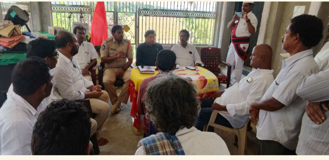
రామచంద్రపురం, ఏప్రిల్ 27 (శ్రీచక్ర) :