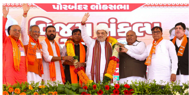
శ్రీపోరుబండర్, ఏప్రిల్ 27