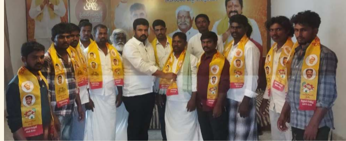
పెద్దకడబూరు, ఏప్రిల్ 27