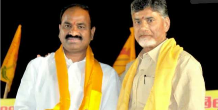
మంత్రాలయం, ఏప్రిల్ 27 (శ్రీచక్ర):