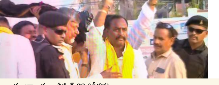
మంత్రాలయం, ఏప్రిల్ 28, (శ్రీచక్ర) :