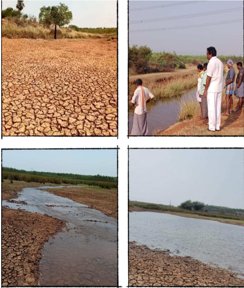
పుష్కలంగా నీరు చేరుతుం దన్నారు. ఈ పంటల నీరు విడుదల కోసం సాహసం చేసిన కేశవరం పంచాయతీ పరిధిలోని రైతులు, యువతరం అందించిన సహాయ సహకారాలు మర్చిపోలేనిది అని అన్నారు.